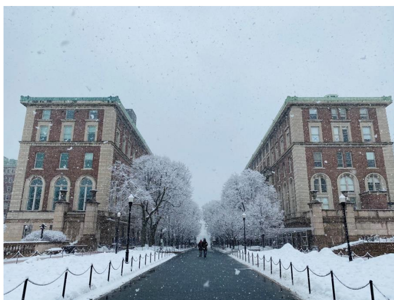
圖片 14 – 校園雪景