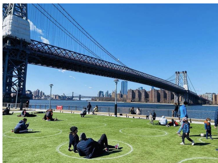
圖片 9 – 紐約市某河濱公園民眾社交距離情形