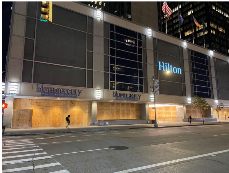
圖片 10 – 紐約市商店為防止群眾暴動於商店外搭設木板之情形

自疫情開始，紐約各地歧視亞裔事件頻傳，職於超市採買親身經歷兩次(含拒絕服務及謾罵)，另一次為在路上被不明人士跟蹤。在 5 月 25 日明尼蘇達州喬治·佛洛伊德之死事件(Killing of George Floyd)後，美國各地種族歧視與暴力事件數量急遽攀升，許多紐約市民不顧疫情的嚴重性仍擅自集會抗議，尤在 6 月 5 日水牛城爆發疑似警察執法過當事件(Buffalo Police Shoving Incident)後，各地亦爆發多起攻擊警察事件，導致紐約州警察公權力下降，不分晝夜，市區內街頭槍擊案及搶劫案不勝其數。此外，由於失業人口增加，街頭流浪漢十分猖獗，尤其 7 月 4 日美國國慶日前後，非法販賣煙火爆竹情況隨處可見，自 6 月中至 8 月中，幾乎每天半夜可聽到煙火及鞭炮四起與沖天炮的巨響，甚至無視宵禁政策，寧靜住宅區的街道上充斥著許多徹夜狂歡的派對活動，民眾即便報警仍無濟於事，最終導致許多市民紛紛搬離市中心，造成 109 年下半年曼哈頓的租房率降至近十年來最低[20]。