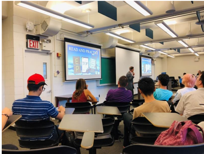
圖片 3 – PDL 課程上課情形

此外，PDL 教學團隊對於各系所均有分派一至兩名職業安排顧問 (Career Placement Officer)，除不定時寄企業職缺公告訊息給所屬系上學生，凡與求職相關如履歷修改、面試模擬、書信寫作洽詢等問題均可安排諮詢時間。