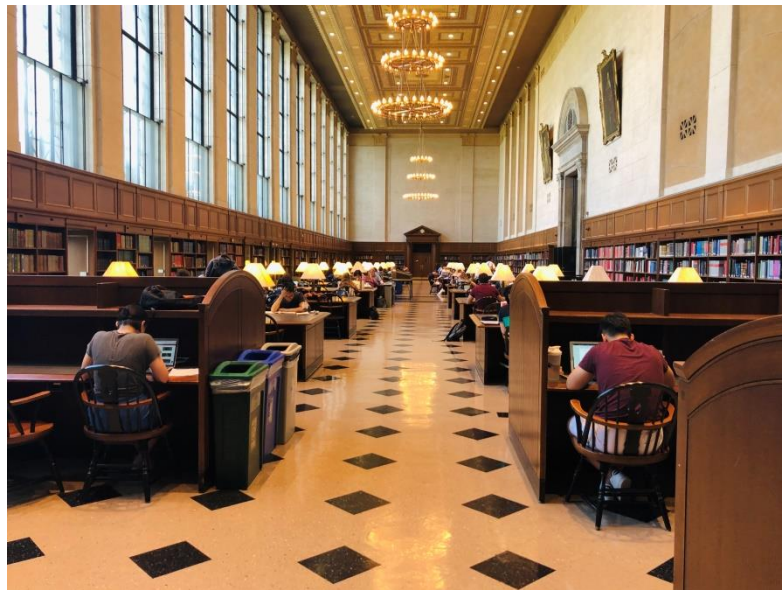
圖片 2 – 巴特勒圖書館內部實景(2)

節自西元 1901 年，計八十四位諾貝爾得主畢業於本校 [2] ，另著名校友包括美國開國元勳亞歷山大·漢密爾頓(Alexander Hamilton)、美國前總統西奧多·羅斯福(Theodore Roosevelt)、巴拉克·歐巴馬(Barack Obama)、美國前大法官魯斯·巴德·金斯伯格(Joan Ruth Bader Ginsburg)、量子電動力學物理學家朱利安·施溫格(Julian Seymour Schwinger)、物理學家羅伯特·密立根(Robert Andrews Millikan)、IBM 創始人赫爾曼·何樂禮(Herman Hollerith)及調頻廣播(FM Radio)發明者艾德溫·霍華·阿姆斯壯(Edwin Howard Armstrong)等。