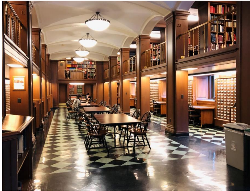
圖片 2 – 巴特勒圖書館內部實景(1)