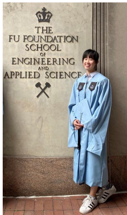
圖片 12、13 – 與校獅合照（左）、工學院門口（右）