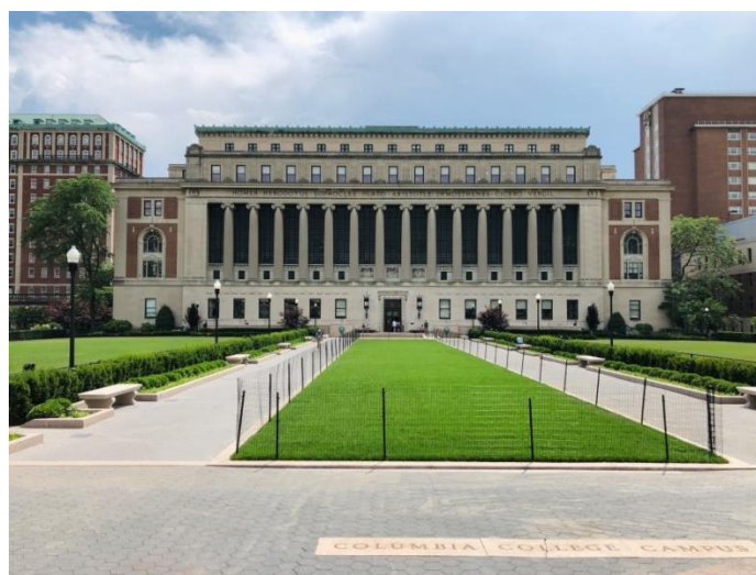
圖片 1 – 哥倫比亞大學總圖書館 – 巴特勒圖書館(Butler Library)

哥倫比亞大學為常春藤聯盟學校(Ivy League)之一及美國第五古老高等教育機構，為一所世界著名私立研究型大學，最初命名為國王學院(King's College)，於西元 1754 年由英國國王喬治二世(King George II of England)頒布之皇家特許狀(Royal Charter)所建立。主要校區位於曼哈頓市區之晨邊高地(Morning Heights)，多數校園建築被列入國家史蹟名錄(National Register of Historic Places)，目前校園組織由三所大學部學院、十三所研究所學院、一間醫學院暨醫學中心及四所隸屬機構組成，所有校區總計二十五間圖書館及超過 100 間研究機構中心，並於 1917 年創立新聞界最高榮譽普立茲獎(Pulitzer Prize) [1] 。