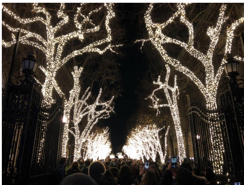
圖片 11 – 校園耶誕節前點燈活動(Columbia Tree Lighting)

工學院每年均於秋季學期正式開學前，舉辦迎新、校園導覽暨校園路跑、紐約市重要景點或博物館一日遊、百老匯劇欣賞等活動，鼓勵教授及新、舊生共同參與，費用由學院全額支出，目的為讓即將入學的新生能快速融入校園內、外之生活步調。學期期間，除 PDL 課程外，學校經常邀請政府或各業界之知名人士蒞校演講，全體師生及員工皆可自由參加（但由於場地限制，現場聽講僅限教授及優先報名學生，其餘人員可於線上收看），各系所更有許多如萬聖節派對、感恩節餐會、學生舞會、耶誕節餐會等活動，目的在希望所有學生能在課業學習之餘，透過參與各式活動，多方交友與增廣見聞。