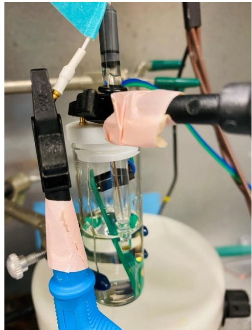
圖片 6、7– 實驗室外觀（左）、利用電化學方法對 PCB 樣本實施儀測（右）