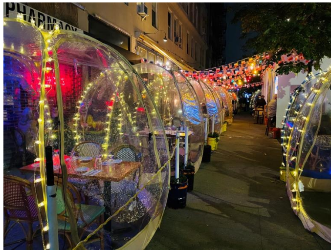
圖片 8 – 紐約市某餐廳於道路上搭設室外用餐區域

外出用餐方面，為遵守防疫政策與社交距離，紐約市於 7 月開始實施街道開放暨室外餐廳開放政策(Open Streets and Open Restaurants) [19] ，預計實施至 110 年 9 月，目的為透過關閉市區部分原車輛通行道路，開放該地區道路旁餐廳於道路上搭設室外用餐區域及開放民眾步行，另部分餐廳亦實施實名制，用餐人員須於用餐前填寫基本資料，如兩週內有相關確診人員，餐廳會通知該兩週內執勤員工及用餐民眾實施自主隔離，並將其通報紐約政府衛生部門。