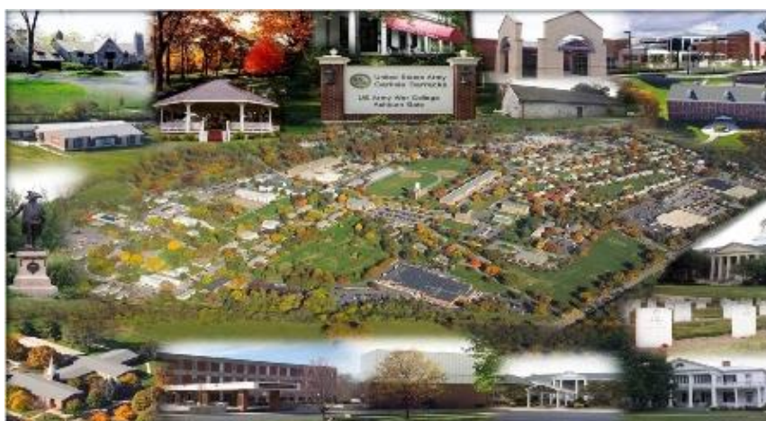
圖1 卡萊爾營區 Carlisle barracks

大戰期間，包括艾森豪將軍，喬治·帕頓，奧馬爾·布拉德利和海軍上將威廉·哈爾西將軍，均因接受戰院洗禮，而受益良多，在戰場上證明他們的能力。1951年10月因應召訓學員增加，以致舊營區空間不足，陸軍戰院遷移至賓州卡萊爾營區。卡萊爾營區是美國最古老的軍事設施之一。該營區自1757年以來，見證了美國內戰，其中最為人熟知的蓋茲堡戰役，聯邦軍士也曾助紂過，至今作為美國軍事訓練和教育領域的先驅，實有承先啟後的意涵。（圖1卡萊爾營區 Carlisle barracks）