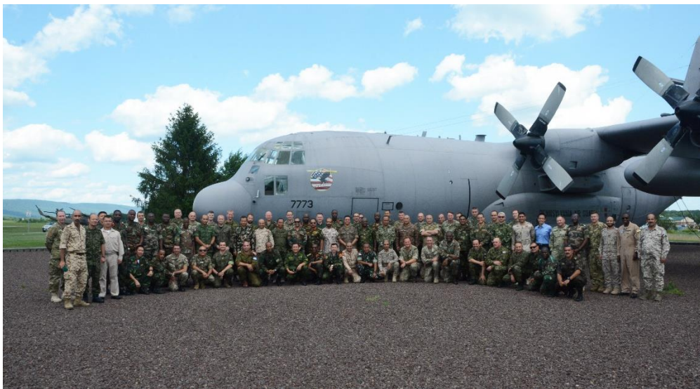
圖 4 國際學官參訪 Fort Indiantown Gap 訓練中心

Fellow Office ) 負責生活起居建議與諮詢、證件申辦、醫療服務、家眷照護等安家事宜。期間為增進國際學員認識美國文化，安排華府、費城等參訪，除能活絡同袍情誼外，亦有展示該國繁盛之意圖。就美國戰院為辦理單位立場而言，從行程規劃，住宿，餐飲及運輸往返均兼顧學員及其家眷，幼童照護需求，學員（政府及非政府組織）及眷屬（文藝、歷史景點）均安排參訪行程，如因故衝突或部分無法參加， IF 辦公室承辦室也有充分協調空間，讓參加人員長幼均感到安全感，直接影響國際學員對美國及該校之心理認同程度。