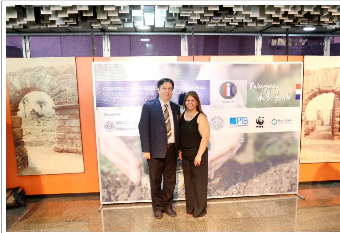
與英西語口譯員合影