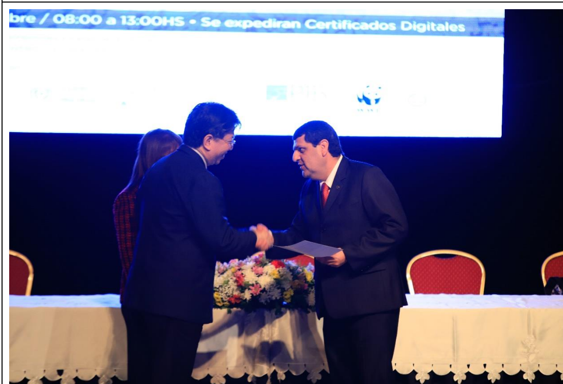
接受巴國消保部部長頒發感謝狀