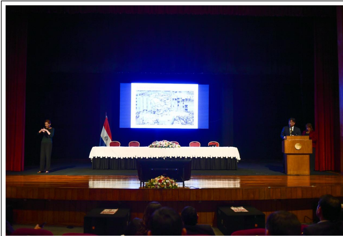
本處與談人簡報情形