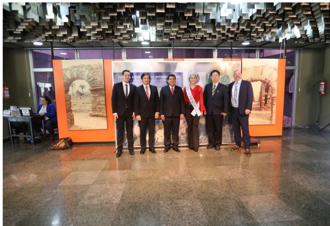
會後與各國演講者及巴拉圭消保部長、選美小姐合影