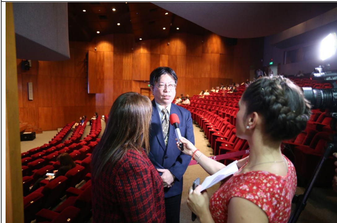
會前接受巴拉圭電視媒體訪問