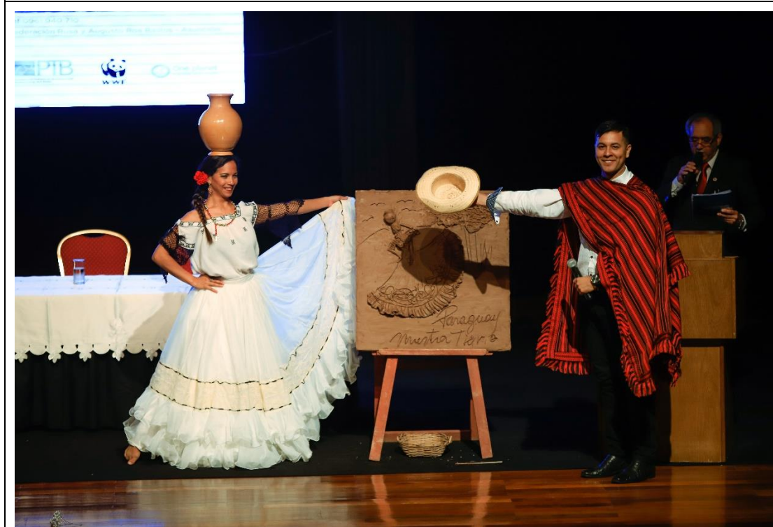
大會傳統舞蹈表演