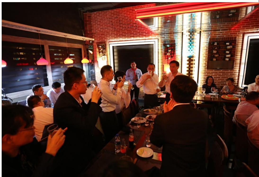
參加外交部吳部長晚宴