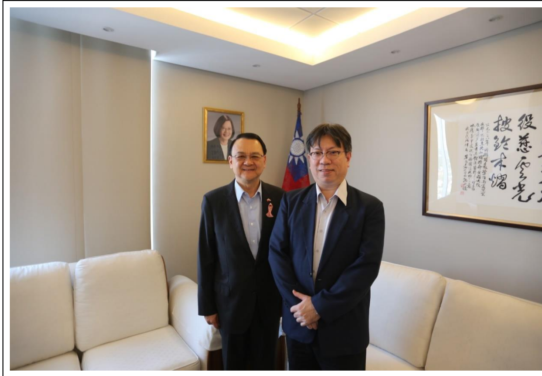
拜訪駐巴拉圭大使館與周大使麟合影