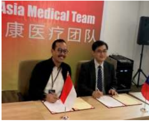
圖11、總院與巴淡島醫院簽約