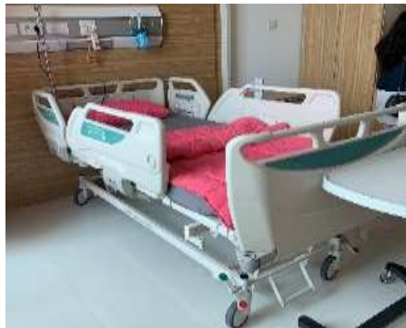
圖28、單人房使用Paramount電動床