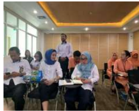
圖8、巴淡島醫院護理人員提問