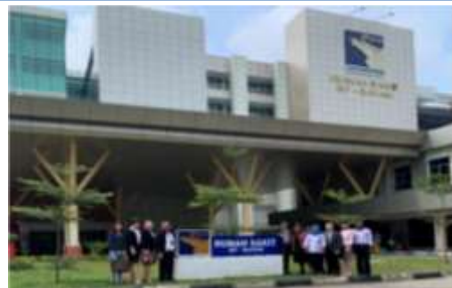
圖2、巴淡島醫院前合影