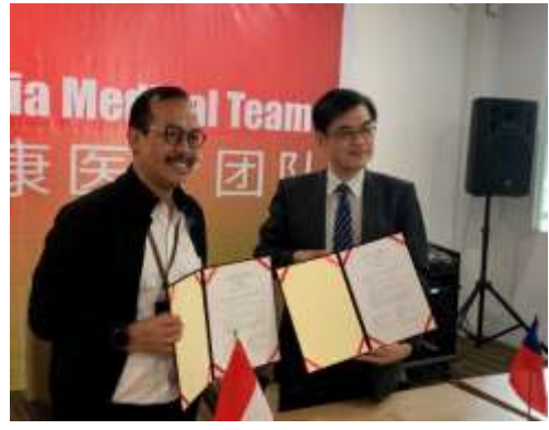
圖12、總院與巴淡島醫院完成簽約