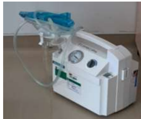
圖21、攜帶式抽吸設備