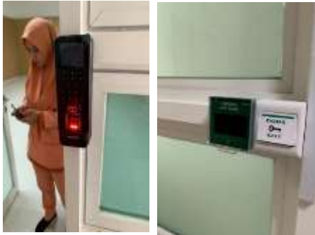
圖26、刀房刷指型進入