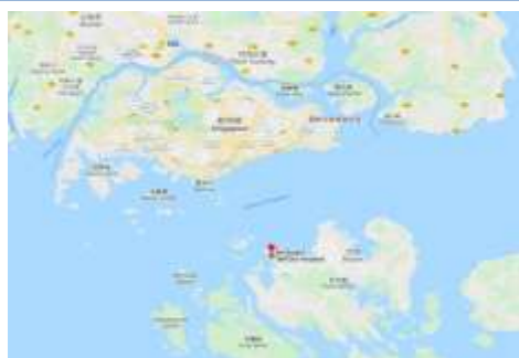
圖1、巴淡島距離新加坡20公里

巴淡島距離新加坡20公里(如圖1)，面積為715平方公里，人口為1,329,773人，其中印尼及馬來人佔86%，華人佔14%，巴淡島醫院(BP Batam Hospital)位於巴淡島西北方(如圖2)，於今年5月完成整修，為一287床之市立醫院，具35位專科醫師及200位護理師，為當地之轉診醫院，此次3天行程主要目的是與印尼巴淡島醫院簽訂護理教育合作協議，期間安排了簽約儀式、參訪醫院及辦理記者會，巴淡島醫院除發展心血管中心外，目前籌建老人照護中心及癌症治療中心等大樓，故需要合作培訓護理專業人才，也期望未來是護理專業的培訓中心，負責代訓印尼其他醫療機構護理人員。