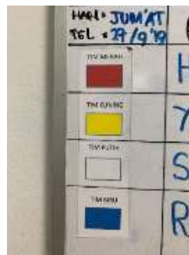
圖37、災情動員以顏色管理