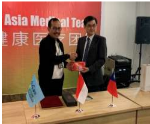
圖15、總院與巴淡島醫院代表 互贈紀念品