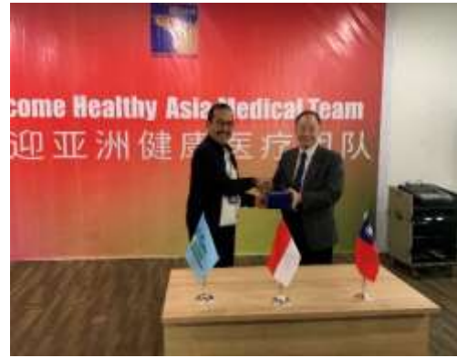
圖18、本院與巴淡島醫院代表 互贈紀念品