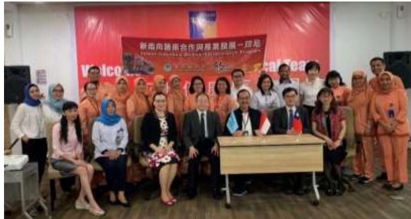
圖19、簽約完成後合影