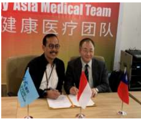
圖13、本院與巴淡島醫院簽約