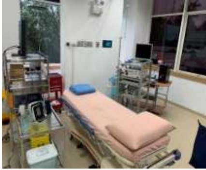
圖24、內視鏡室(支氣管/胃/大腸鏡)