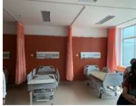
圖25、內視鏡室留觀床