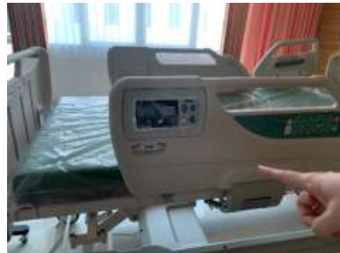
圖29、VIP使用Paramount體重監測病床