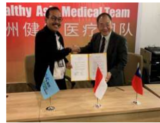
圖14、本院與巴淡島醫院完成簽約