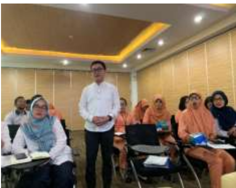
圖9、巴淡島醫院護理人員提問