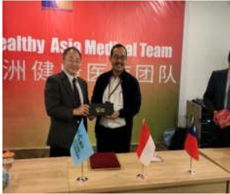
圖17、本院與巴淡島醫院代表 互贈紀念品