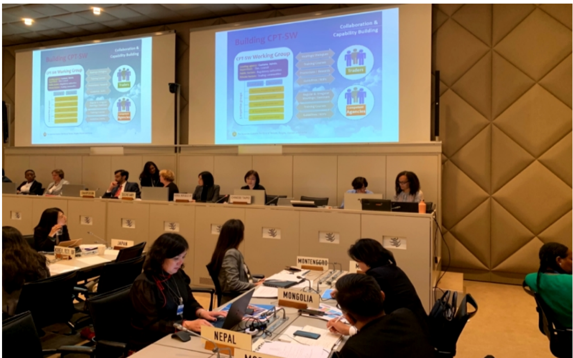
我國關務署代表於 WTO CTF 分享「關港貿單一窗口」建置經驗