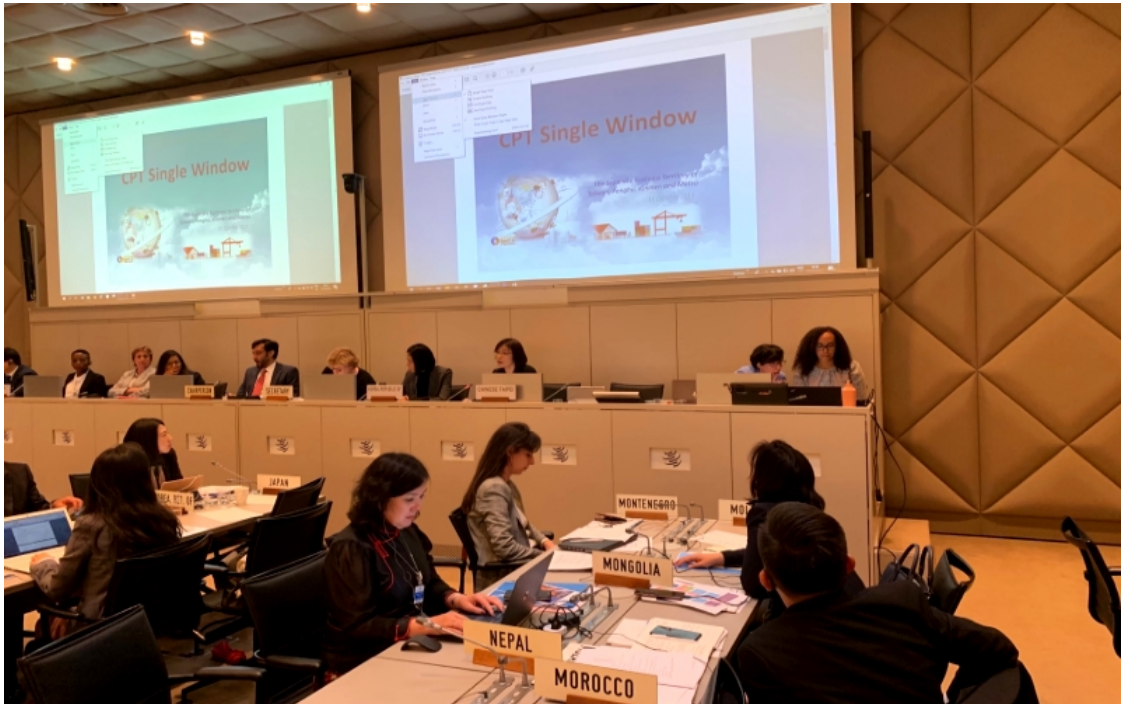
我國關務署代表於 WTO CTF 分享「關港貿單一窗口」建置經驗