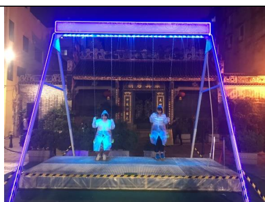
水幕鞦韆，利用鞦韆上自然落下之水幕結合 LED 燈光，讓鞦韆充滿現代感，吸引遊客目光。

6.聖若瑟修院聖堂：聖若瑟修院聖堂的光雕表演是南西灣區的主軸之一，在 2019 年澳門光影節，有 3 個國家隊伍分別於 12 月份的前中後時期進行光雕秀，包括葡萄牙隊的「Macao's Light Journey」、日本隊的「FLIGHTGRAF」及澳門隊的「澳門隔離屋工作室有限公司」，本團前往觀賞的即是澳門隊，澳門團隊創作主題為「同賀 20！」，在 5 分鐘多的光雕秀中，透過多元豐富的色彩畫面慶祝澳門回歸，並透過各種意象寓意表現澳門充滿希望的未來，包括樹苗成長茁壯、動物們群聚歡慶、日式廟宇慶賀、葡萄牙式建築、超現實光雕等，最後並以蓮花、天鵝及蛋糕慶祝澳門回歸 20 年。