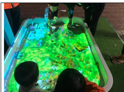
AR 魔幻沙桌，利用投影及沙桌的結合，讓單純的投影互動增添變化性，小朋友可任意發揮想像樂在其中。

AR 魔幻沙桌是一款體驗式互動遊戲，將實體沙桌與投影技術相結合，透過高低不平的堆沙和挖沙的方式，呈現不同的視覺效果，水幕鞦韆是水幕、燈光與鞦韆的互動結合，2 種設施都是以既有常見的技術，透過不同的組合，給人耳目一新的感覺。