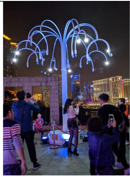
夢幻泡泡樹:在樹梢形成泡泡，隨著光環境飄落，是親子互動的快樂遊憩區

3.嘉模堂區光環境：嘉模堂區腹地較廣，各燈組織間的連結與導引，有賴光環境的營造，在各節點廣場更是燈光配置的重點，由消防局前地往龍環葡韻之間，就利用大量鬱金香等花海結合燈光、在長廊步道中掛起