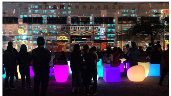
逸園跑狗場「繽紛雅座」光影藝術設施

(2) 筷子基北灣休憩區：筷子基北灣休憩區－是屬於筷子基在地居民重要公共休憩空間，2019 澳門光影節利用休憩區內的既有設施佈展了「繽紛萬千」及「夢幻風車」兩個展演主題，其中，繽紛萬千透過燈光和鏡面的巧妙設計，讓遊客進入繽紛的萬花筒世界，欣賞到千變萬化的自己，雖然此區遠離大三巴牌坊及聖若瑟修院聖堂等澳門光影節主要