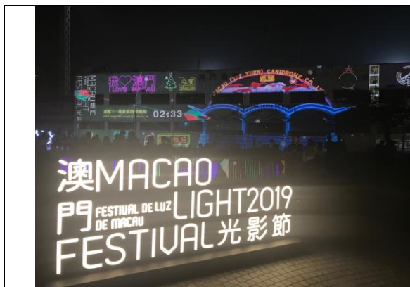
逸園跑狗場光雕場地

辦了最後一場賽事後停業，期間跑狗場亦曾多次出借附近學校作為運動賽事的場地，目前該場地澳門政府正規劃作為日後學校村用地；本次澳門光影節選定這個對於澳門甚至是亞洲都極具特殊意義的場所作為北區光雕表演主場地，表演的主題「逸緣憶記」正是象徵澳門人對於這個賽狗場深刻的年代記憶，光雕藉由對於一場場的運動賽事的呈現，讓澳門人對於兒時的回憶重現，也象徵澳門隨著時代脈動前進地腳步。