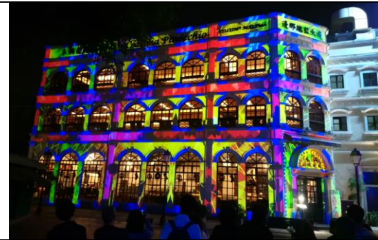
葡韻之葡式美食劇目，利用既有葡國餐廳進行展演，讓遊客更加有感及讓更光雕展演效益加成