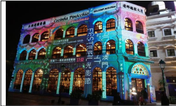
木偶葡國餐廳外牆標示下一場表演時間剩餘 17:52 分，是貼心友善的提示