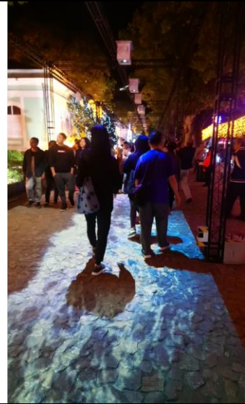
愛如潮水:光雕結合科技，互動的波浪與音效，讓遊客在行進間彷彿走在沙灘海浪之間，浪漫悠閒

C.夢幻泡泡樹，可以從泡泡樹枝末梢吹出泡泡，在光環境中彷彿有五顏六色的氣泡飄散在空中，小朋友總是圍繞著夢幻泡泡樹迎接泡泡，是很受歡迎的親子互動區。