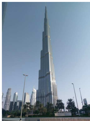
杜拜最高摩天大樓哈里發塔

杜拜（Dubai）是阿聯人口最多的城市，也是中東地區的經濟和金融中心。位於波斯灣東南岸，為該國 7 個酋長國之一杜拜邦的首府。做為阿聯經濟中心，杜拜已經成為國際化城市，同時也是世界主要客運及貨運樞紐。1960 年代，杜拜經濟開始趨向貿易路線，並且開始實施小規模的石油勘探。1966 年發現石油，1969 年起開始出口石油。石油收益加速杜拜早期城市發展，但石油儲量有限且產量不高，目前經濟發展以資本投資和旅遊、貿易、服務業等為主，石油收益佔比低於 5%。杜拜面積約 3,900 平方公里，相當於我國臺東縣面積，在過去 30 年積極發展建設下，基礎設施完善、道路寬敞、交通便捷、市容整潔美觀、高樓林立、服務設施管理井然有序。杜拜採行西方商業模式，經濟發展主要依賴觀光業、航空業、房地產及金融服務業。隨著創新大型建築計畫、舉辦運動賽事提高城市關注度，杜拜也成為摩天大樓的指標城市，著名的哈里發塔便座落於此。