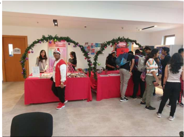
MDX Dubai 校內學生耶誕慶祝活動。

學生將參加營運模擬遊戲，透過模擬遊戲來增進學生對整個市場決策過程的理解和掌握。模擬遊戲涵蓋整個營運議題，例如區分、定位、分配、廣告預算、售後服務、定價、預測、行銷研究、競爭對手分析、