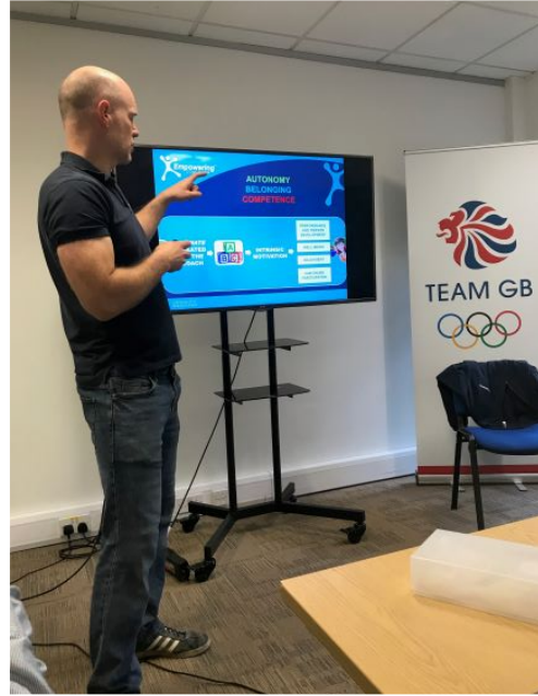
現場觀摩賦權教練動機氣候工作坊 (Empowering Coaching workshop)的實施