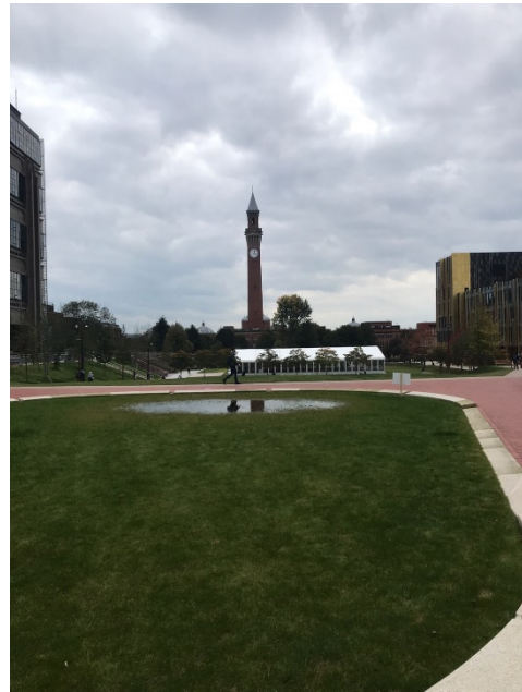
英國伯明罕大學校園著名的鐘樓(Old Joe)