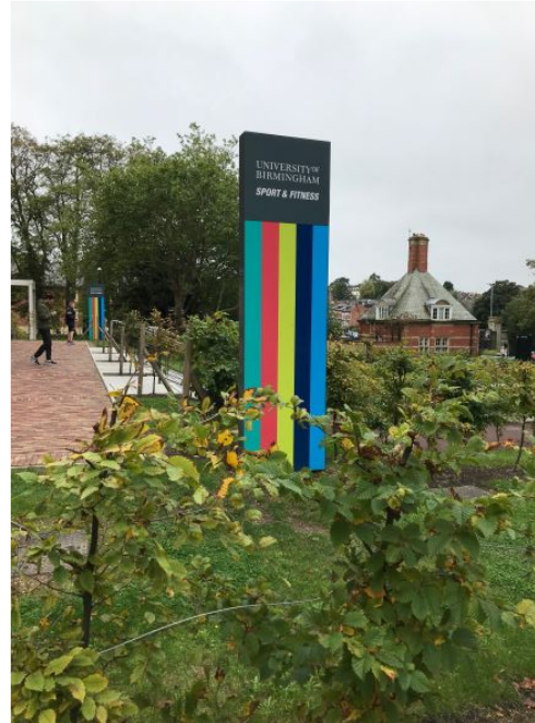
學校多功能體育館之戶外意象指標