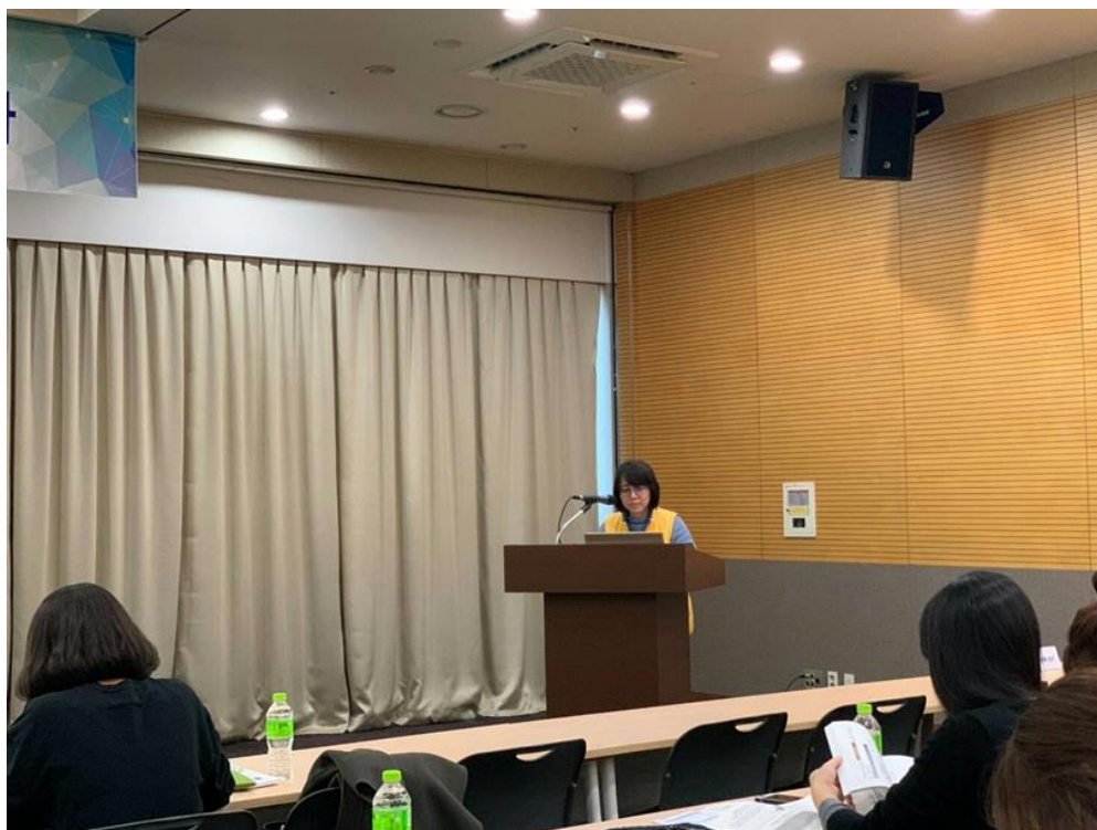
圖四、向韓國化粧品業者介紹臺灣特定用途化粧品許可證申請方法及所需資料、變更登錄