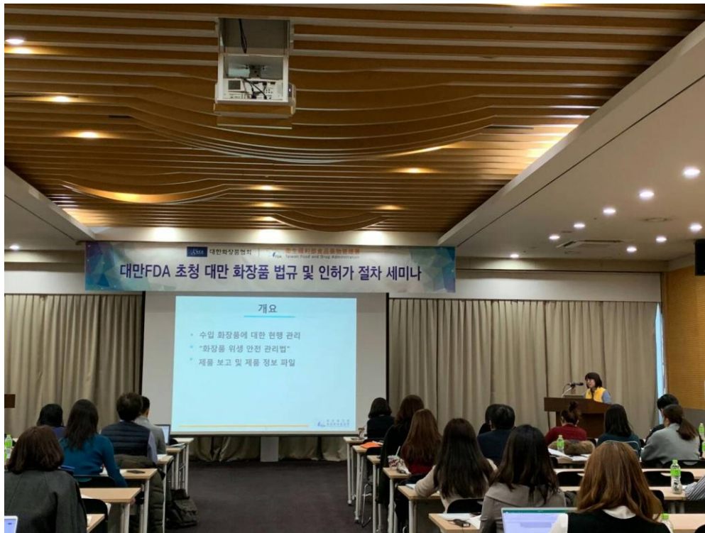
圖三、向韓國化粧品業者介紹臺灣進口化粧品管理概要、「化粧品衛生安全管理法」法規介紹、產品登錄方法及產品資訊檔案的建立