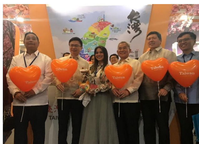
貴賓參觀展覽合影