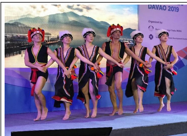
文化表演-台灣原主民舞蹈