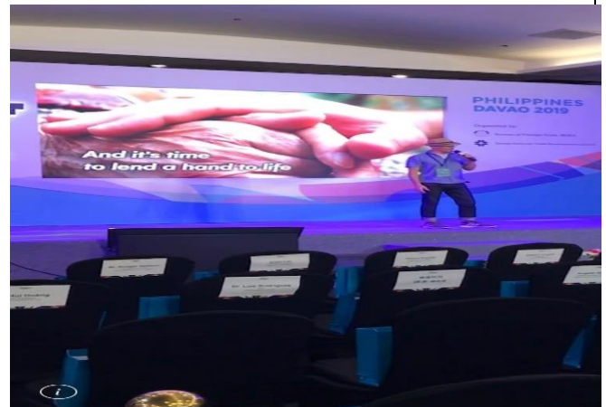
開幕典禮表演-男女合唱四海一家(We are the World)