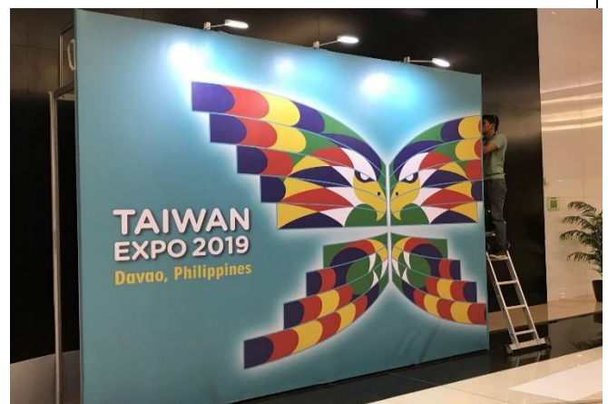
開幕典禮-臺灣形象展入口意象:以台灣蝴蝶意象融合菲律賓老鷹