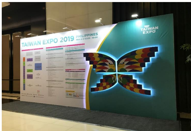
臺灣形象展節目流程與場佈圖