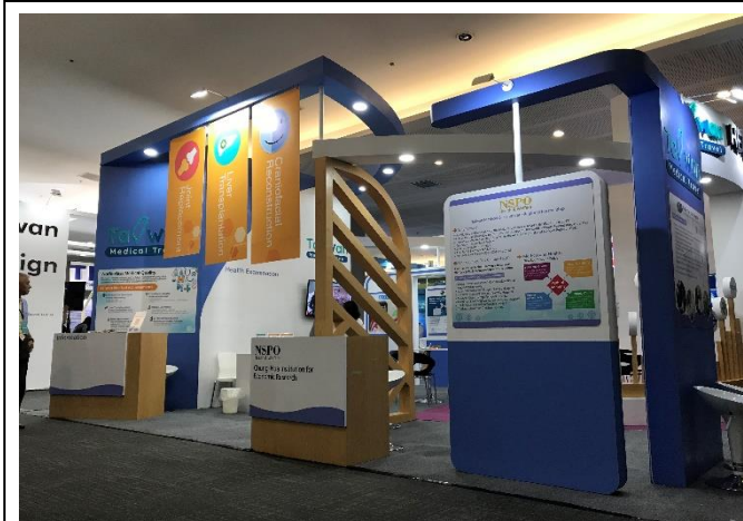
臺灣健康產業形象館