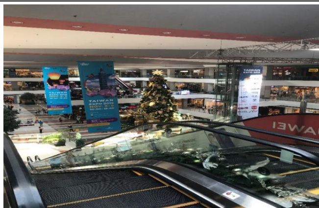
SM Lanang Premier Mall 一樓懸掛台灣形象展廣告