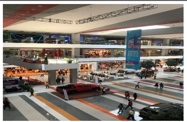
SM Lanang Premier Mall 一樓懸掛台灣形象展廣告