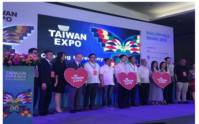
開幕典禮-與會出席貴賓共同合影