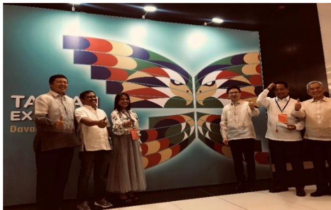
貴賓於入口意象合影