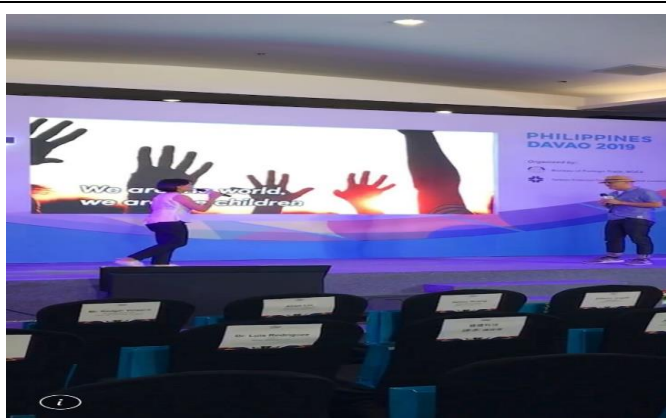
開幕典禮表演-男女合唱四海一家(We are the World)