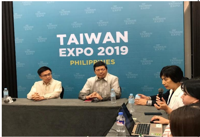
本局曾秘書參加貿協黃董事長之媒體聯訪