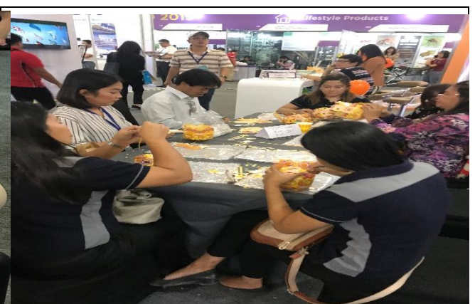
當地民眾體驗製作天燈