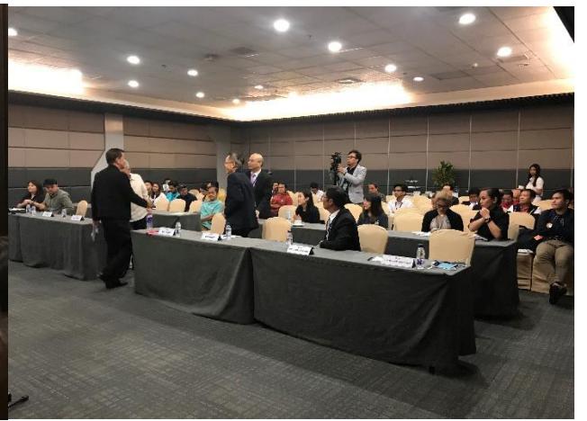
台灣創新科技帶動城市轉型論壇