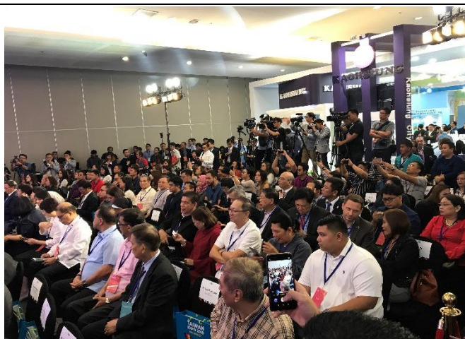
開幕典禮出席盛況