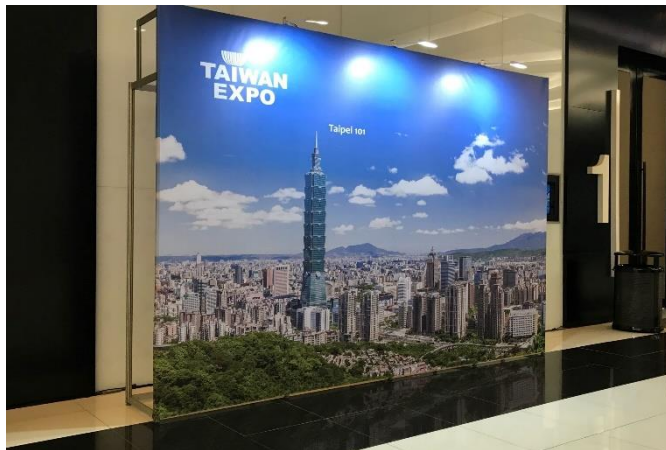
開幕典禮-臺灣形象展入口意象