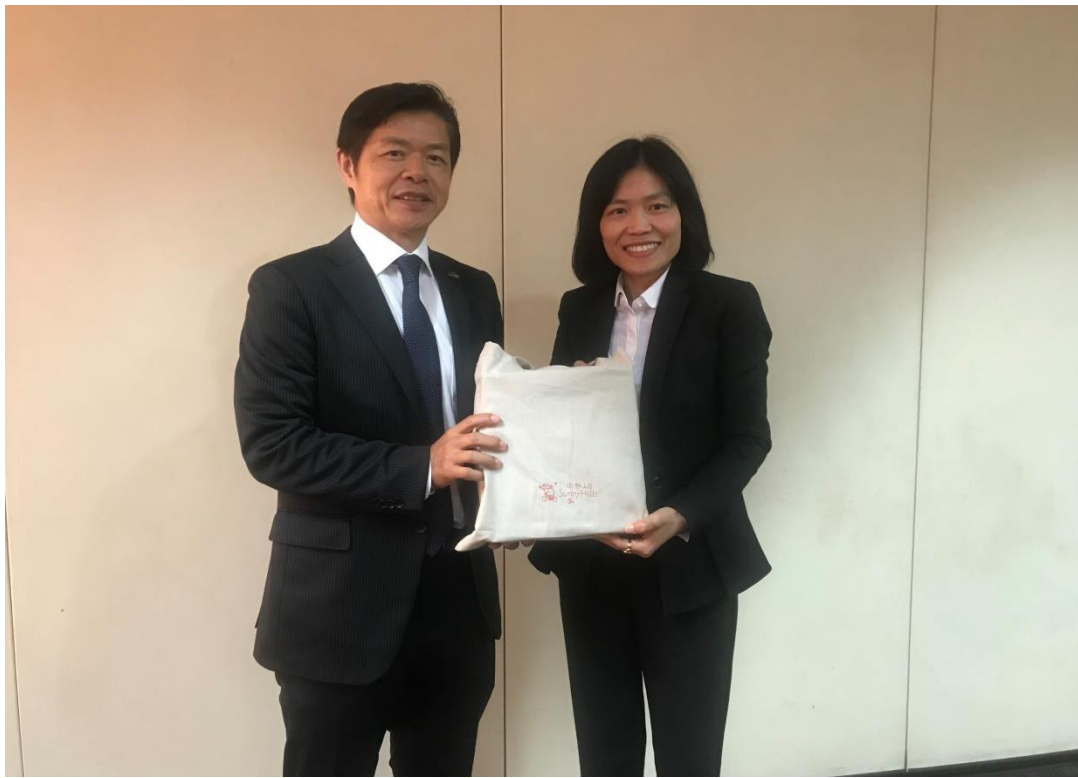
拜會泰國投資委員會 BOI