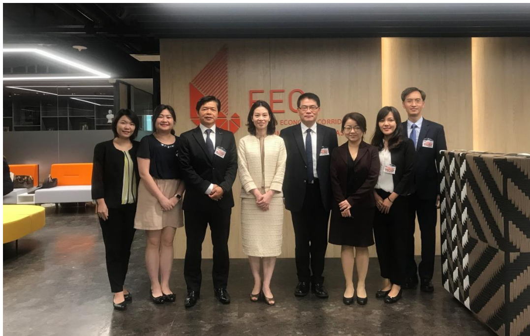
拜會東部經濟走廊辦公室