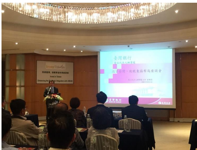
照片 5：臺灣銀行留代表國賓簡報