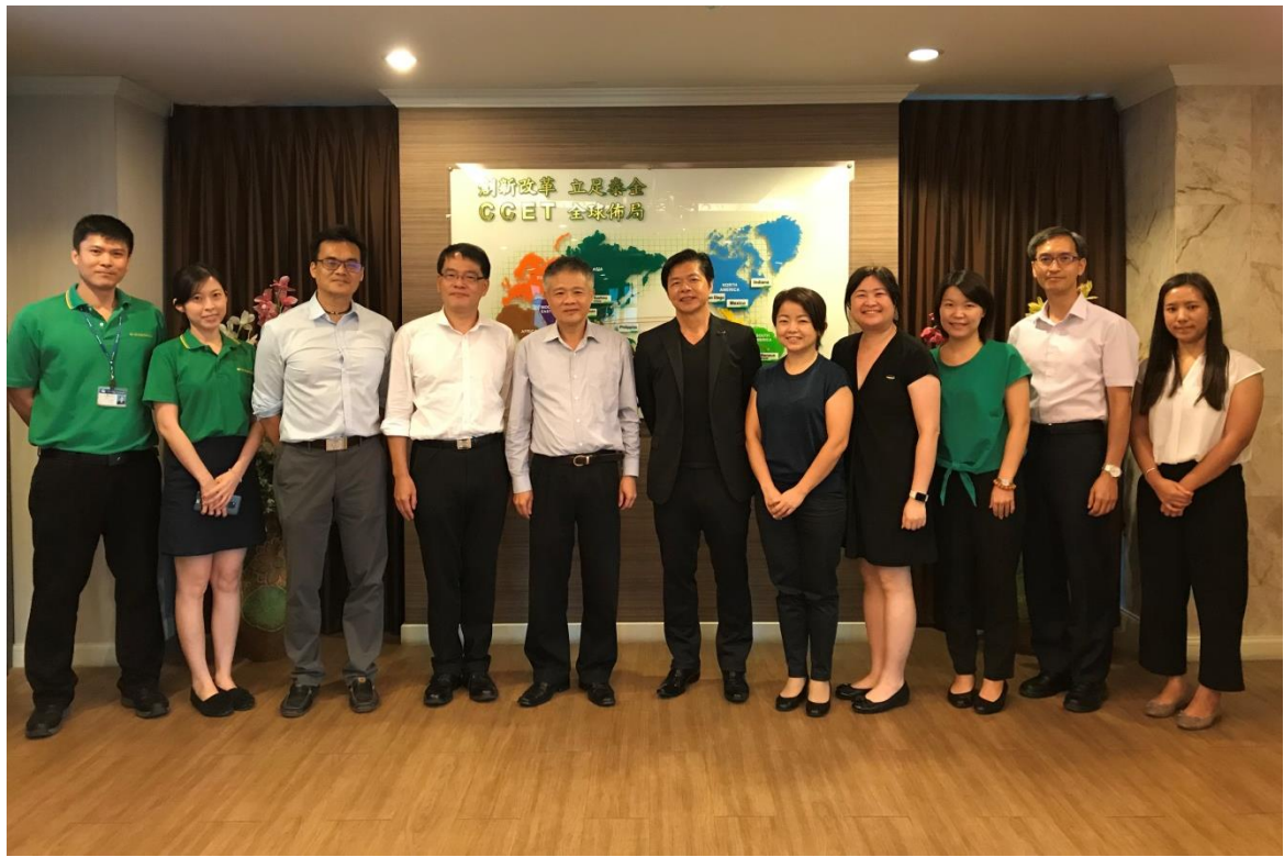
拜會泰金寶電通公司