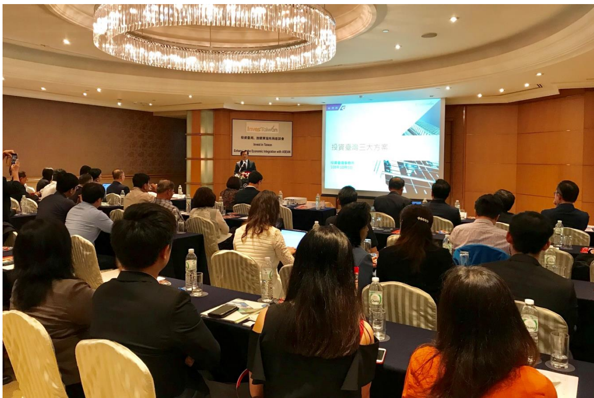
參加「投資臺灣、放眼東協布局座談會」，並簡報「投資臺灣三大方案」