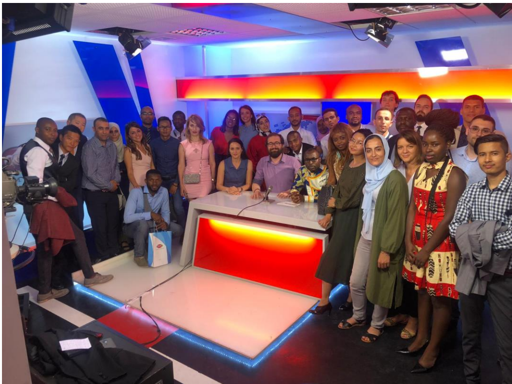
TRT 電視展示館內部展區—攝影棚