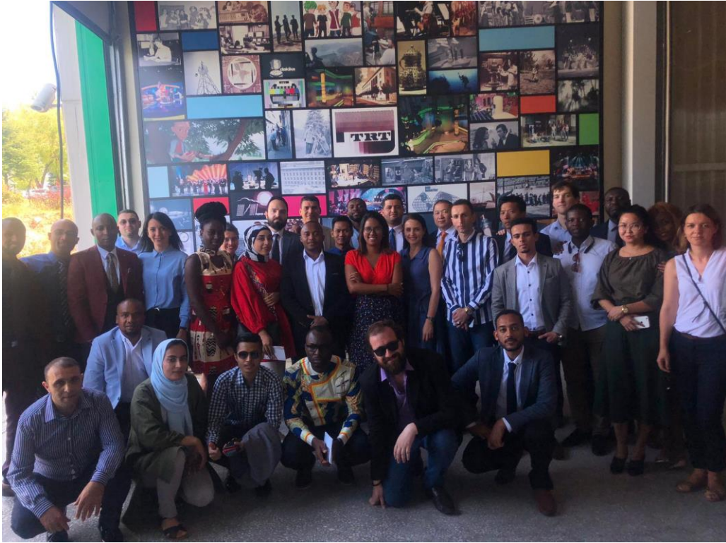
土耳其廣播電視公司(Türkiye Radyo Televizyon Kurumu, TRT)將淘汰退役之電視攝錄器材成立展示館，開放外界參觀，其為展示館入口處。