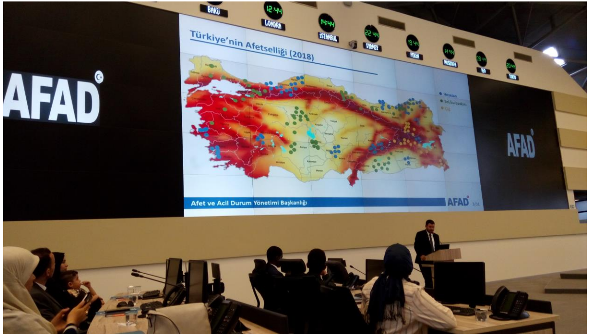
參訪土耳其災害與應變管理中心(Afet ve Acil Durum Yönetimi Başkanlığı)