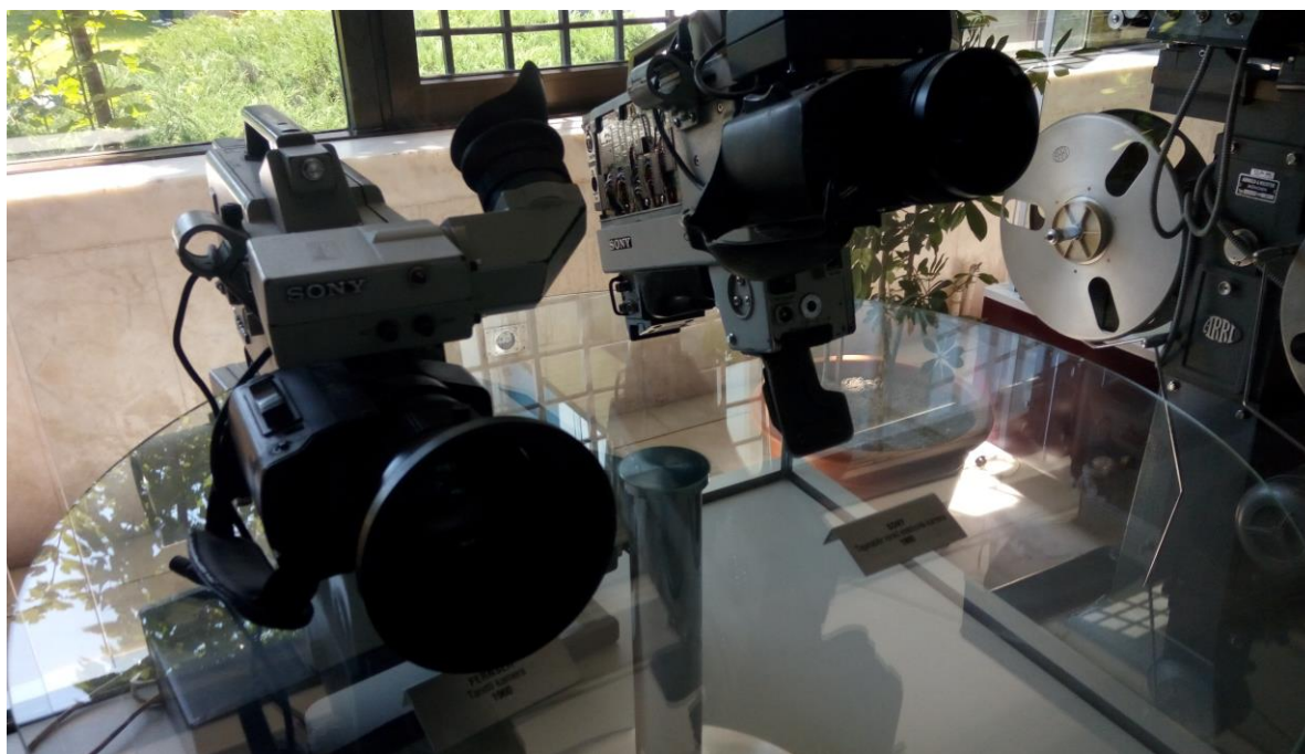
TRT 大樓內展示多部古董攝影機，見證土耳其的影視發展歷史。