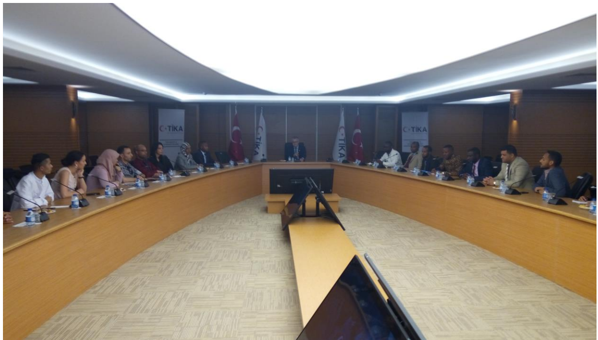
參訪土耳其合作暨協調署(Türk İşbirliği ve Koordinasyon Ajansı Başkanlığı)