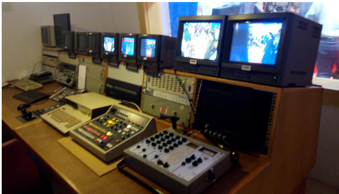
TRT 電視展示館內部展區—導播台