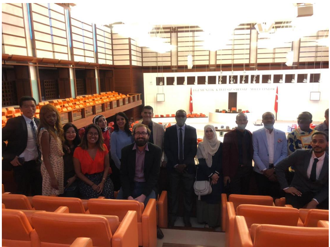
參訪土耳其大國民議會(Türkiye Büyük Millet Meclisi)