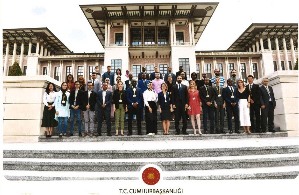
參訪土耳其總統府(Türkiye Cumhuriyeti Cumhurbaşkanlığı)