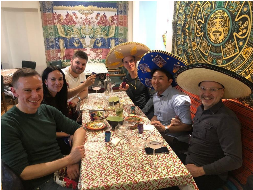
會後與歐盟執委會就業總署國際事務處同仁餐敘合照