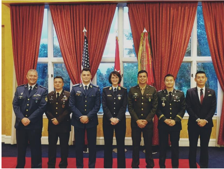
ISD舉辦之華盛頓參訪， 與各國駐外武官及海軍陸戰隊營區指揮官會面晚宴餐會