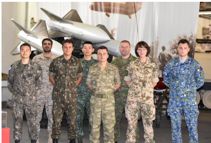
參訪營區內防空武器博物