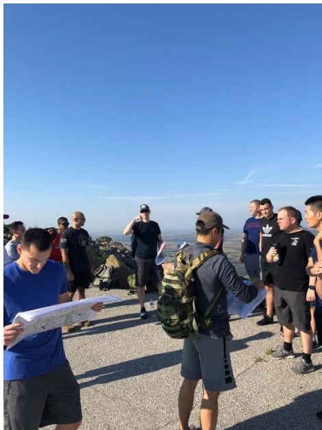
圖上及現地結合偵查