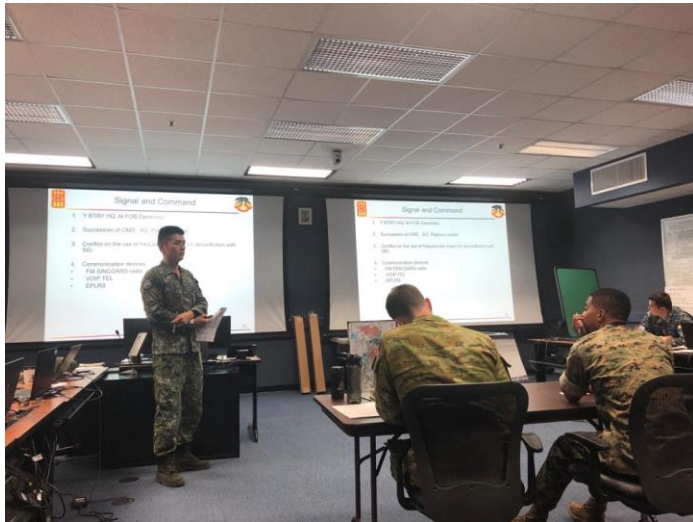
學員課堂口頭報告