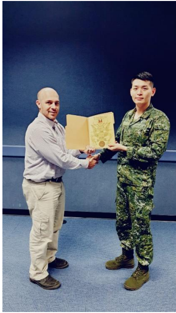
頒發課程結訓證書