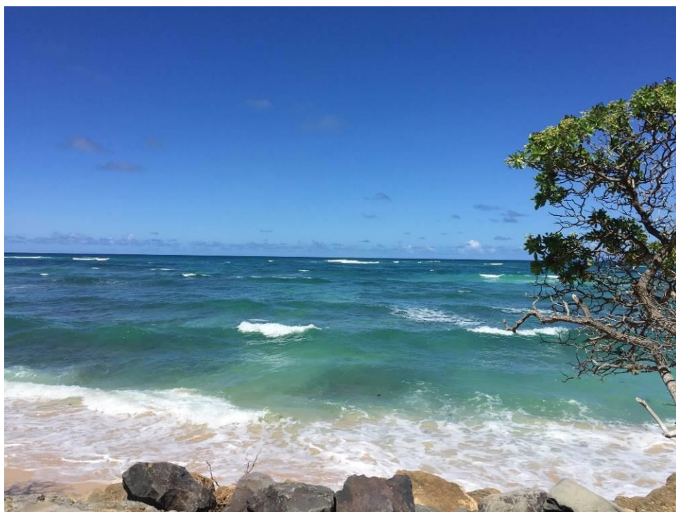
(圖八)海的另一邊是台灣