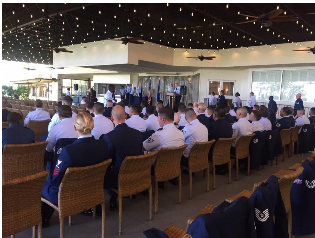
(圖十二)結訓典禮彩排