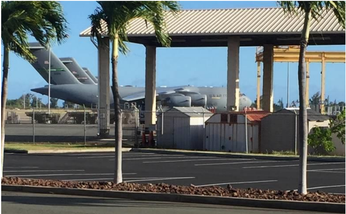
(圖六)C-17 運輸機支援關島載運任務