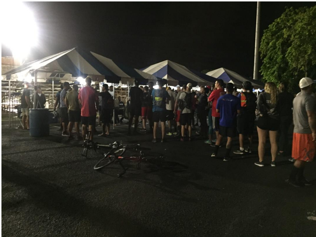
(圖十) 希肯空軍基地半碼路跑報到