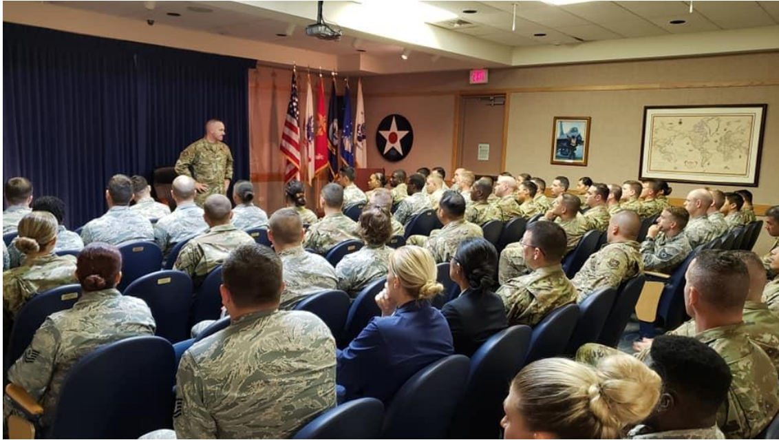
(圖五) 北太平洋區士官督導長至美士官學院慰問學員