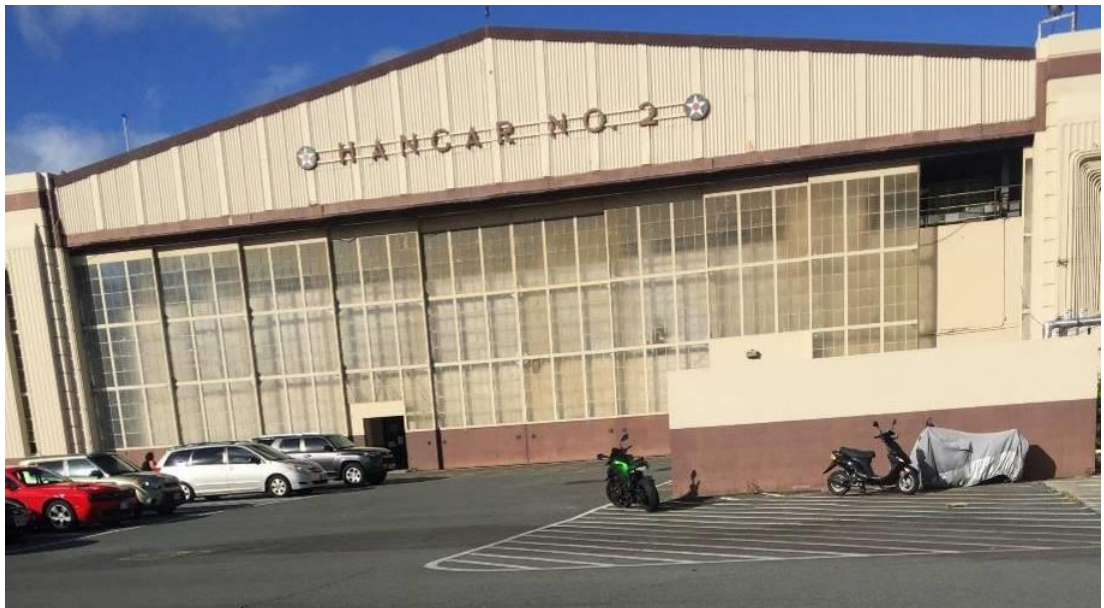
(圖四)第二次世界大戰倖存建築