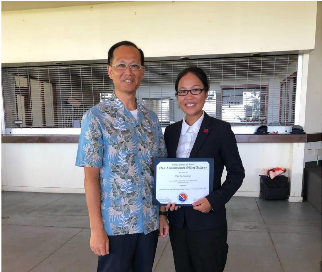
(圖十三)與總士督長合影