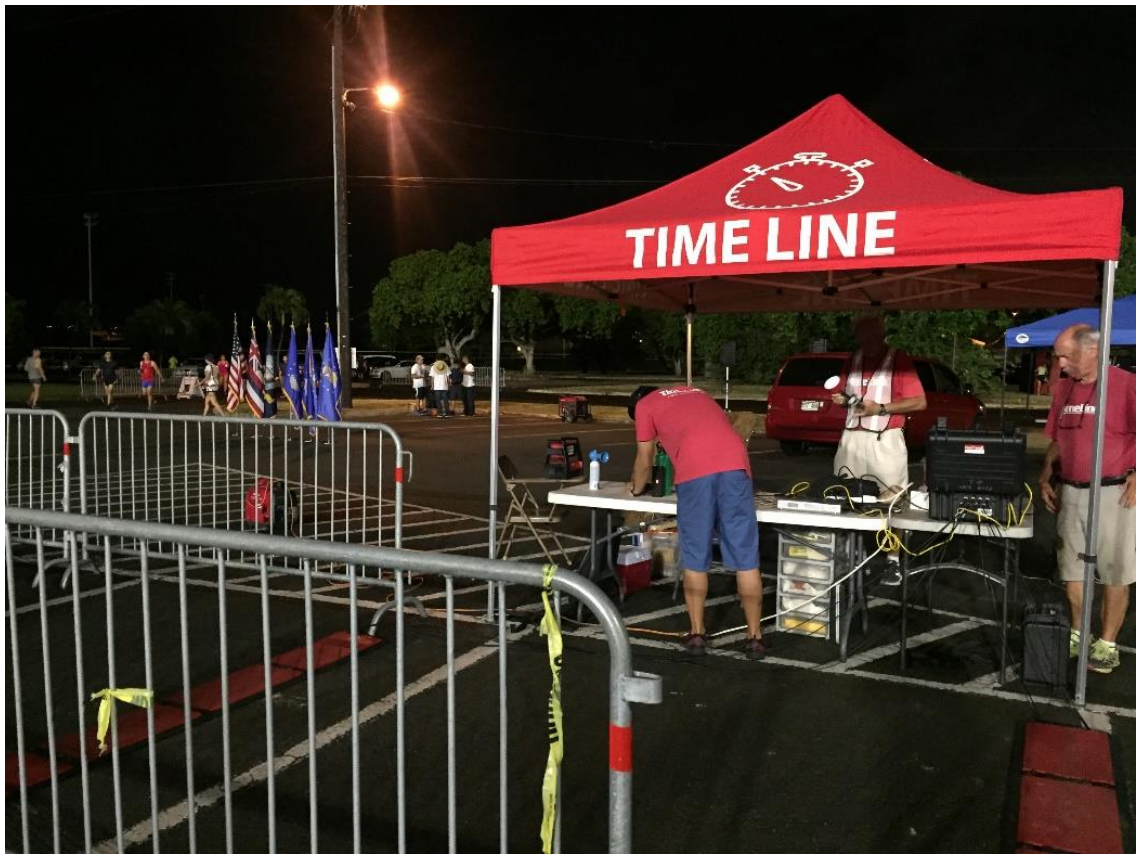
(圖九) 希肯空軍基地半碼路跑支援