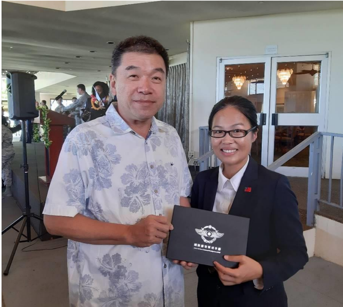
(圖十四)與副司令合影