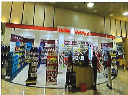
圖 7:便利商店外觀圖

巴林機場商業設施方面因為受限於航廈面積較小，故能發揮場地較受限，管制區外僅有 1 間便利商店與 4~5 間餐廳(如圖 7、圖 8)，管制區內免稅店也僅為一條街(圖 9)。因為巴林土地面積不大，且公共運輸設備不發達，故來巴林的旅客多以租車來代步，使航廈內最多的商業駐站單位為租賃汽車廠商。