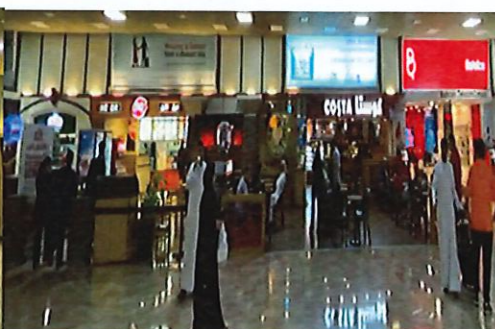
圖 8:美食餐廳外觀圖