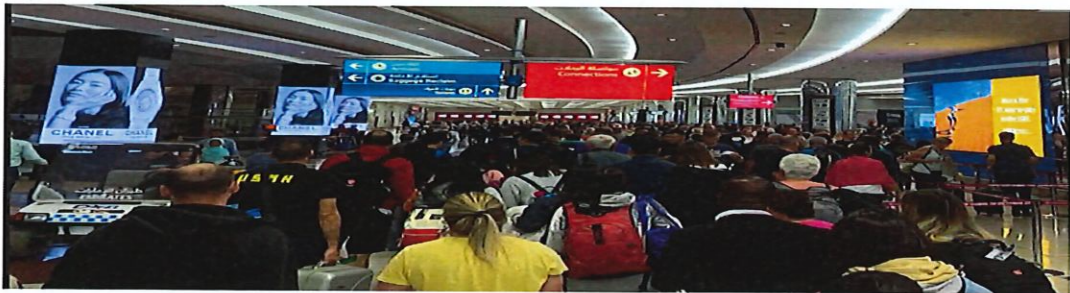
圖 17:杜拜機場轉機旅客人潮