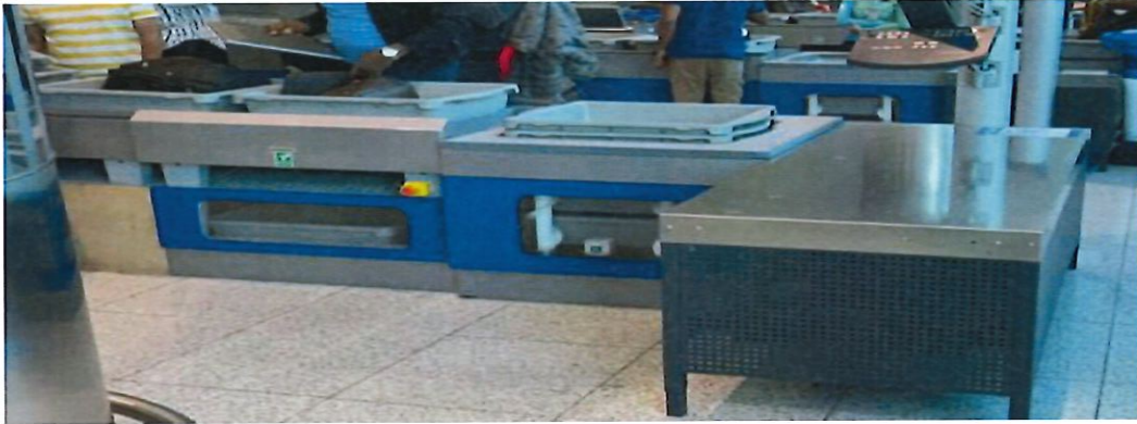
圖 18:杜拜機場安檢行李托盤自動輸送帶(終點)