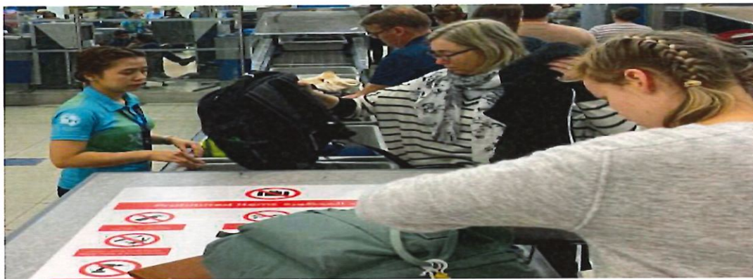
圖 19:杜拜機場安檢行李托盤自動輸送帶(起點)

二、 持續追蹤日韓貿易戰影響對來台旅客影響: 日韓貿易戰造成韓國來往日本旅客人次減少 50%以上，如圖 20 交通部觀光局觀光統計資料庫顯示日本與韓國來台人次在 2019 年 10 月較去年同期，日本成長 13.86% (181,797 成長至 207,000)，韓國成長 38.92%(90,026 成長至 125,060)代表韓國旅客有因日韓貿易戰而轉往台灣旅遊的趨勢，後續可持續觀察日本與韓國來台旅客成長趨勢。