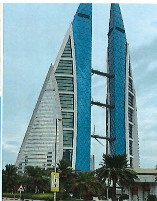
圖 2:附風力發電大樓