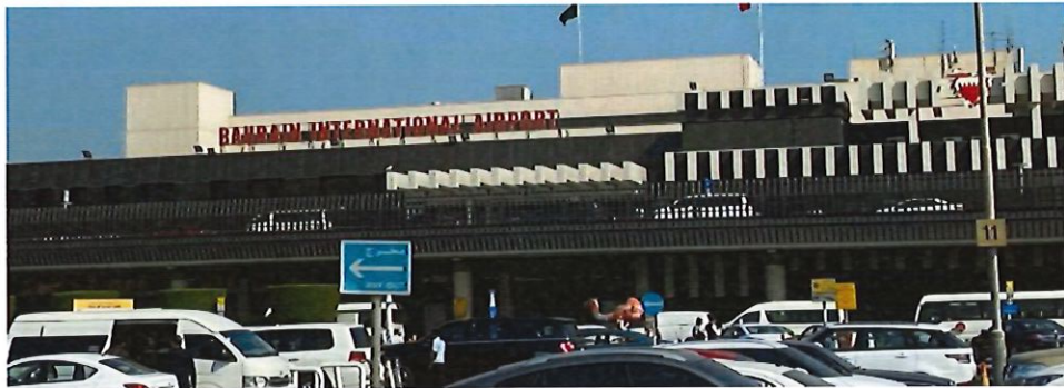
圖 3:巴林機場航廈外觀

巴林機場目前有 27 個客運航空公司與 11 個貨運航空公司進駐。可抵達 55 個城市，每週出發航班約 783 個航班。巴林機場航廈設施因為設計容量僅為每年 400 萬旅客人次，故包含入出境相關設施多為小而巧，包含出境報到櫃台僅為一條線的方式，故容易造成擁擠的情形(詳圖 4)，另一方面巴林機場也有提供自助報到櫃台(詳圖 5)，但目前僅有提供海灣航空的旅客可以使用，另因為宗教與民情風俗，在男廁內有設置洗腳位置(詳圖 6)，也展現巴林機場對於旅客的用心。