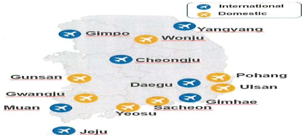
圖 11:韓國機場公社管理機場分布圖

司，管理除仁川機場外 14 個機場(包含 7 個國際機場與 7 個國內機場)。7 個國際機場(分布圖詳圖 11)分別為:濟州、金浦、金海、大邱、務安、清州、襄陽。其中濟州與金浦機場運量分別為 3,100 萬與 2,500 萬人次。