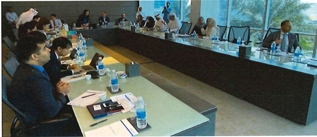
圖 15：會議討論與交流