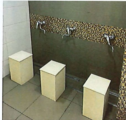
圖 6:男廁內洗腳設施

巴林機場商業設施方面因為受限於航廈面積較小，故能發揮場地較受限，管制區外僅有 1 間便利商店與 4~5 間餐廳(如圖 7、圖 8)，管制區內免稅店也僅為一條街(圖 9)。因為巴林土地面積不大，且公共運輸設備不發達，故來巴林的旅客多以租車來代步，使航廈內最多的商業駐站單位為租賃汽車廠商。