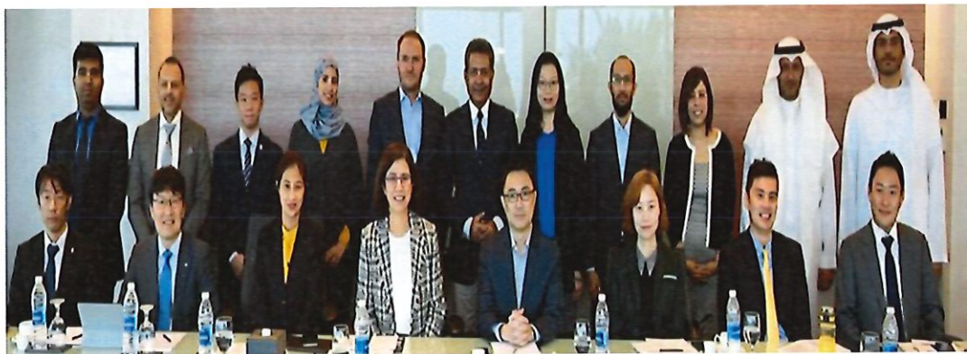
圖 16：各會員代表於巴林 Art Rotana 合影