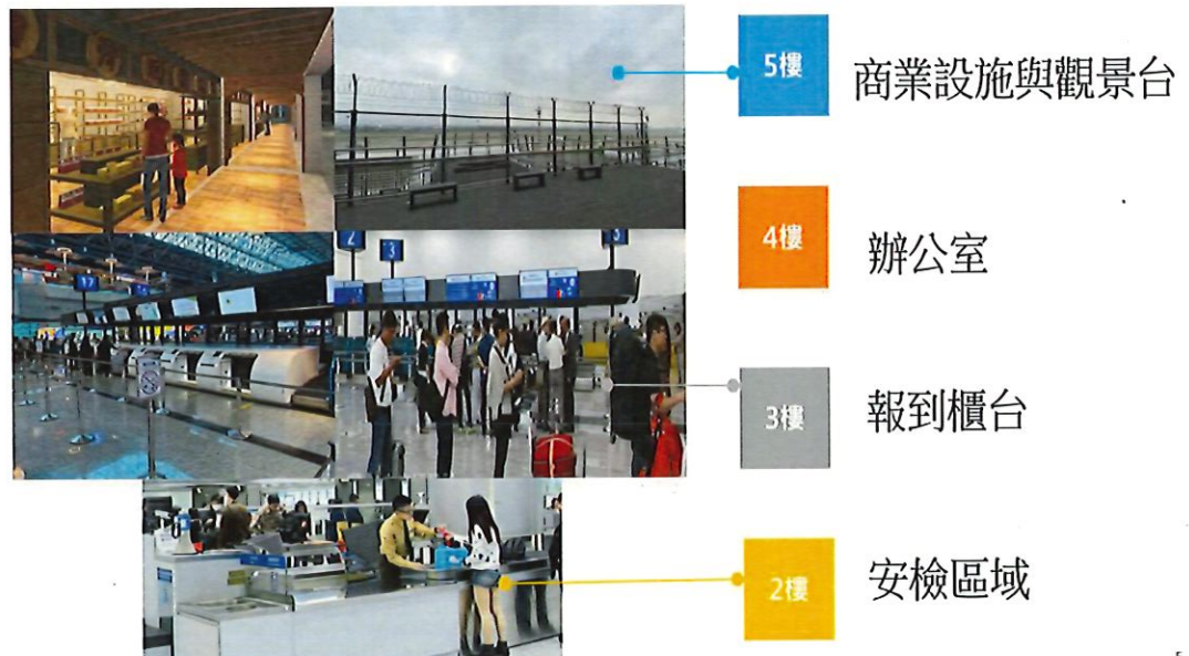
圖 14 桃機二航廈擴建區空間配置

第二航廈擴建區域使用空間配置詳圖 14，包含 2 樓安檢空間、3 樓出境報到櫃台(含 28 台自助報到設備)、4 樓辦公室空間，5 樓則為商業設施空間與觀景台，目前大部分空間都已開放使用，增加旅客可使用空間，同時也開放 5 樓上業設施空間供廠商進駐，帶給旅客更多便利的用餐與購物環境。