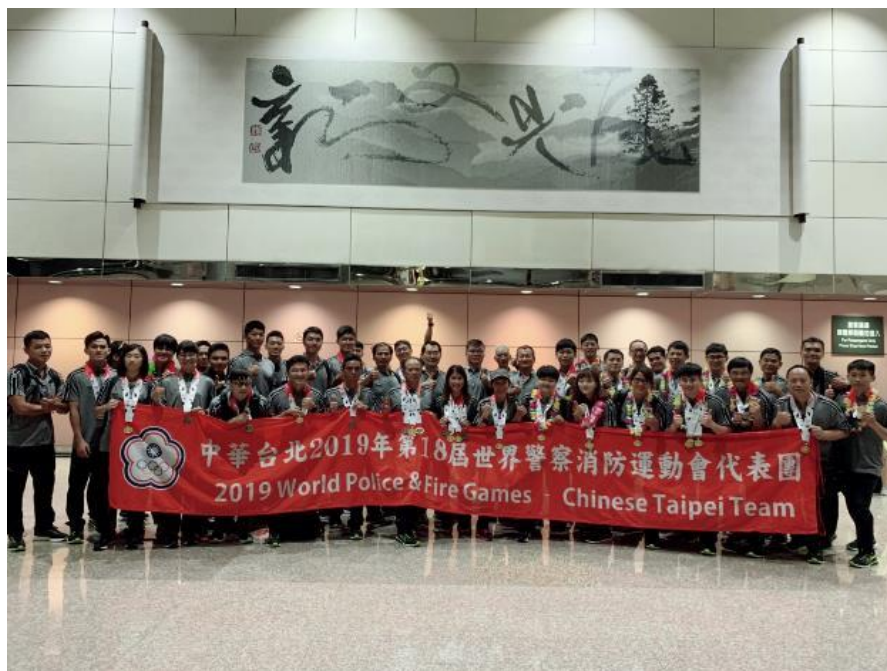
圖6 返國後選手大合照