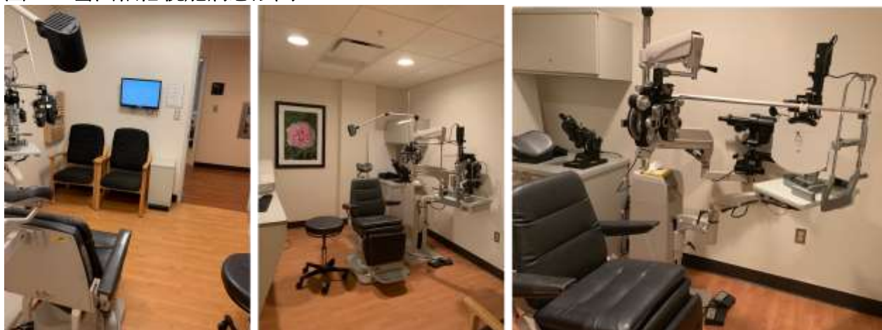
圖一、密西根低視能病患診間

在近視力的表示上，使用不論正常視力或低視能的患者，皆使用 M notation 來表示。本院在近視力的檢測上，仍使用 Landolt C 視力表，表示方式為 decimal 的表示。由於西方人體形較高，一般 ADD 為+2.5 距離 50cm。我國病患身型較嬌小，習慣使用 ADD+3.0 距離 33cm 做為近距離的使用。美國因為保險制度，有給付雙焦的老花眼鏡(bifocal)，也因此雙焦眼鏡的使用不比漸進多焦老花眼鏡來的少。另外在眼鏡處方的部份，在密西根單位只寫度數，不寫瞳距(pupillary distance)，一般瞳距的測量會受到眼鏡型態(單焦、雙焦、多焦)等的不同，會在眼鏡部選擇眼鏡製成做測量。測量時使用專門的瞳距測量儀器。