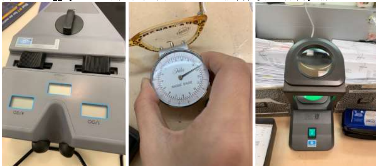
圖二、Kellogg eye center 眼鏡部的工具：測瞳距、測鏡片弧度、測鏡片多焦點

在驗光習慣上也差異很大，一般而言自覺式驗光為主。本院目前在病患配鏡時，會讓病患指出每一排的視力，單隻眼睛約需花費 10 分鐘，病患有時會因檢測過久造成視覺疲勞或是乾眼症發作。在密西眼的配鏡，總是以比較第一片或第二片比較清楚為原則，尋求最佳的度數。在每一片做比較時，不會讓病患看完整排的視力，也減少病患受檢的時間。另外一項差異，是本院只使用 clock dial 來確認散光是否均勻，缺乏使用 cross cylinder 來檢測散光的量及方向。建議購置 cross cylinder flip 及 trial lens 讓散光的檢測上更準確。