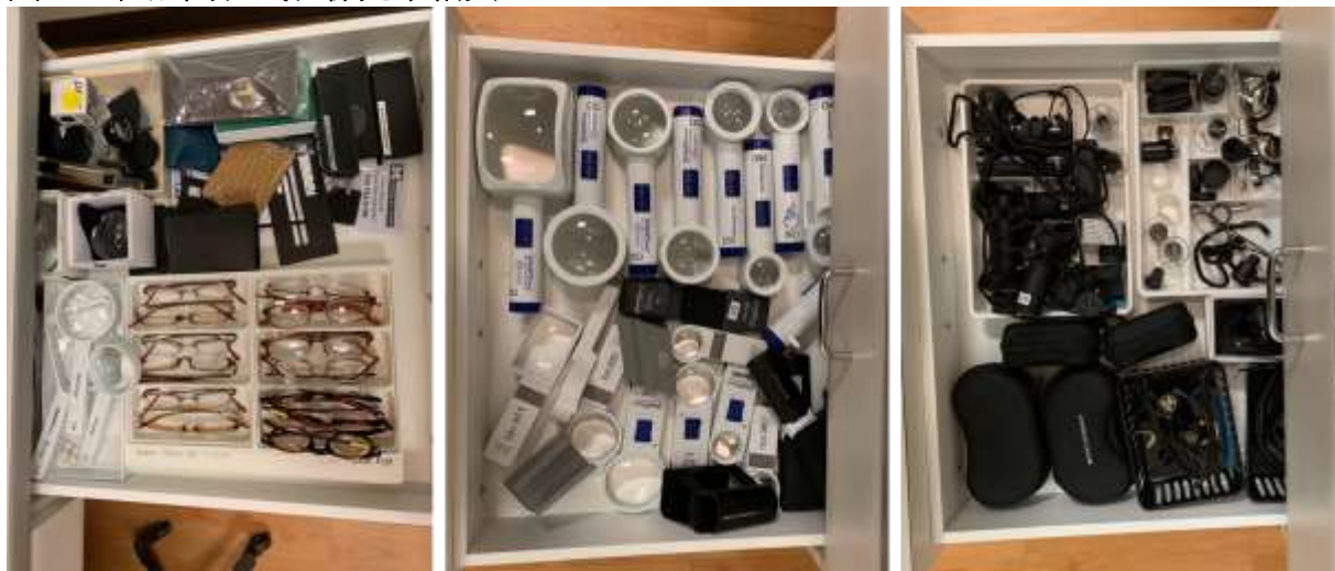
圖四、在診間各式各樣光學輔具

另外針對低視能的病患也會進行一些相關研究，在密西根的兩個月，有參與到對低視能病患進行 personal digital assistant 的調查、及年紀大於 60 歲低視能病患在 balance score 的評估等。除了在臨床及研究以外，有組成 low vision support group，每個月定期開會分享相關資源及心得。在美國對於低視能病患較沒有歧視，在社會資源也較充足，病患較不會因身上穿戴