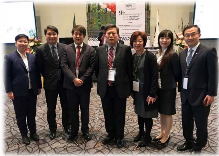
訪團與香港司法學院、大陸司法學院代表合影

事件，兩位代表心中自然有所想法，但基於其等之職業倫理，不應對此起運動具體陳述意見。其實依照我國的檢察官倫理規範、法官倫理規範，我國的司法官對於政治、社會事件亦應如此，然而有越來越多的司法官習慣在 FACEBOOK、INSTAGRAM 上「抒發情緒」，甚至大放厥詞，導致民眾對司法人員觀感不佳，甚至懷疑司法之專業及中立。