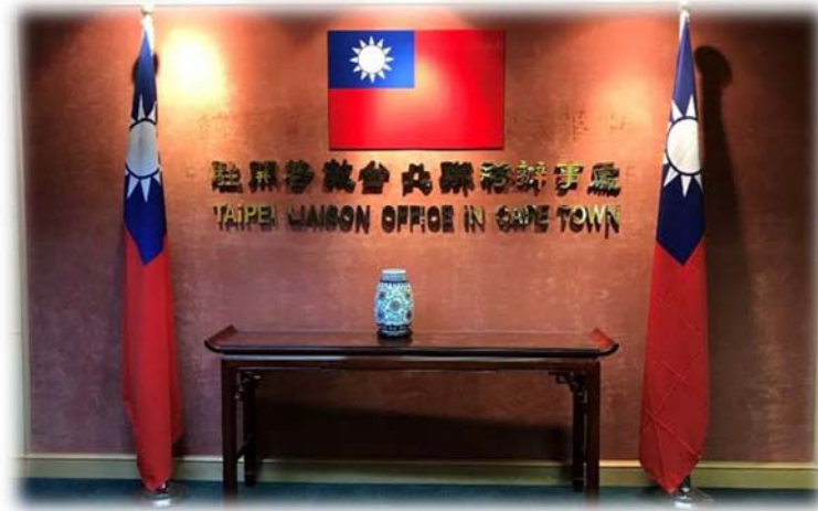
訪團拜會我國駐南非開普敦辦事處拜會

設的學校，直至廢除種族隔離制度後，黑人才擁有平等受教育的權利。林處長在訪團拜會期間向訪團說明，其於與南非官員交流時，不斷向南非之官員傳達教育之重要性，唯有平等的受教權，各種族的國民才能享受真正的平等。