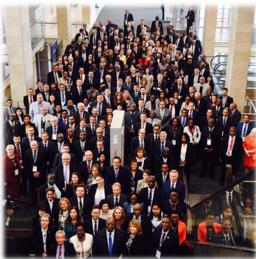
各會員代表大合照