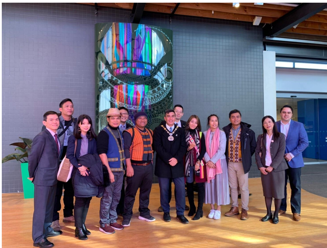
參訪 Pataka 美術暨博物館