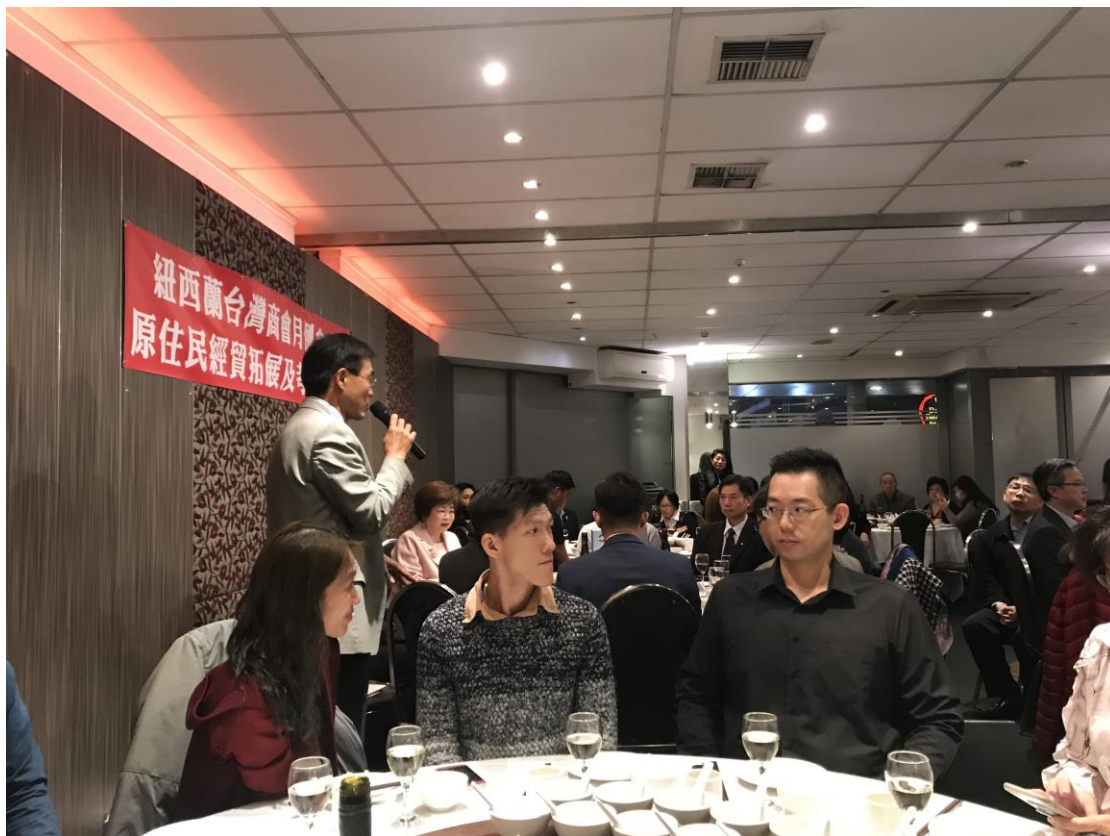
出席紐西蘭臺灣商會 8 月例會暨本團座談餐會