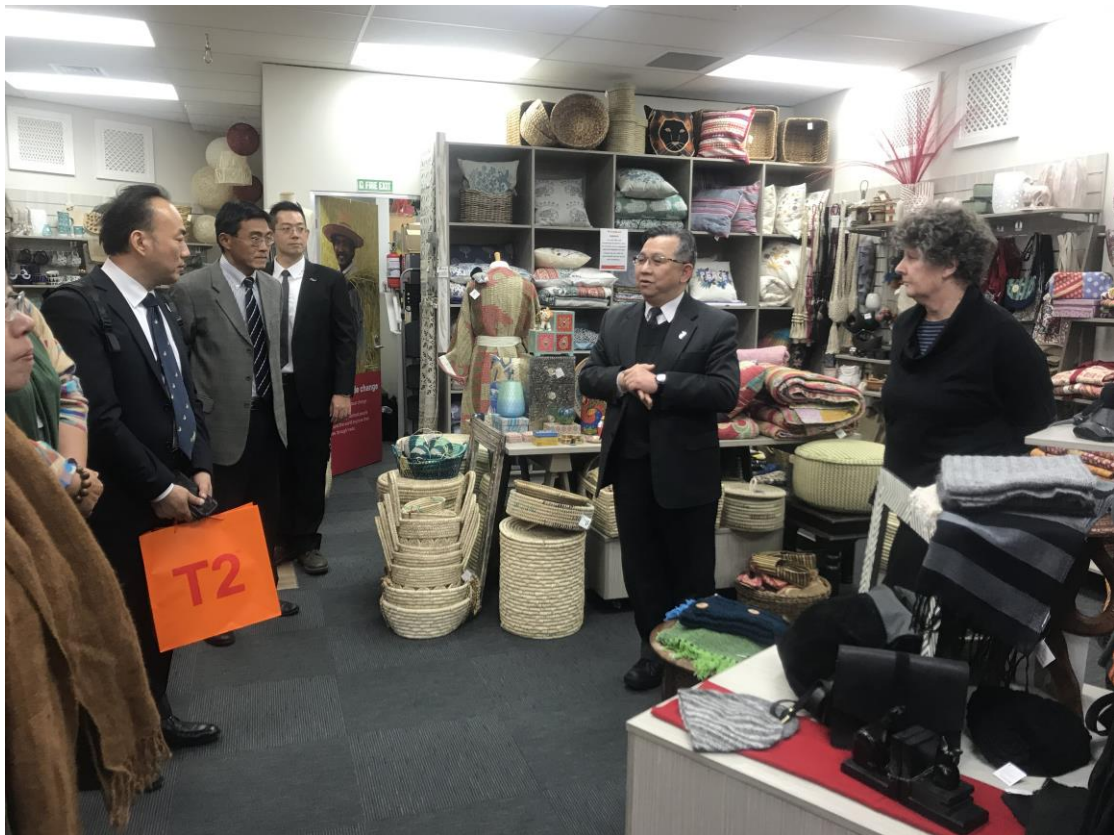
參訪 Trade Aid 商店