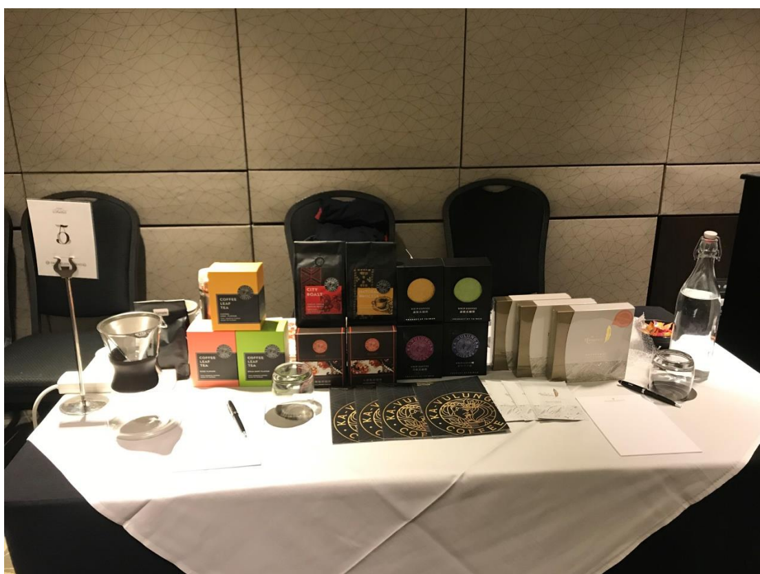
茂泰生技股份有限公司(咖啡、葉茶及咖啡面膜等產品)