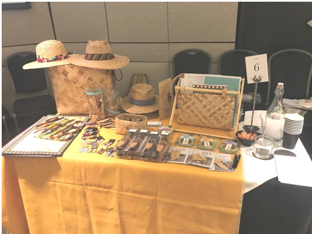
有限責任台東縣東海岸原住民社區合作社(月桃編織品)