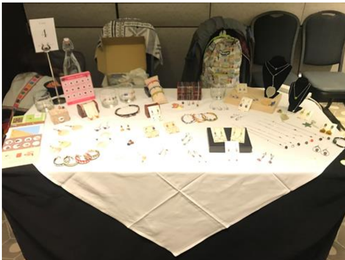
原味台南文創坊(琉璃珠、陶珠飾品)