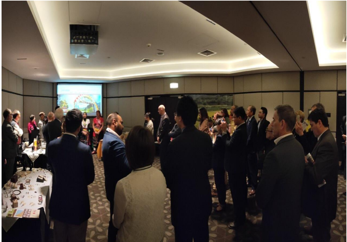
8月26日於紐西蘭威靈頓 Inter Continental 舉行貿易洽談會