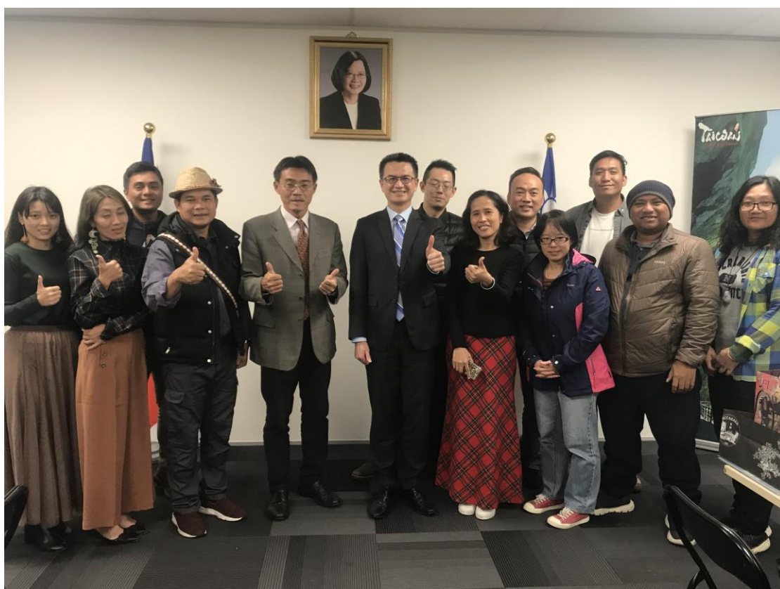
拜會駐奧克蘭辦事處