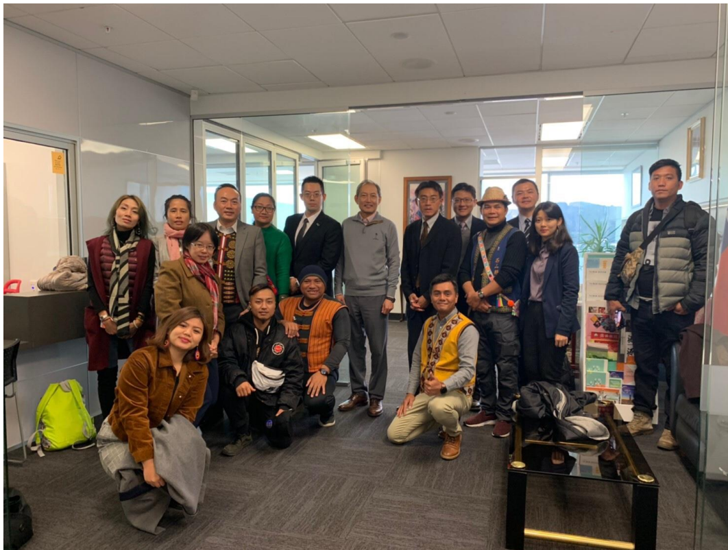
拜會駐紐西蘭代表處陳大使