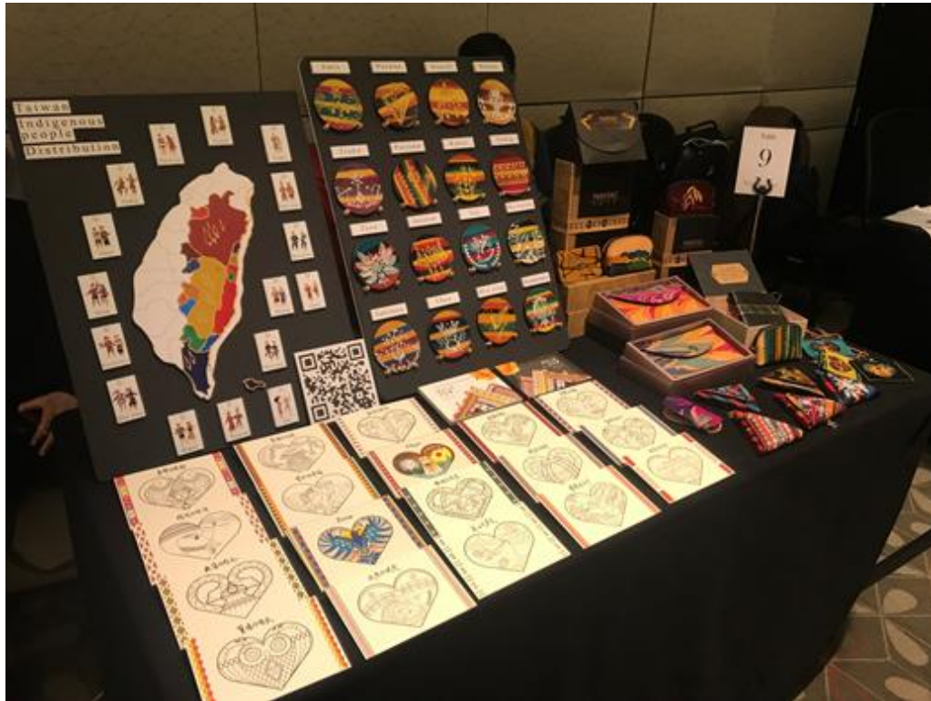
巫麥文化創意有限公司(皮革製品)