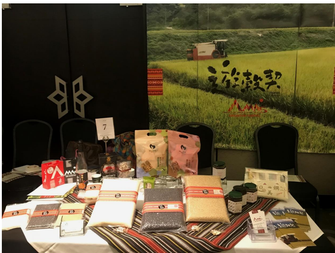
遊穀契開發有限公司(米製品及相關衍生產品)