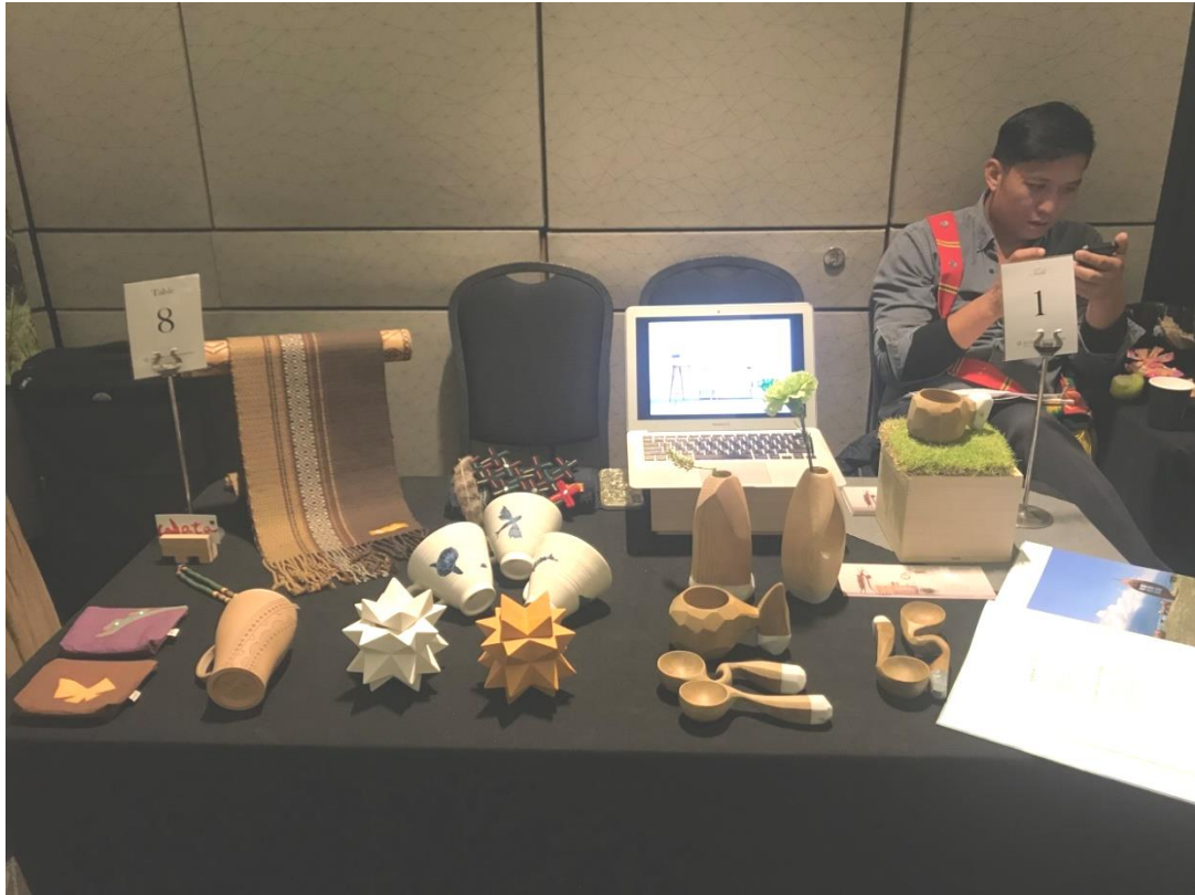
弟朋有限公司(木雕製品)、哇大創意整合有限公司(木製品、編織品等)