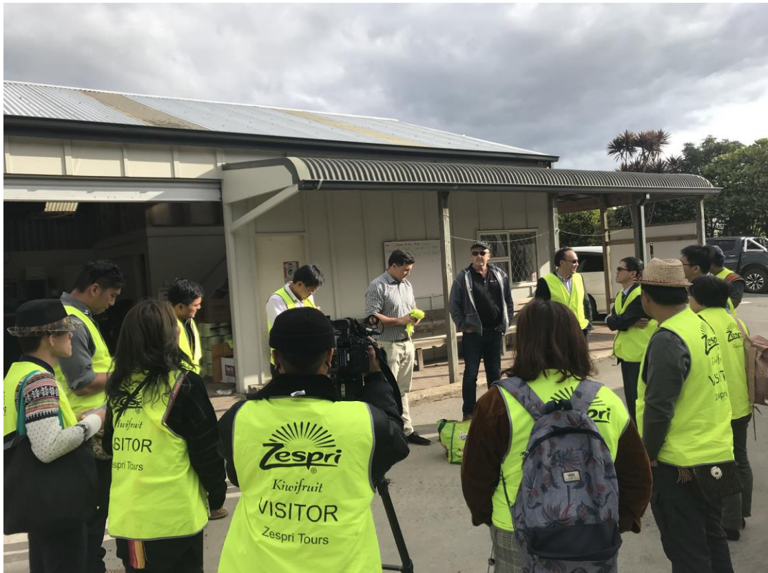
參訪毛利人經營之奇異果園