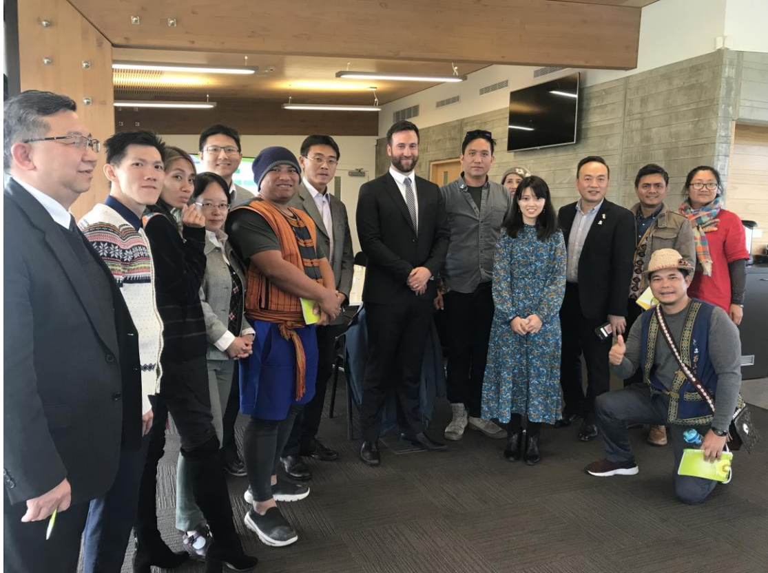
參訪 Zespri 奇異果公司