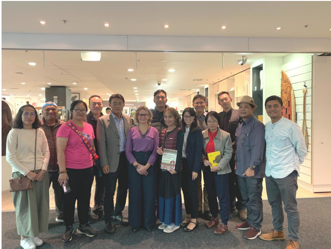
業者選送文創產品予 Te Papa 博物館於該館紀念品店陳列展示