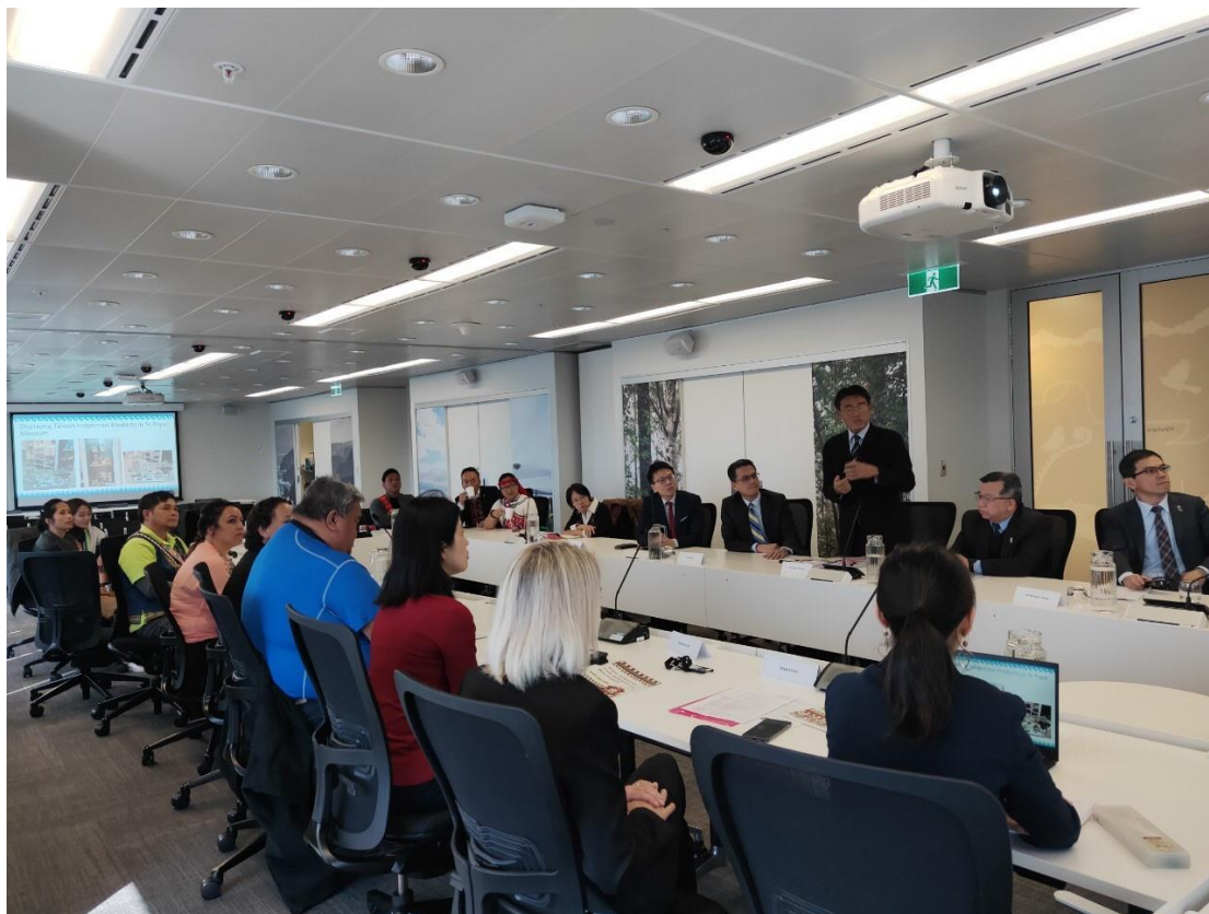
拜會奧克蘭市政府毛利發展局