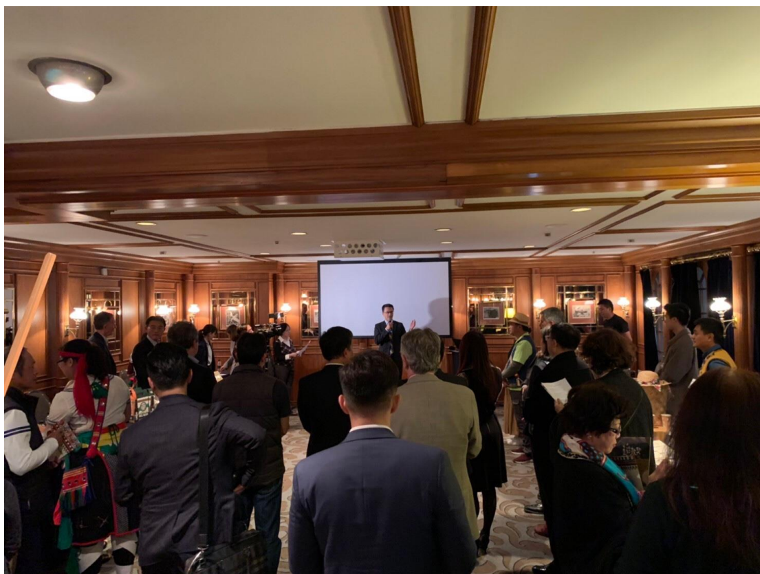
8月29日於奧克蘭 Cordis Hotel 舉行貿易洽談會