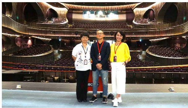
戲曲中心劇院大劇院舞台合影