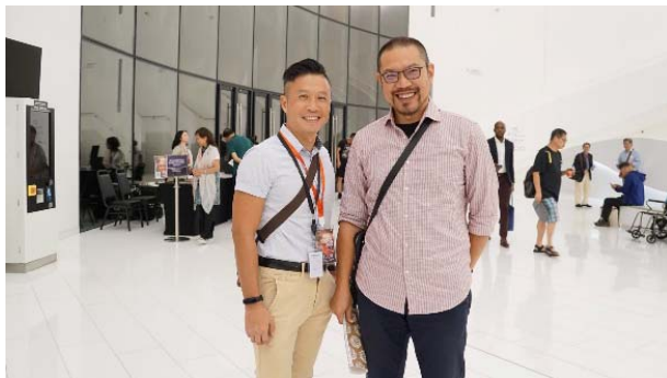
衛武營藝術總監簡文彬赴港觀賞演出