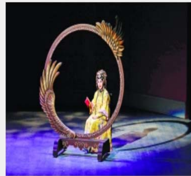
魏海敏演《孝莊與多爾袞》