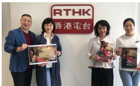
8/2 香港電台普通台與主持人合影