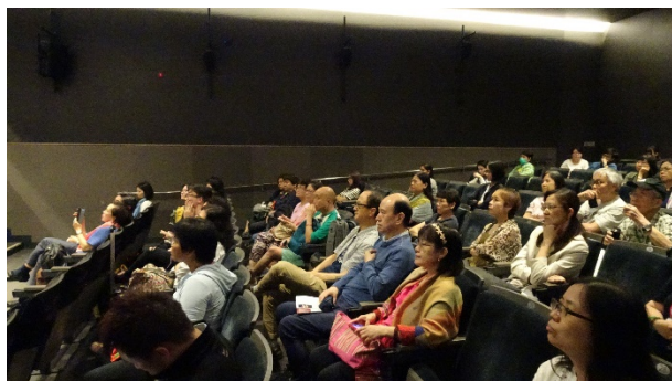
8/1 西九戲曲中心講座 9