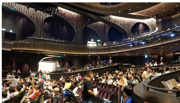
演前觀眾席進場人潮