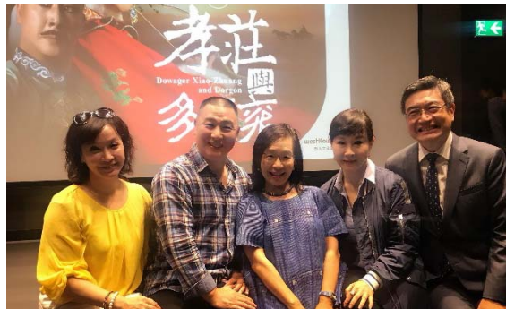
8/1 西九戲曲中心講座 10 (貴賓合影)