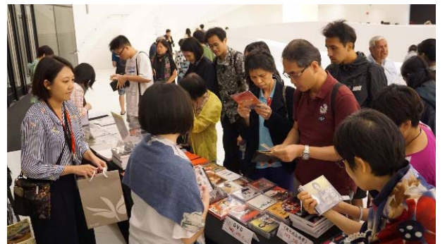
前台湧入的熱情觀眾