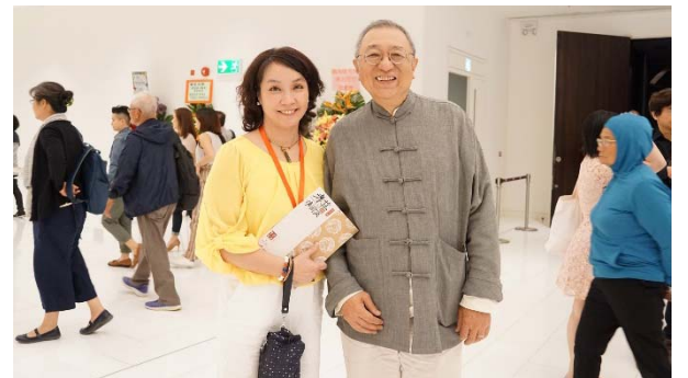
與支持國光學者鄭培凱教授合影