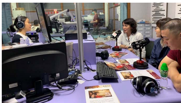
8/2 香港電台普通台專訪