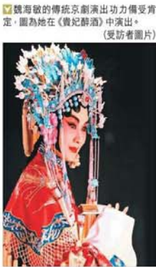
魏海敏小檔案 本名：魏敏 出生地點：台灣 曾獲獎項：台灣國家文藝獎、金曲獎最佳傳統音樂類評審獎、中國戲劇梅花獎、上海白玉蘭戲劇表演藝術主角獎