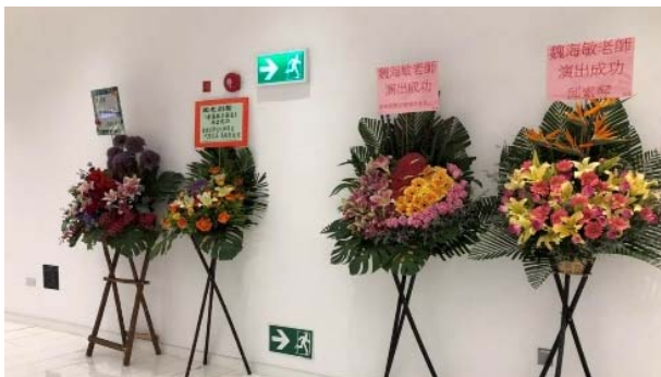
貴賓致贈鮮花祝賀演出成功