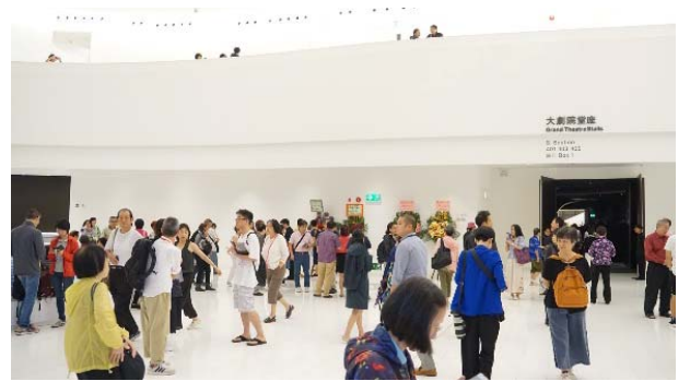
演前觀眾進場人潮