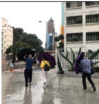
8/2 遇三號風球趕宣傳行程