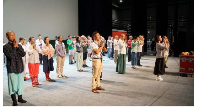
演出前祭台祈求演出順利