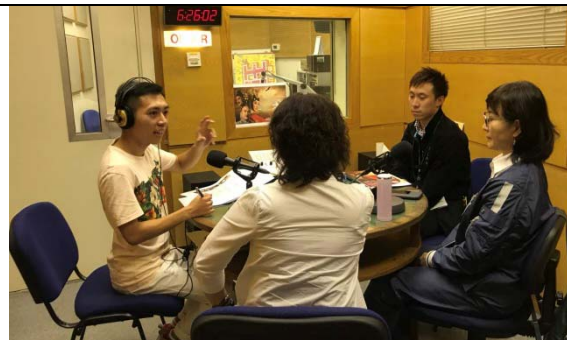
8/2 香港商業電台專訪