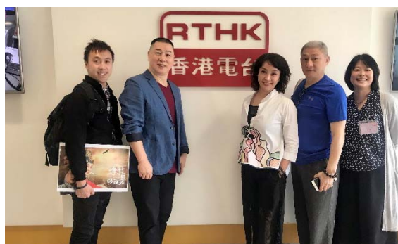
8/2 香港電台人員合影