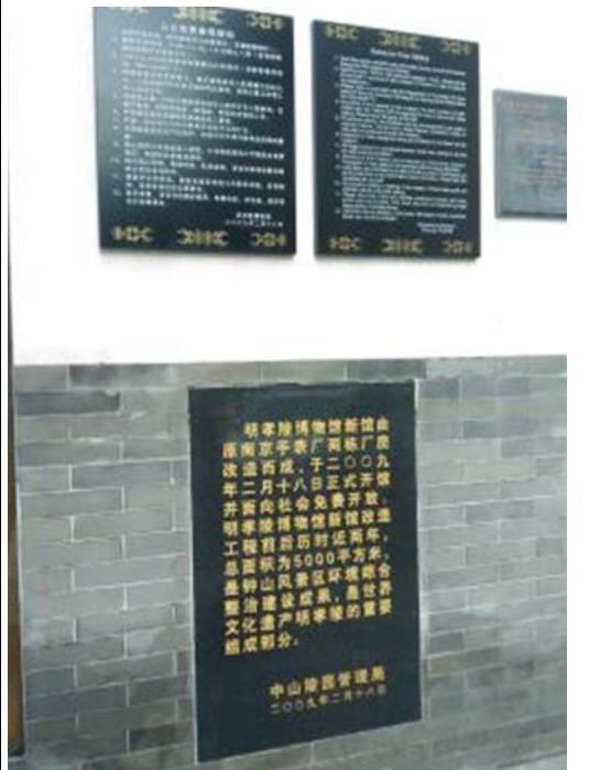
明孝陵博物館啟用