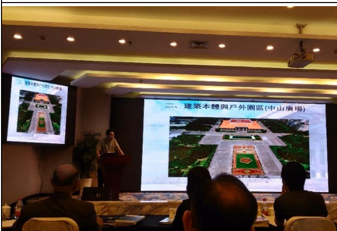
鄒研究員介紹本館建築及古蹟維護