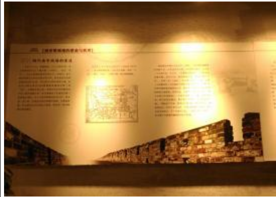
明孝陵博物館展示