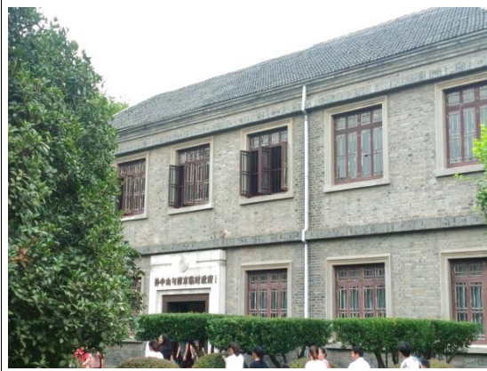
孫中山與南京臨時政府