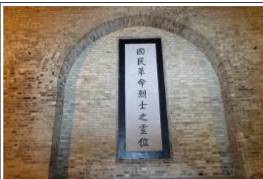
國民革命軍陣亡將士公墓的祭堂，命名為「正氣堂」