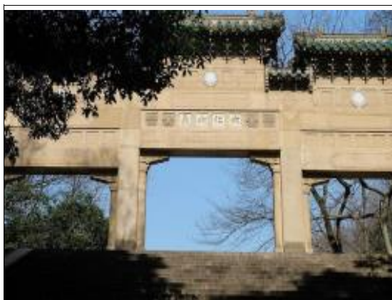
大門和牌坊大門和牌坊