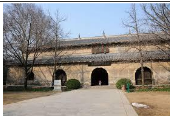
無梁殿位於靈谷寺一側