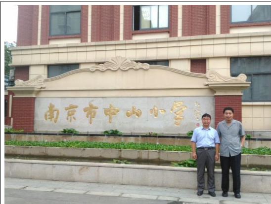
中山小學校長與鄒研究員求強