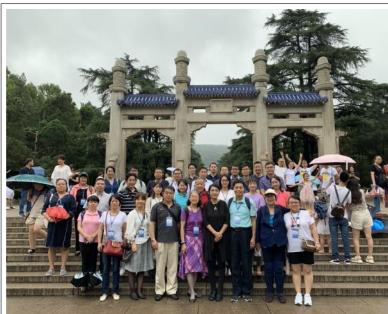
全體代表於中山陵牌樓前合影