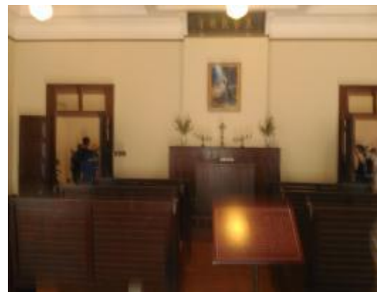
樓內專門設有禮拜堂--凱歌堂