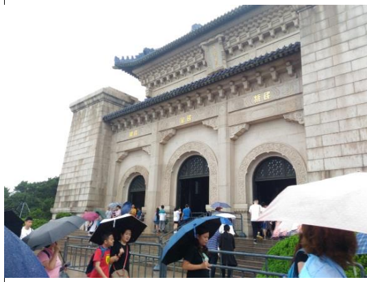
祭堂大門上方孫中山手書的天地正氣 四個大字以及門上的民族.民權.民生