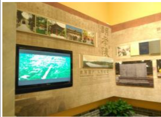
明孝陵博物館展示