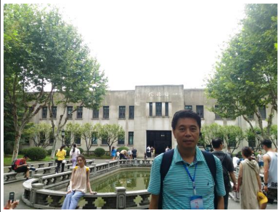
南京國民政府時期之行政院