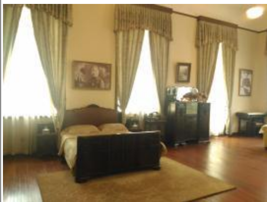
二樓東邊蔣介石、宋美齡夫婦的臥室