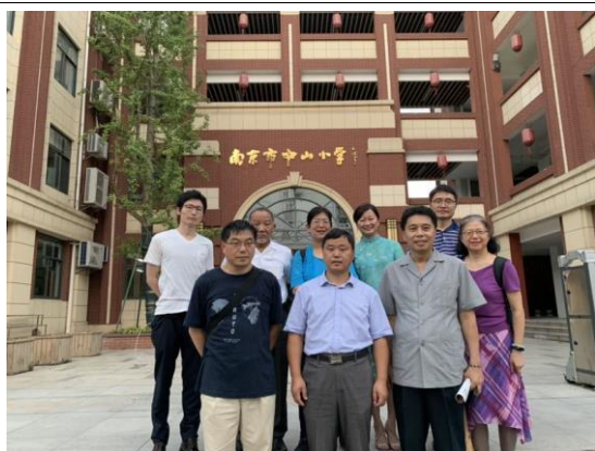
日本、馬來西亞、臺灣、南京代表 在中山小學前合影