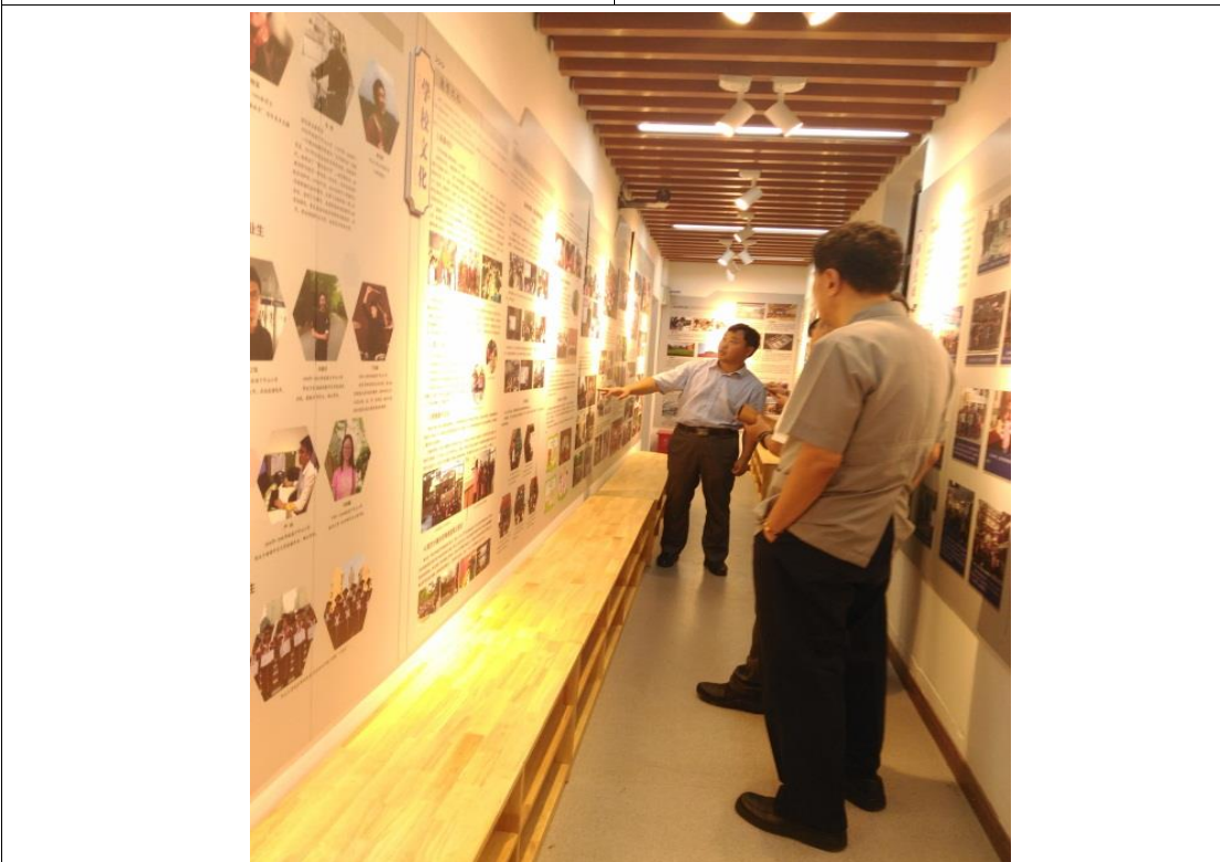
校長介紹南京市中山小學