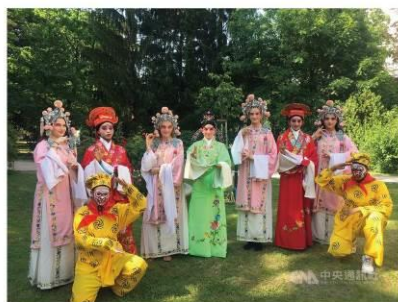
參與夏日戲曲體驗的維也納聖心中學學生，13日粉墨登場演出。(維也納提供)中央社記者林育立柏林傳真 108年6月17日

【中央社記者林育立柏林16日專電】維也納聖心中學日前舉辦夏日戲曲體驗營，邀請台灣豫劇團的老師教學，這是台灣第一次在奧地利的學校進行傳統戲曲課程計畫，由於成效良好未來可望擴充。