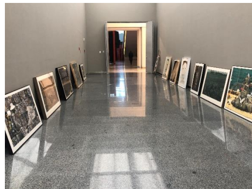
「第 13 屆全國美術作品展-版畫作品展」佈展情況