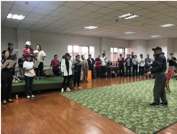
參觀川劇院排練情形

到訪首先參觀川劇院大劇場及排練情形，川劇院大劇場總面積約 5 千平方公尺，386 個座位，配備升降舞台、樂池、進口音響、燈光等。可供各類專業、業餘團體的中小型演出。排練中的《白蛇傳》為川劇代表劇目之一，將白蛇傳這個傳統民間故事，以川劇特有的直接情感、精彩武打動作呈現。川劇院表演團隊曾於 108 年 4 月參與國立傳統藝術中心 2019 臺灣戲曲藝術節，於臺灣戲曲中心大表演廳演出《白蛇傳》。