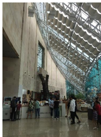
重慶三峽博物館一樓大廳