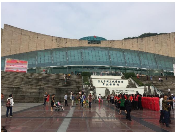
重慶三峽博物館外觀

場已成為市民休憩重要場所。博物館一樓大廳挑高，採光極佳，館方製作了 10 項人氣藏品尋寶圖，觀眾可按圖索驥，於展場中尋找藏品位置，增加觀展樂趣。