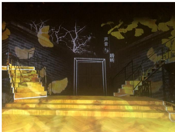
觀賞朗誦劇《聲音·聆聽》