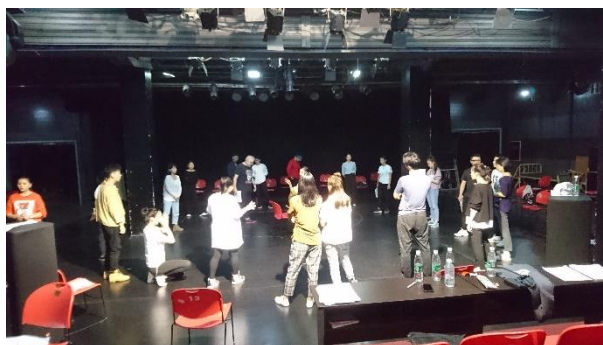
參觀《哈姆雷特》排練情形