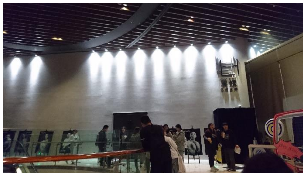
朗誦劇演出地點實驗性劇場「黑螺藝術空間」