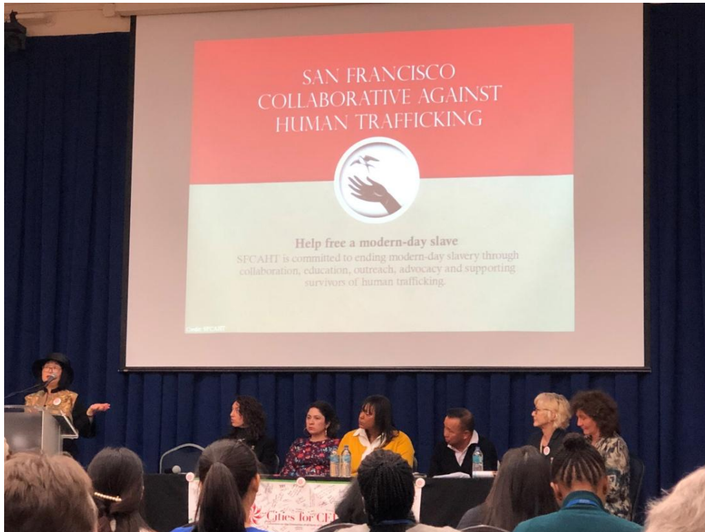
3 月 15 日職業母親、家庭暴力、人口販運倖存者及在 STEM 中的女孩的公平問題