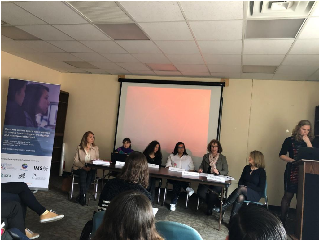
3月21日網路空間是否允許女性在媒體中，挑戰對女性的刻版印象和錯誤描述