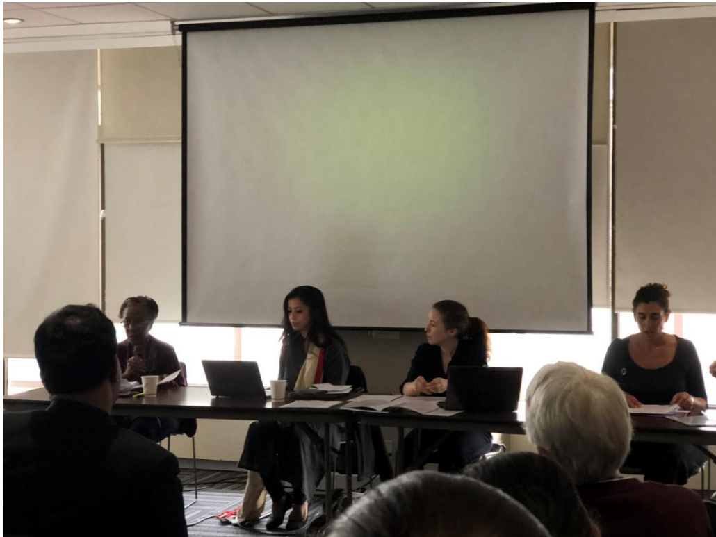
3 月 14 日總體經濟政策：為婦女權利的公共服務