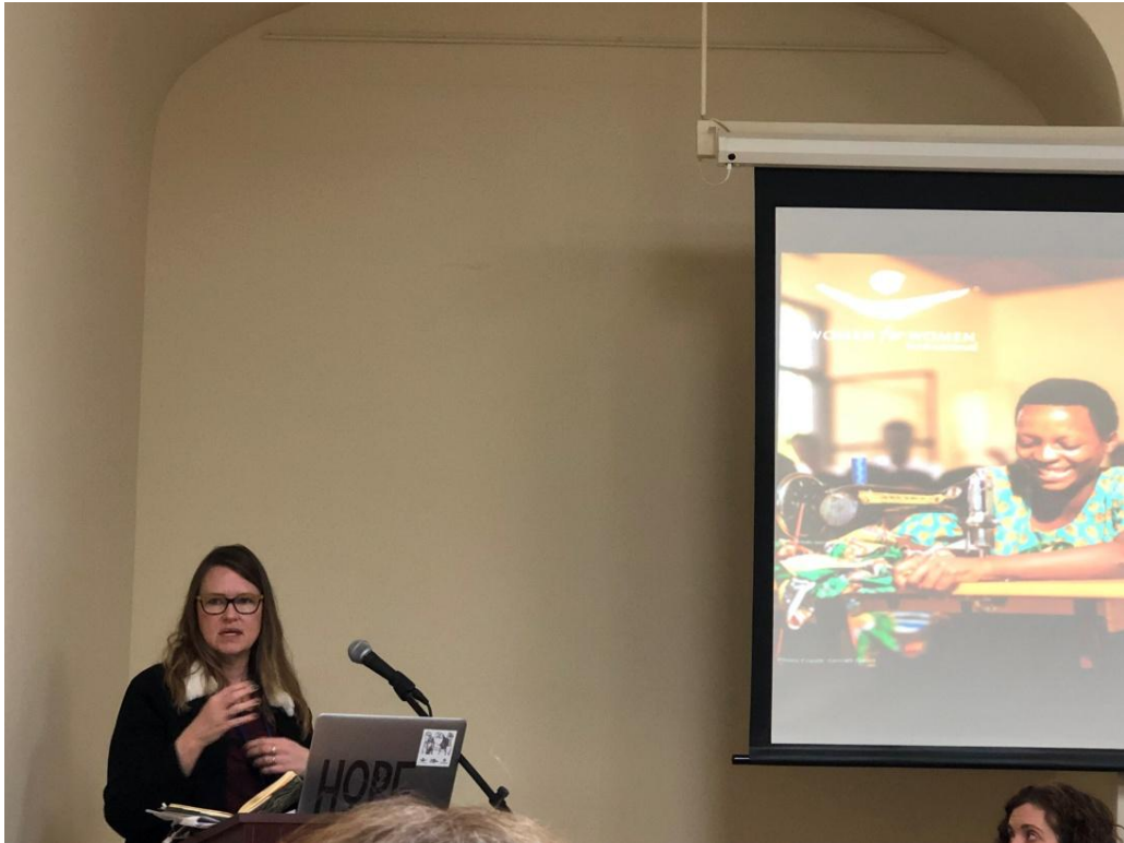
3 月 14 日不落下任何 1 個人！移民婦女獲得社會保障