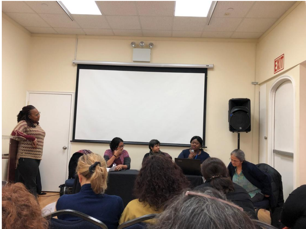
3 月 12 日推出全球女權主義公平貿易聯盟