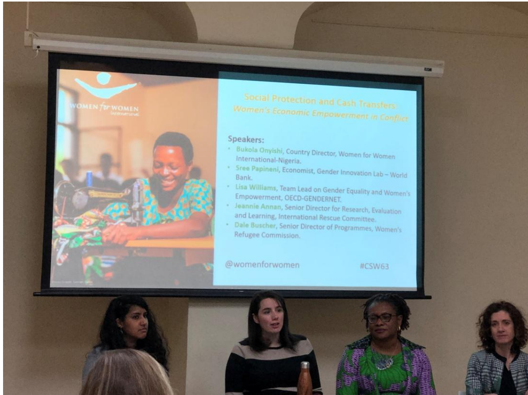
3 月 13 日社會保障與現金移轉：婦女經濟賦權與衝突