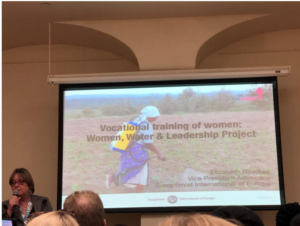
3 月 11 日婦女職業訓練：卓越的投資