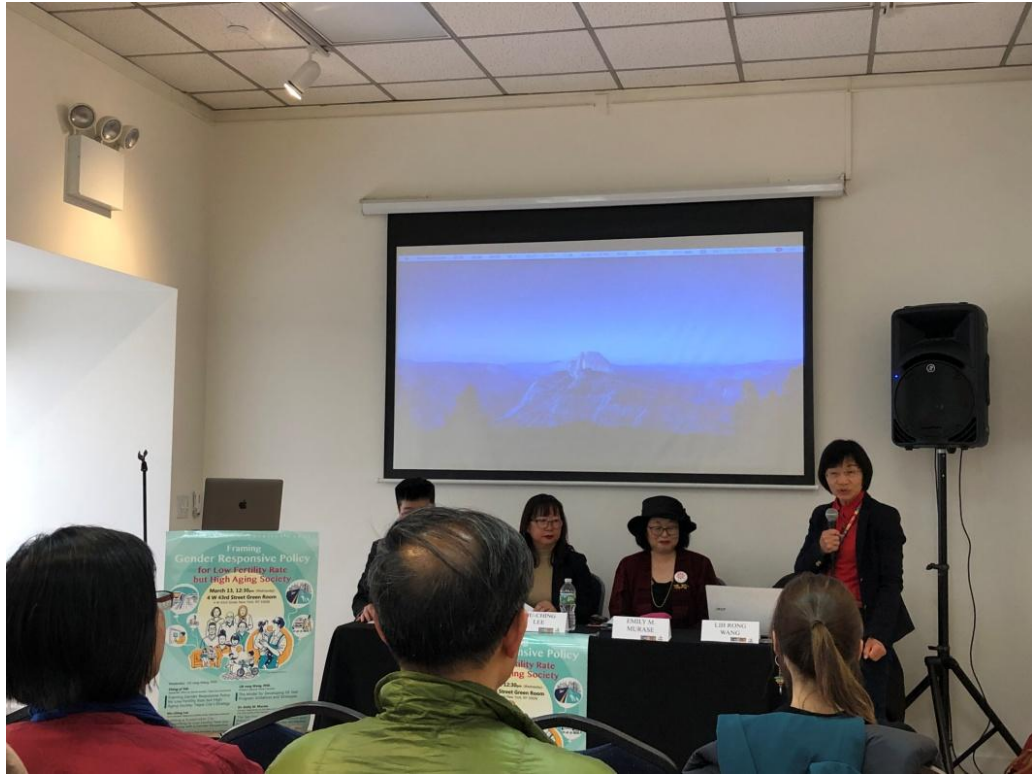
3 月 13 日因應人口老化社會的生育率政策