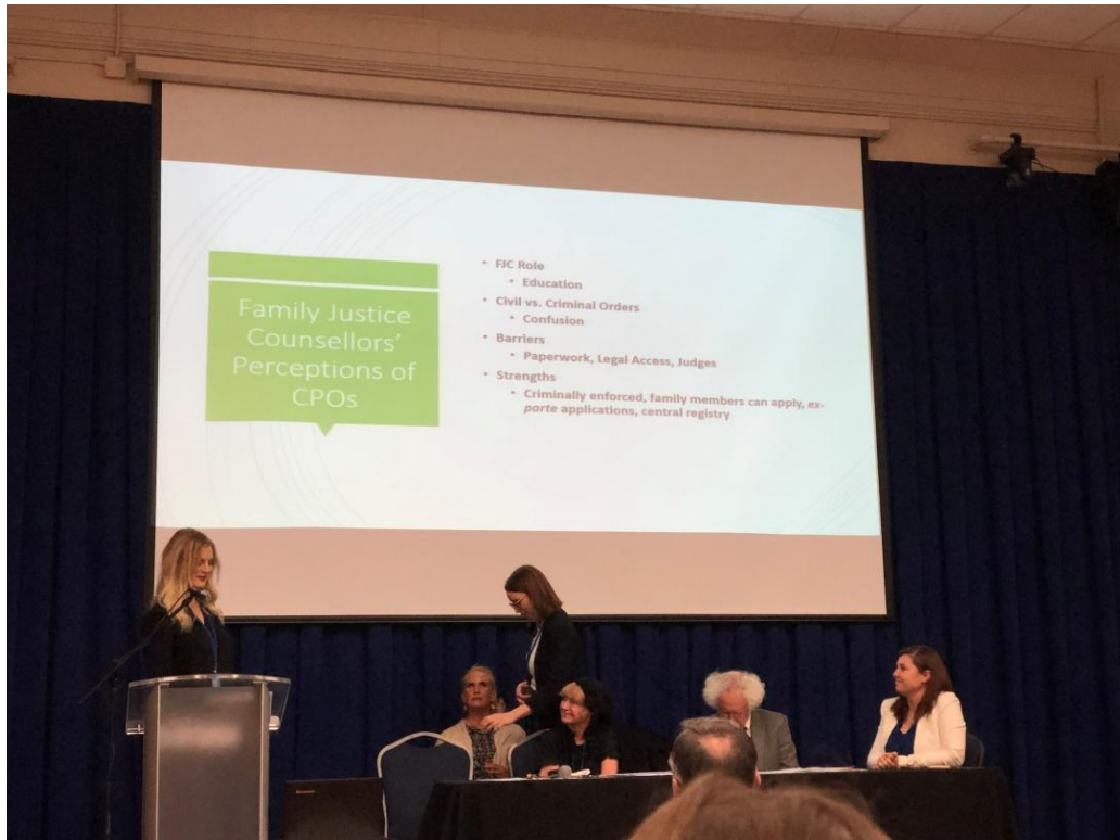
3 月 13 日執法對婦女與社會保障服務的作用