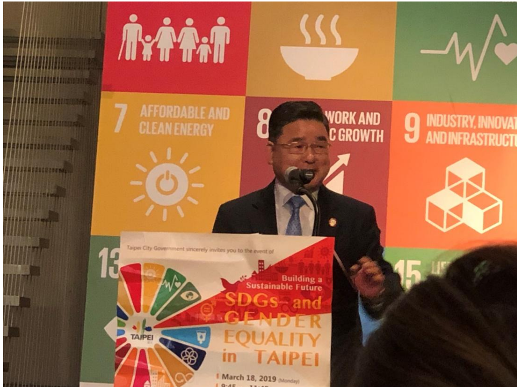
3 月 18 日永續發展目標與性別平等在臺北