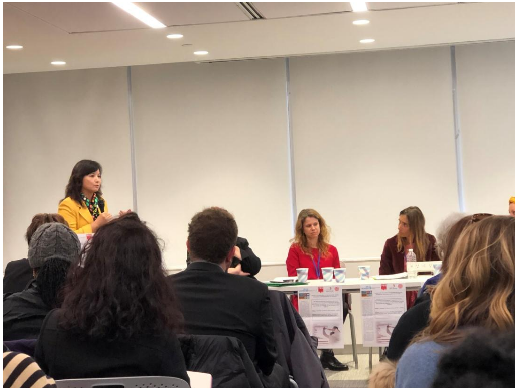
3 月 11 日新西蘭和太平洋地區婦女的 STEM 和基礎設施職業