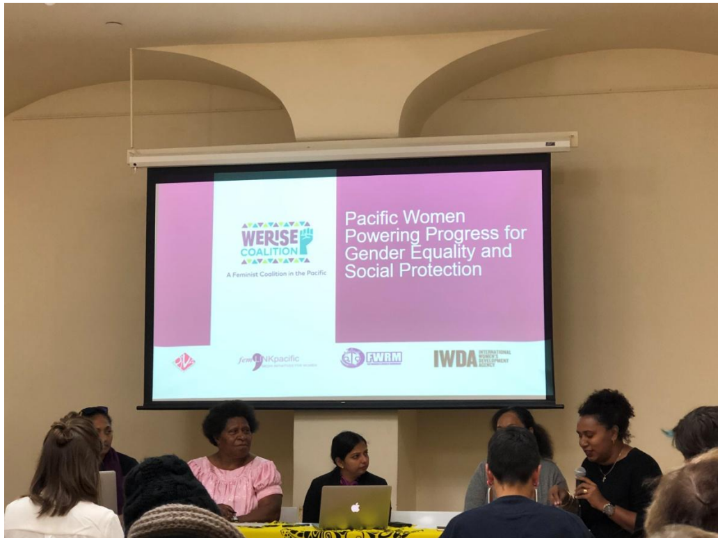
3 月 11 日太平洋地區婦女為兩性平等與社會保障努力之進展