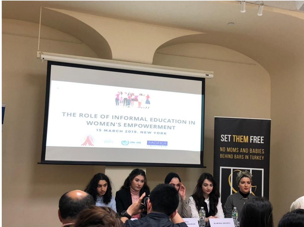
3 月 15 日非正規教育在婦女賦權中扮演的角色