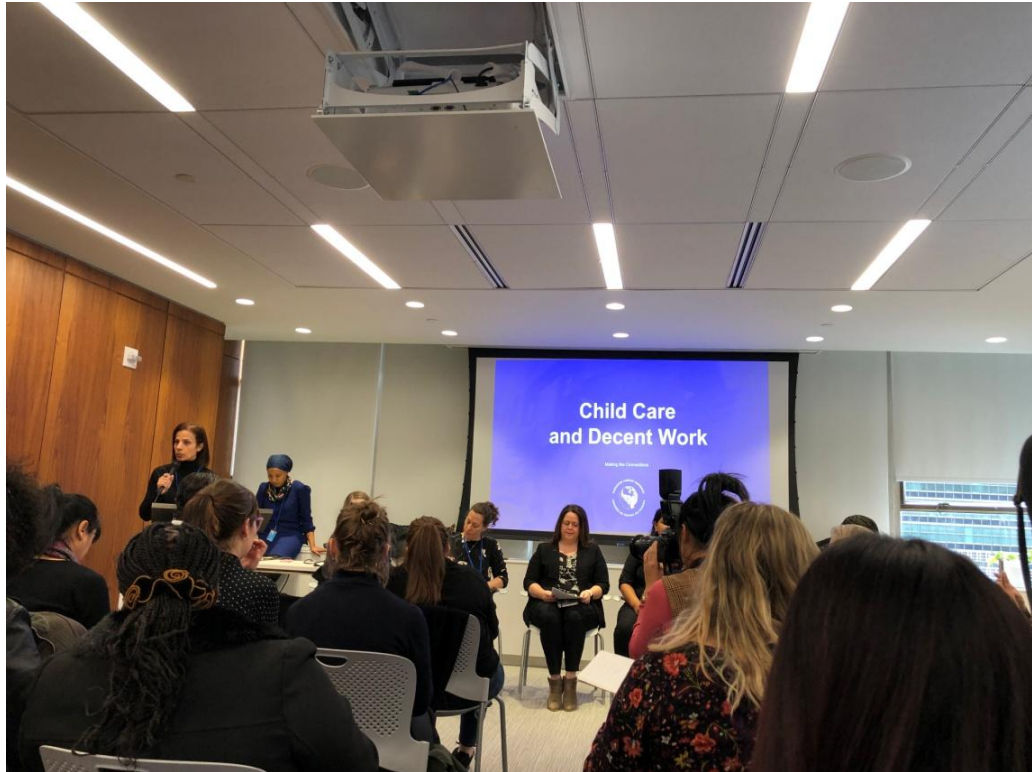
3 月 12 日兒童照顧與尊嚴工作