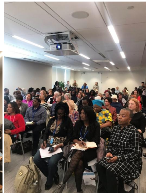
3 月 14 日經濟安全、婦女與工作：促進公平的解決方案