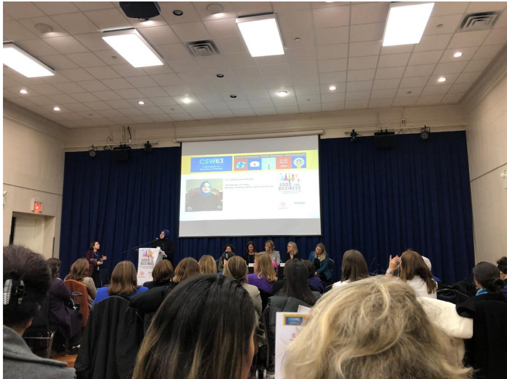
3 月 11 日良好的事業：透過企業家精神賦予女性經濟權利