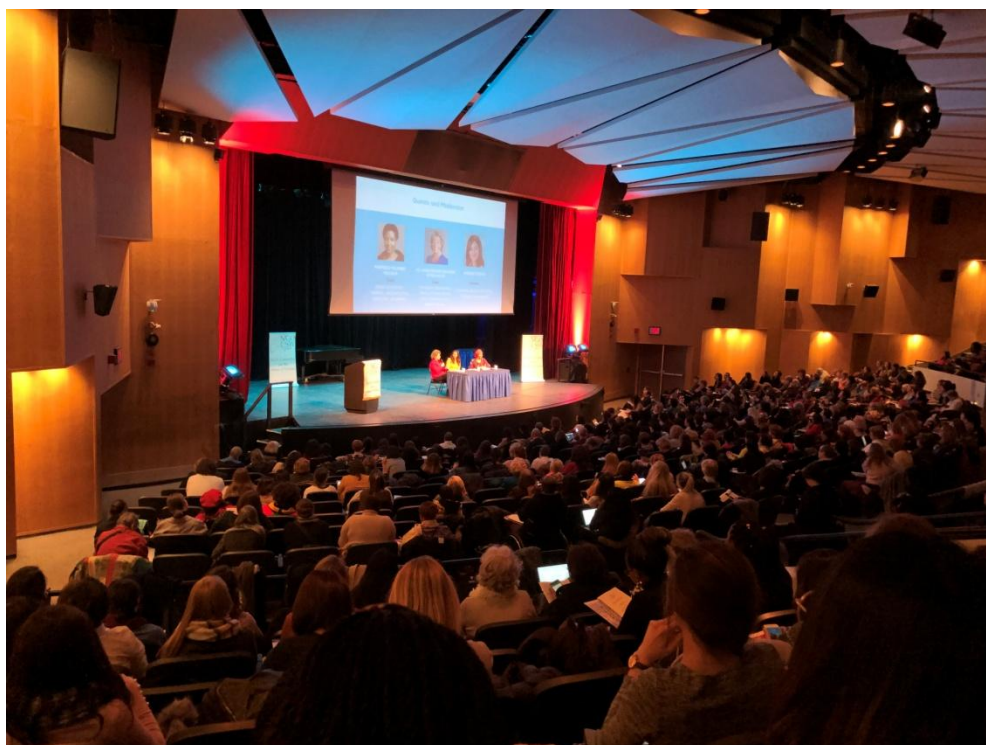
3 月 10 日會前諮詢會