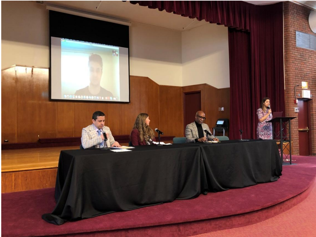
3 月 19 日為婦女經濟賦權的企業家計畫