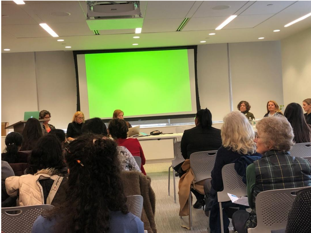
3月21日全球護理的執行、教育、諮詢及夥伴關係的創新範例