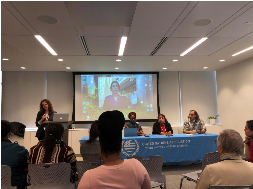
3 月 20 日以 VNR 進程實現聯合國永續發展目標中的性別平等