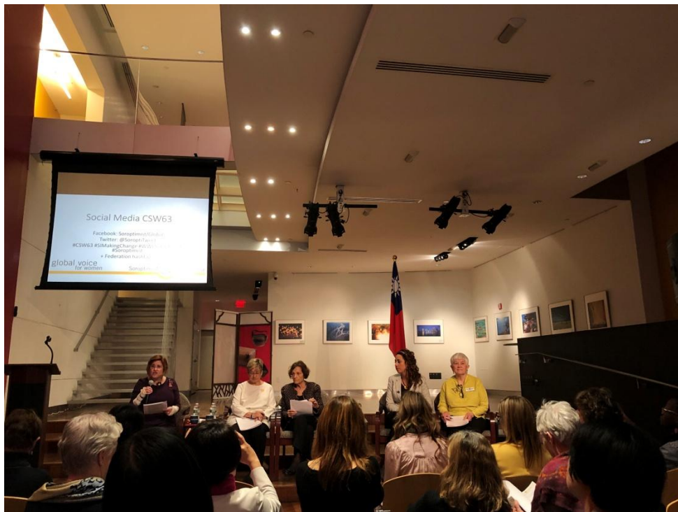
3 月 10 日 CSW63 方針說明與訓練 - 社群媒體