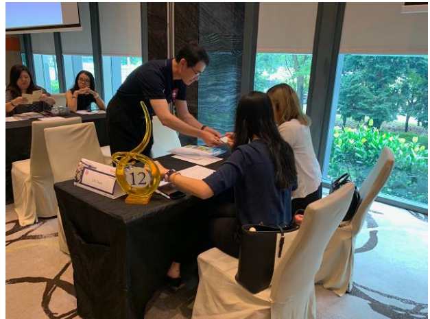
清境農場同仁與新加坡業者配對洽談情形