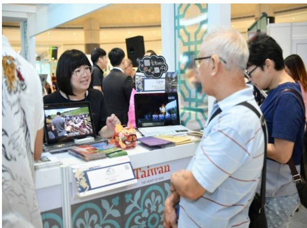
本會人員向新加坡民眾介紹會屬農場