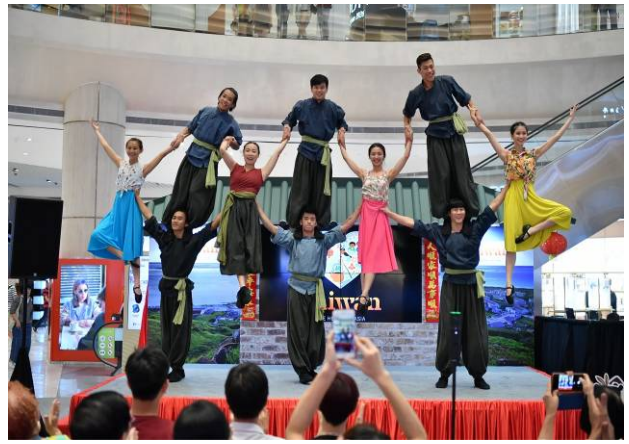
福爾摩沙馬戲團演出精湛