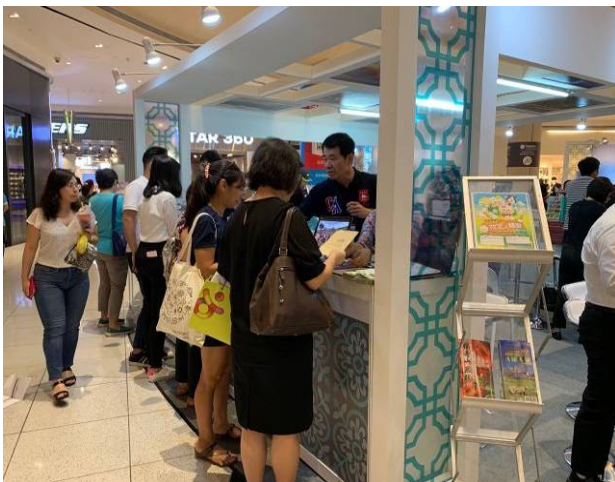
民眾踴躍臨近本會展攤