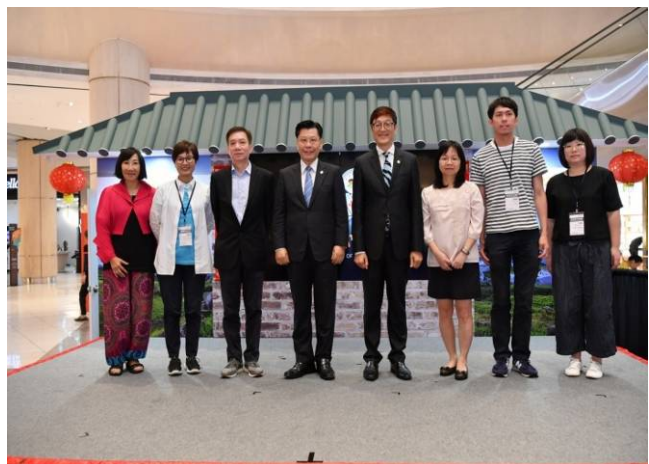
與觀光局新加坡辦事處林主任偕新加坡代表梁國新大使合影