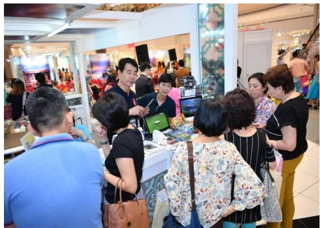
農場參展人員向新加坡民眾介紹清境農場