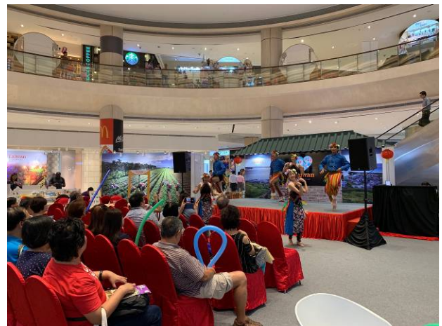
舞台表演與民眾互動熱烈