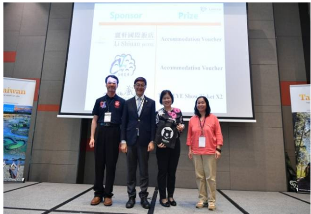
新加坡辦事處主任頒抽中農場住宿券獎同業