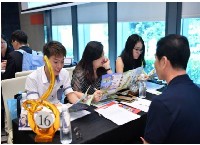
清境農場同仁與新加坡業者配對洽談情形