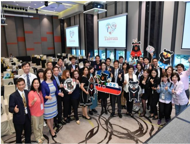
參展單位與觀光局新加坡辦事處主任合影