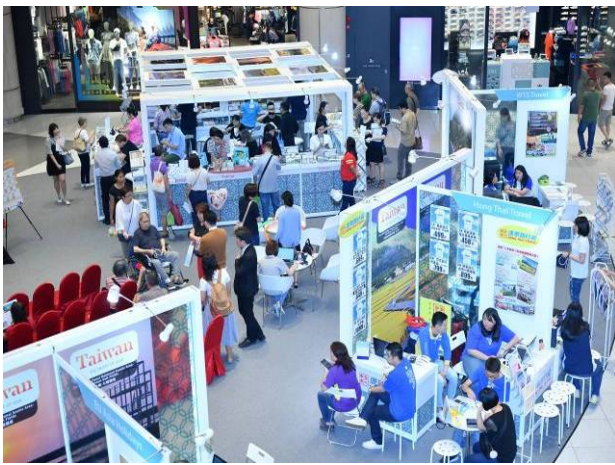
臺灣產品展銷會場現況