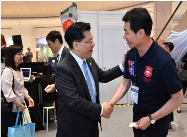
邀請駐新加坡代表梁國新大使來農場旅遊