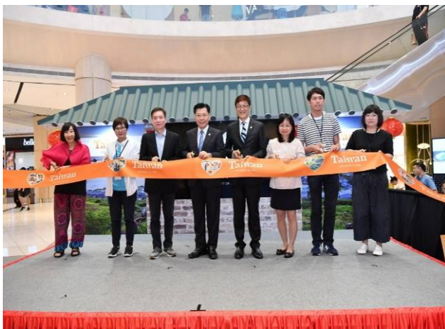
臺灣旅遊產品展銷會開幕剪綵