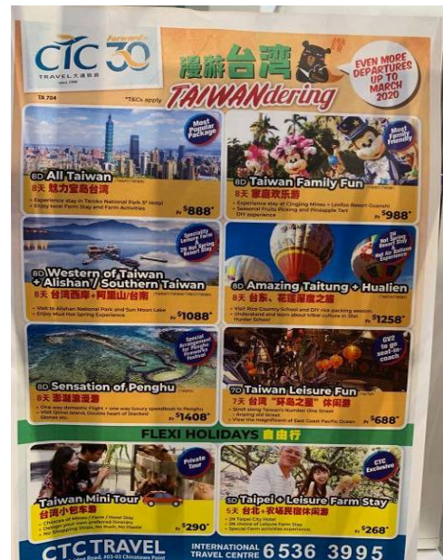
當地旅行社銷售臺灣產品情況