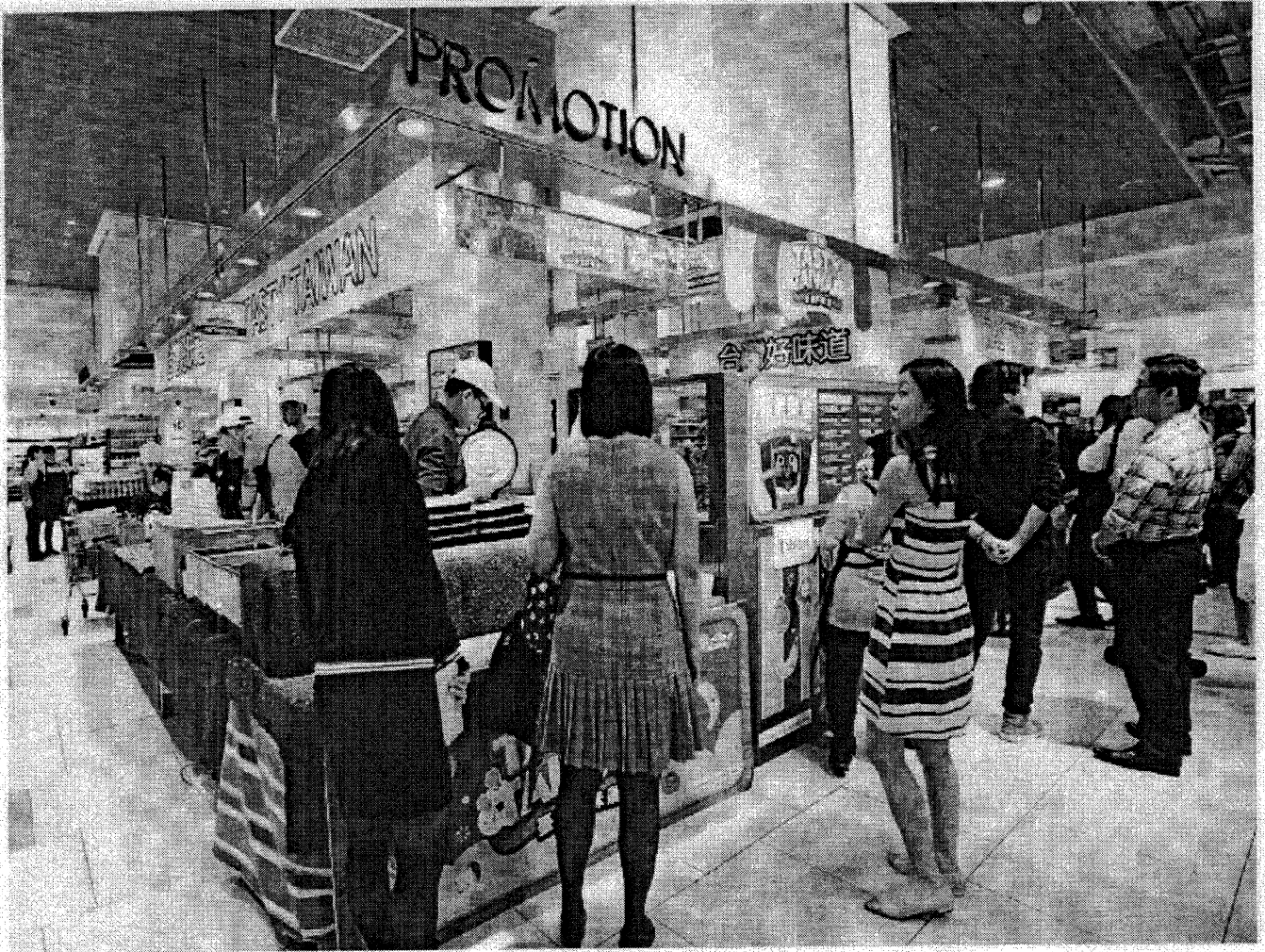
台湾食品展也备有热食推位，让民众可以享用道地的台湾美食。