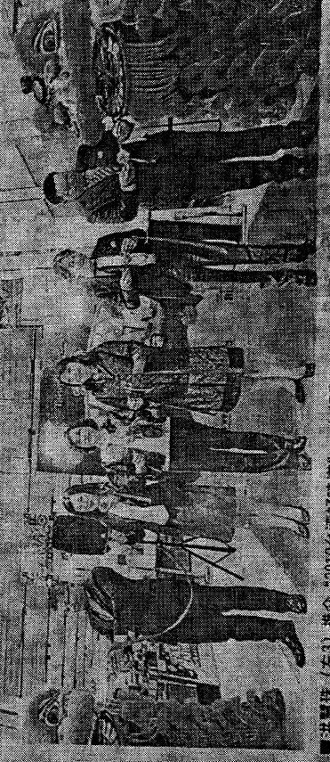
洪慧珠（左3）推介“2019台湾好味道”。左起为何国钦、唐淑华、大山洋行和唐淑华。

【吉隆坡28日讯】台湾行政院农业委员会副主委洪慧珠日前在吉隆坡出席“2019 台湾农业展”活动时接受媒体采访。她指出，台湾通过严格的食品安全法，因此生产了高品质的农产品，在追求成本、品质和食品安全之间取得了平衡。 洪慧珠表示，台湾通过严格的食品安全法，因此生产了高品质的农产品，在追求成本、品质和食品安全之间取得了平衡。她指出，台湾通过严格的食品安全法，因此生产了高品质的农产品，在追求成本、品质和食品安全之间取得了平衡。