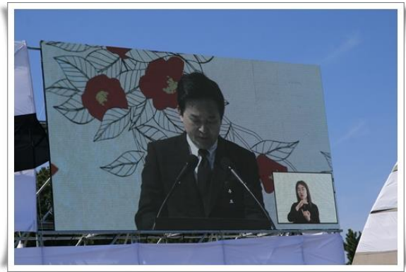
濟州道知事元喜龍致詞

濟州道知事元喜龍代表地方政府致詞時表示，有一位少女寫了一首詩，這是代替父親寫給祖母的，她的祖母因為被抓至酒精工廠監禁，後跟其他濟州島民一樣，被丟棄於大海中，溺水身亡。祖母的家因被政府放火焚燒而消失了，父親則是因為參戰而失去了一隻眼睛，他以全身承受了韓國現代史的暴風。每到 4 月 3 日，父親讀著女兒的詩，便止不住眼淚。那位女兒今日也已變成了母親，而那個星光耀眼的父親故鄉，那個消逝的村落，就讓它存在於詩句裡。