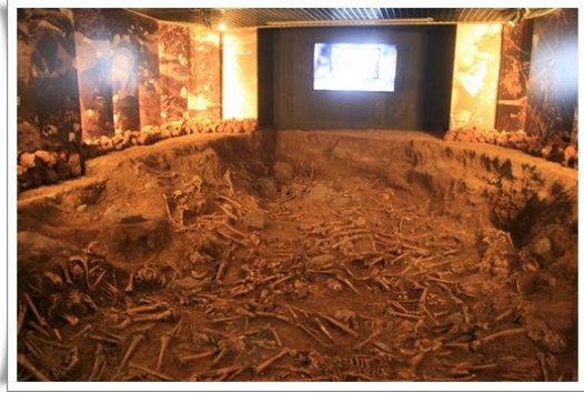
至「奉安館」悼念死難者，並觀看展示