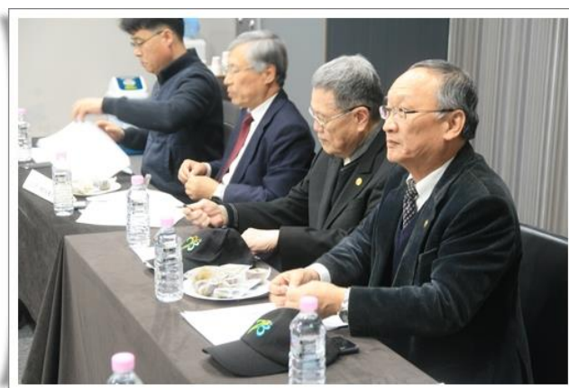
「東亞民主和平人權網絡」聯席會議

基於與濟州 4.3 和平財團所簽署的合作備忘錄，本會於今年受邀前往韓國濟州島參與「東亞民主和平人權網絡」聯席會議，與民主化運動紀念事業會、5.18 紀念財團、釜山民主化運動紀念事業會、釜馬民主抗爭紀念財團、老斤里國際和平財團、濟州 4.3 和平財團等韓國人權團體共同商討未來合作事宜。