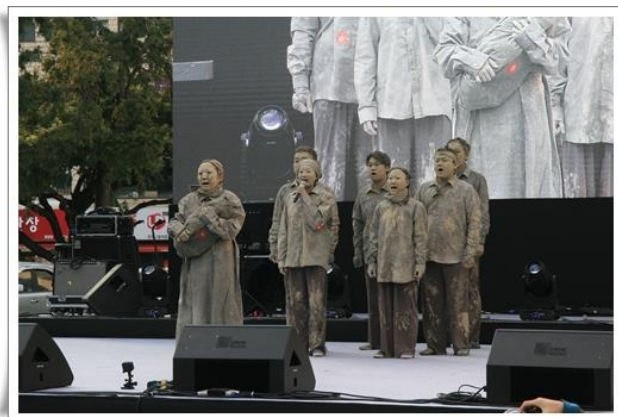
濟州 4·3 前夜祭

眾的熱情，舞臺上的人們粉墨登場，重新演繹濟州 4·3 當時逃難島民的情景，用歌聲與舞蹈喚起民眾對濟州 4·3 歷史的重視。