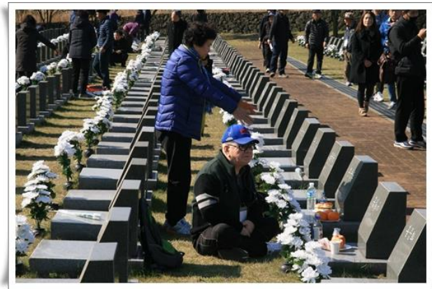
「失蹤受難者石碑區」

失蹤者多是於濟州 4·3 時被捕，並遭關押於韓國各地刑務所，卻一直未能回到故鄉之人。他們會成失蹤者的主因是因 1950 年 6 月 25 日韓戰爆發，戰爭一開始北韓勢如破竹，讓首爾一度淪陷，而韓國政府為避免這些受關押之人與北韓軍結盟，於是將他們一一槍殺，並隨意埋葬，結果就造成他們的家屬找不回親人的遺體，甚至連照片都未能留存下來。為使失蹤者家屬能有追思親人的場域，韓國政府於濟州 4·3 和平公園內設置了「失蹤受難者石碑區」，讓遺族們得以至此來追思先人。截至 2018 年 8 月，計有 3,896 座石碑，包含濟州地區 2,015 座、京仁地區 552 座、嶺南地區 446 座、湖南地區 393 座、大田地區 270 座與「事先拘禁」者 220 座（依據韓國全國各地收容所暨刑務所所在地進行區分）。