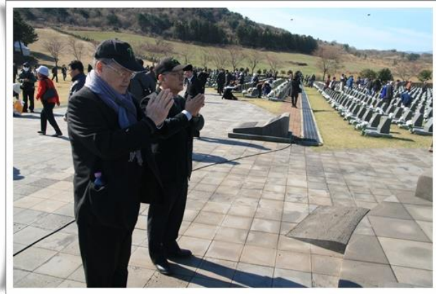
「失蹤受難者石碑區」致哀悼之意

失蹤者多是於濟州 4·3 時被捕，並遭關押於韓國各地刑務所，卻一直未能回到故鄉之人。他們會成失蹤者的主因是因 1950 年 6 月 25 日韓戰爆發，戰爭一開始北韓勢如破竹，讓首爾一度淪陷，而韓國政府為避免這些受關押之人與北韓軍結盟，於是將他們一一槍殺，並隨意埋葬，結果就造成他們的家屬找不回親人的遺體，甚至連照片都未能留存下來。為使失蹤者家屬能有追思親人的場域，韓國政府於濟州 4·3 和平公園內設置了「失蹤受難者石碑區」，讓遺族們得以至此來追思先人。截至 2018 年 8 月，計有 3,896 座石碑，包含濟州地區 2,015 座、京仁地區 552 座、嶺南地區 446 座、湖南地區 393 座、大田地區 270 座與「事先拘禁」者 220 座（依據韓國全國各地收容所暨刑務所所在地進行區分）。