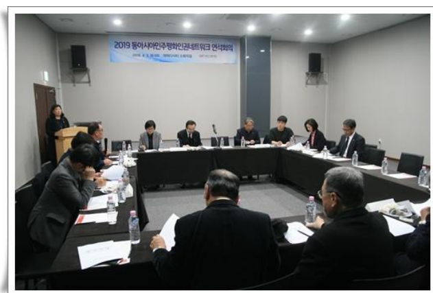
「東亞民主和平人權網絡」聯席會議

4 月 2 日的聯席會議中，就濟州 4.3 和平財團預定於今年 6 月於聯合國總部所召開「濟州 4.3UN 人權論壇」進行討論，包括本會在內的各個人權團體均同意以協辦單位名義共同參與此次的人權論壇，另決議將此訊息告知在美國紐約、華盛頓的結盟團體，以便就近參與。