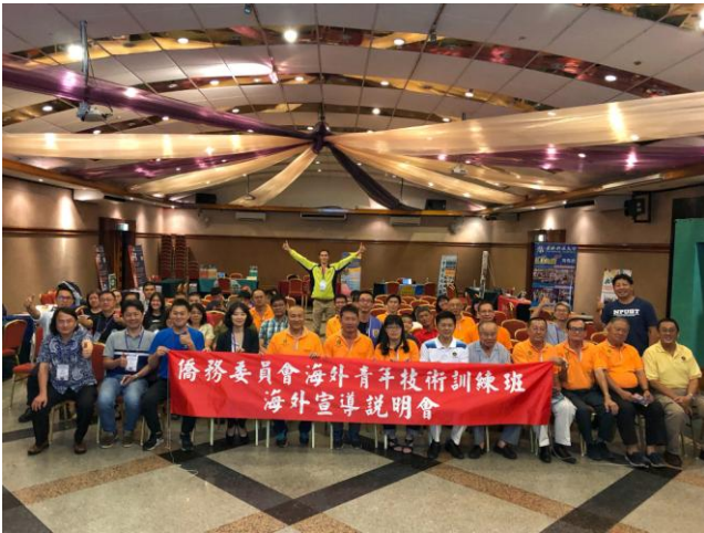
7月14日晚間「斗湖金都酒店」第4場招生說明會