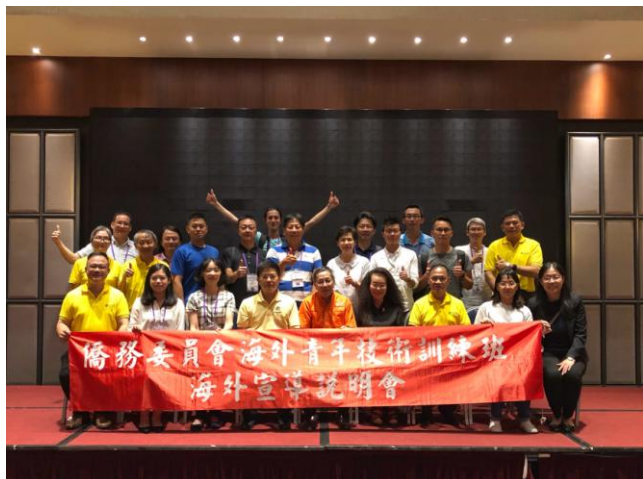
7月12日中午第39期海青班巡迴宣導新聞發布會