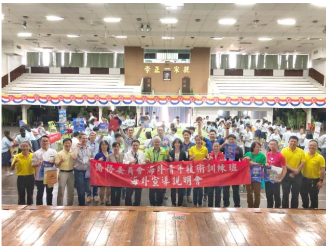
7月17日中午「沙巴崇正中學」第8場招生說明會