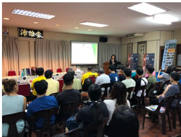
7月12日晚間「沙巴留臺同學會亞庇分會會所」第2場招生說明會