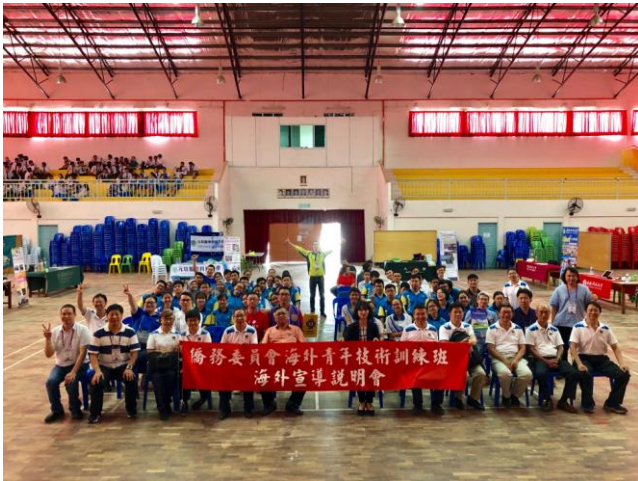
7月16日上午「根地咬根華中學」第7場招生說明會