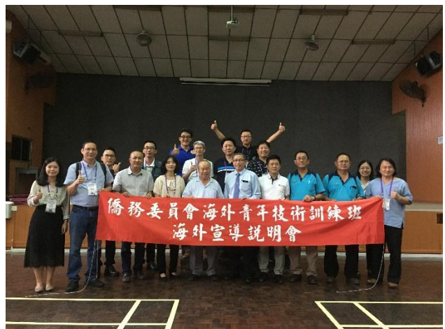
7月15日上午「斗湖聖巴特中學」第5場招生說明會