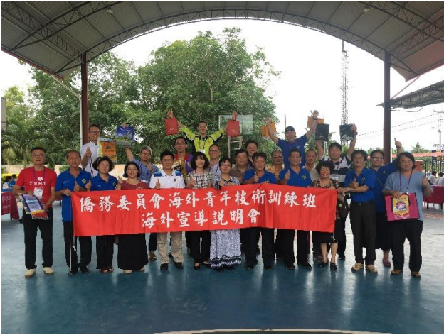
7月16日上午「丹南中華中學」第6場招生說明會