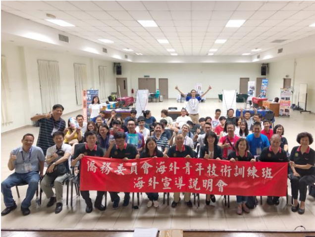
7月13日晚間「山打根育源中學」第3場招生說明會