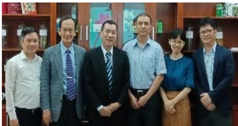
拜會越南河內國家藥用材料研究所(NIMM)