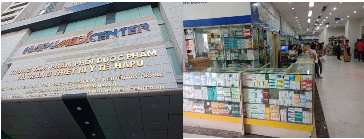
參觀 Hapu medicenter 河內最大藥品批發零售市場