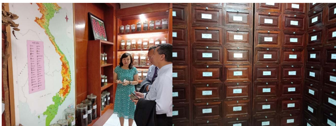
參訪國家藥用材料研究所藥材標本館