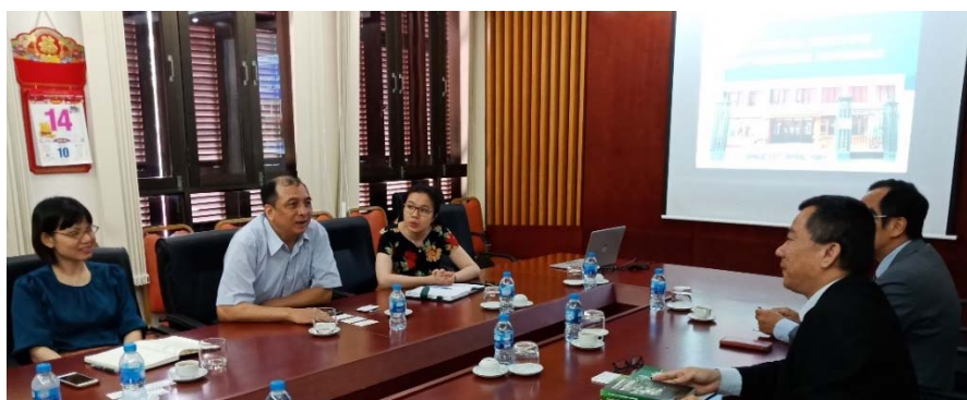
本所參訪人員與國家藥用材料研究所各所主管討論雙邊合作事項