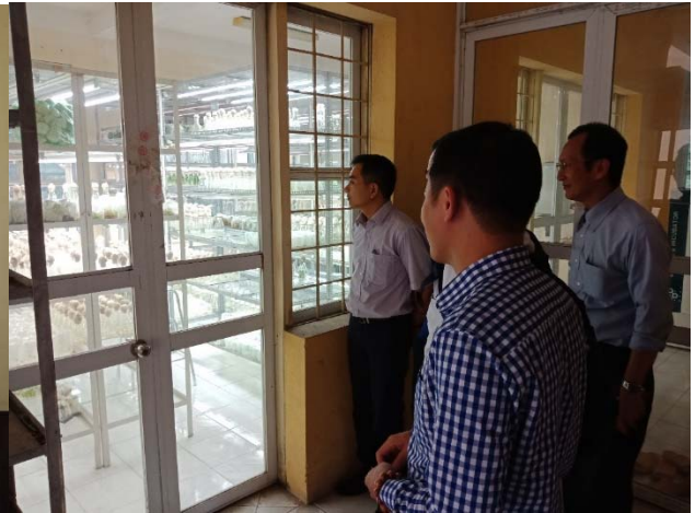
參觀國家藥用材料研究所藥用植物研究中心組織培養室