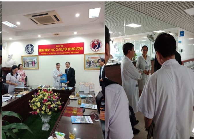
參訪越南越南國立傳統醫學醫院