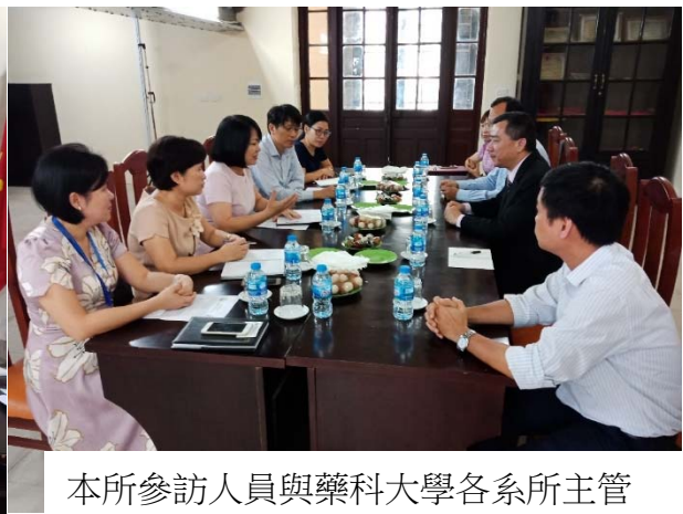
本所參訪人員與藥科大學各系所主管討論雙邊合作項目