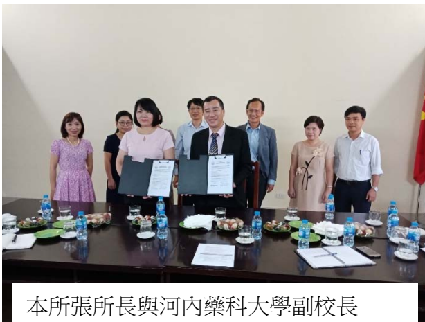
本所張所長與河內藥科大學副校長共同簽署合作備忘錄