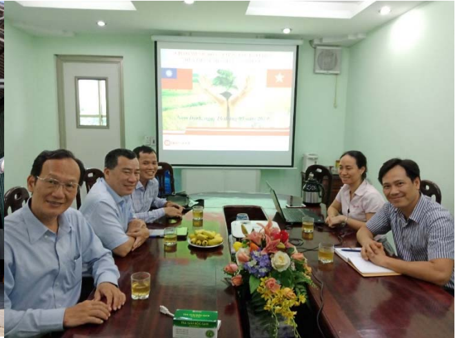
參訪越南南藥公司藥品保健品製造工廠