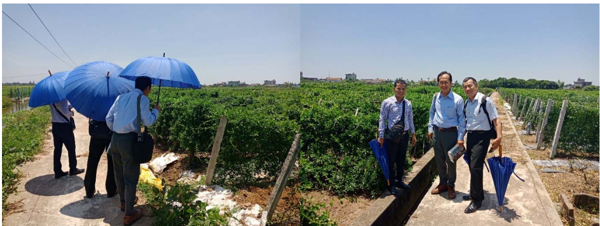
參觀越南南藥公司武靴葉植物種植區