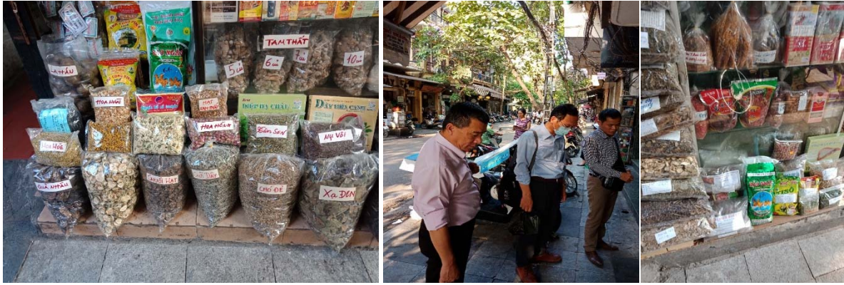
參觀越南河內傳統中草藥街