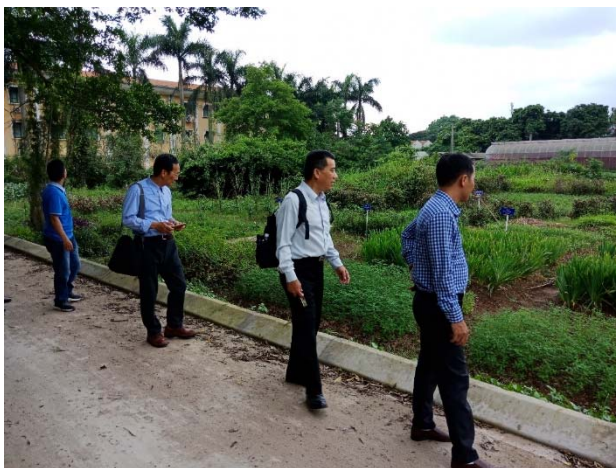
參觀國家藥用材料研究所藥用植物研究中心藥材種植區