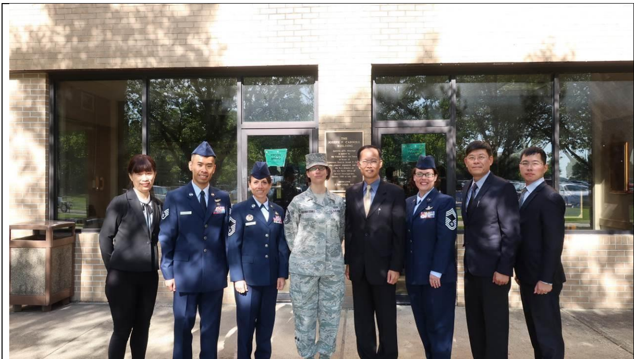
與安德魯斯基地士官領導統御學校校長合影