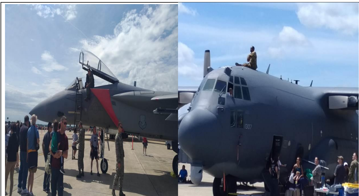
地面展示-F15 戰鬥機、AC-130 攻擊機 開放民眾進入座艙拍照