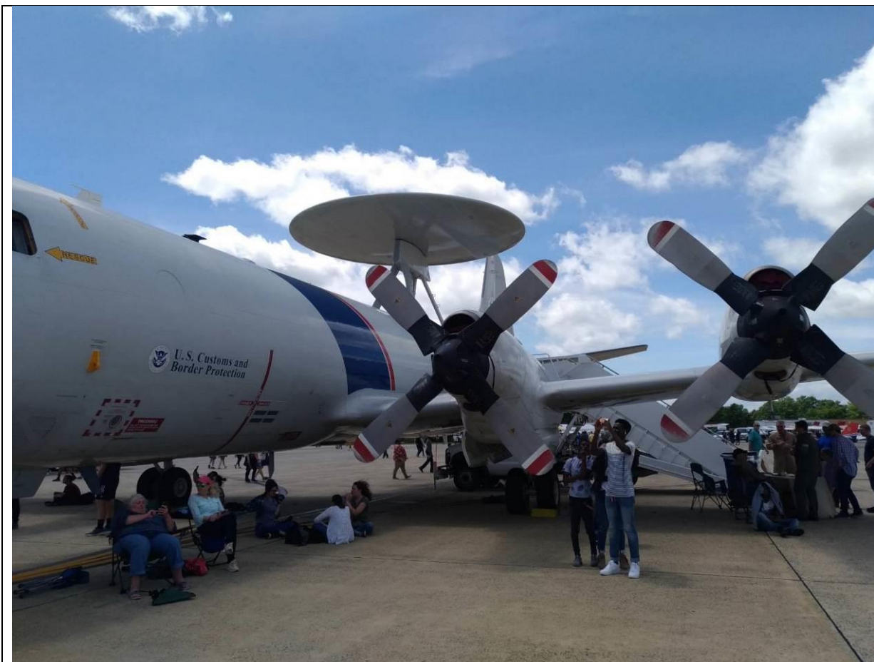
地面武力展示-海軍 EP-3 電戰機 可見民眾坐在飛機陰影處及開放民眾上機