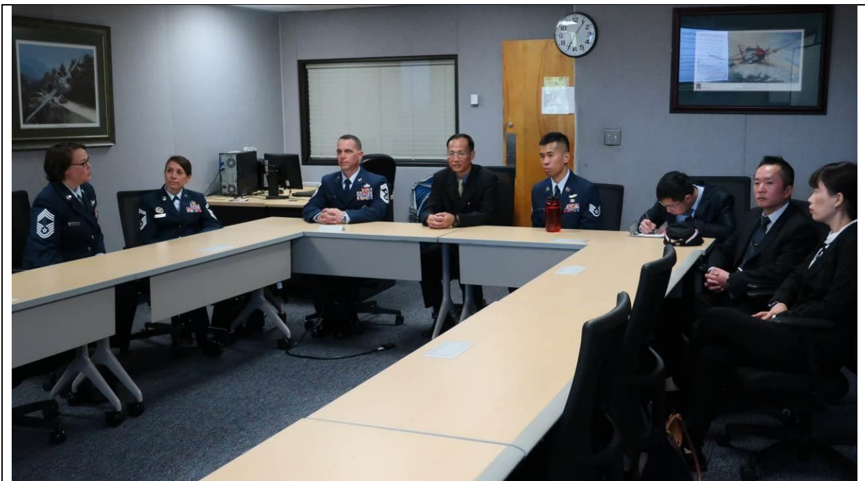
雙方就士官教育研討