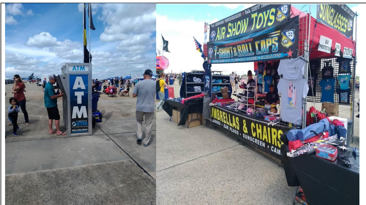
移動式 ATM 及攤販