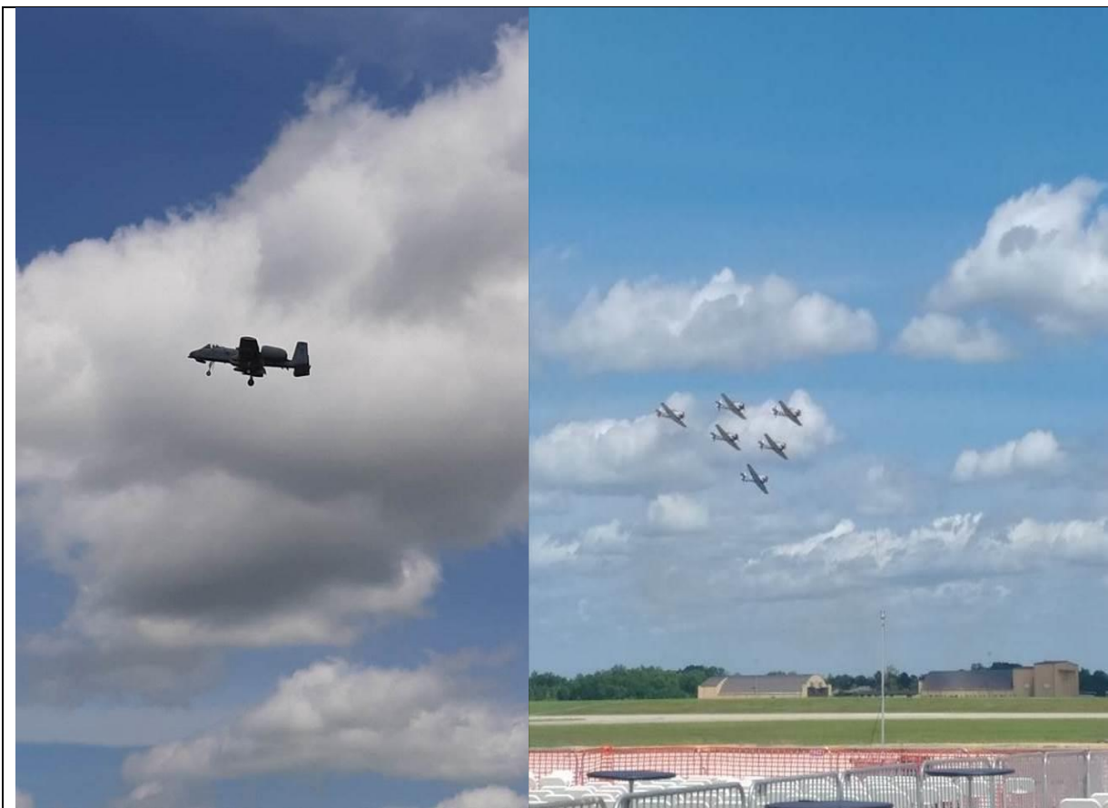
空中武力展示-空軍 A-10 攻擊機、P40 戰鬥機