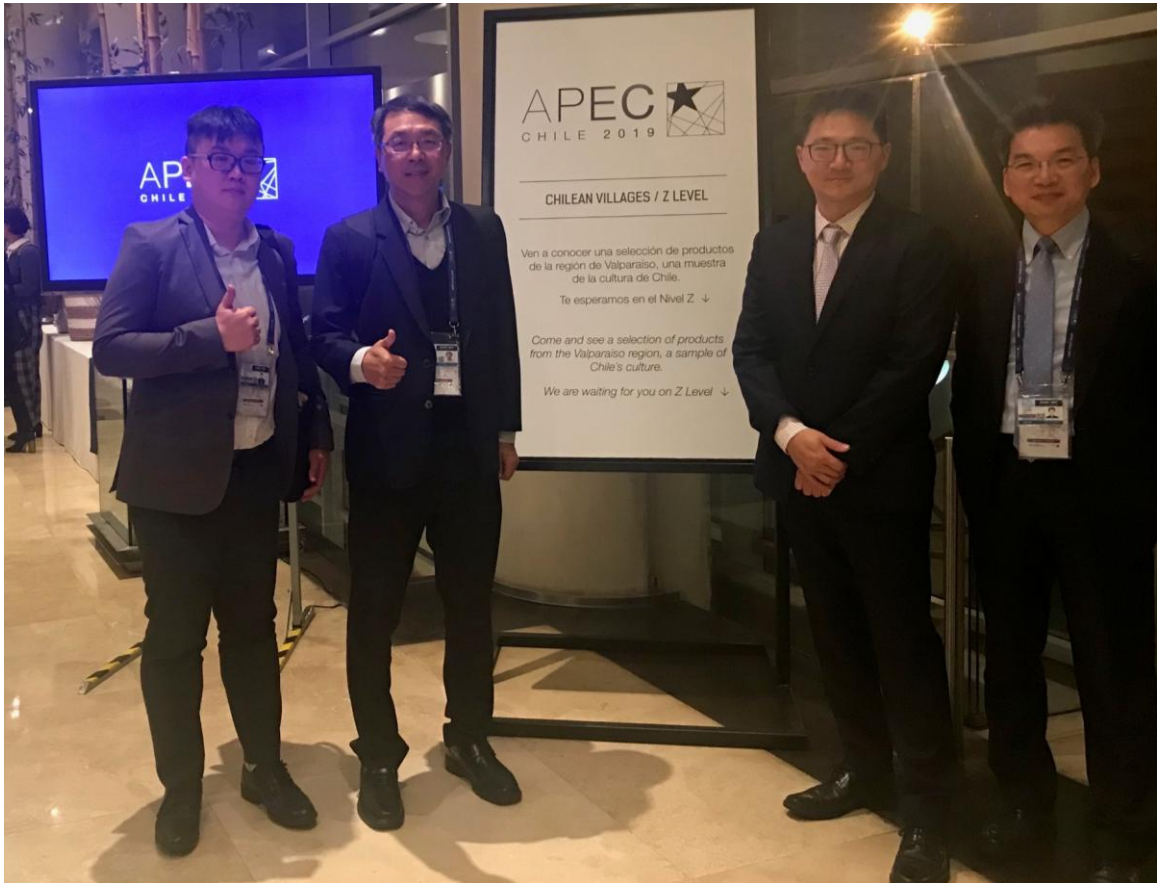
照片 1 提案報告團隊合照