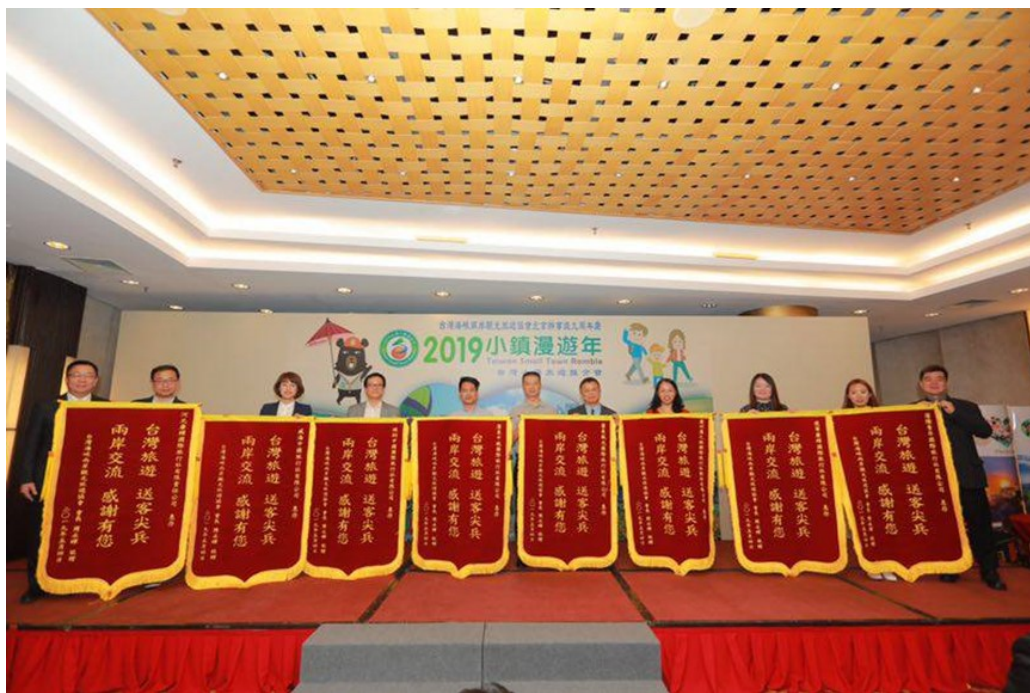
頒發感謝錦旗贈予長期支持臺灣旅遊的組團社