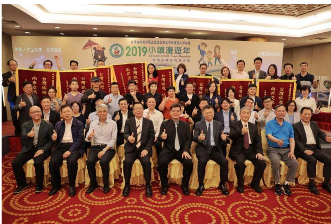
北京辦事處 9 周年慶祝活動