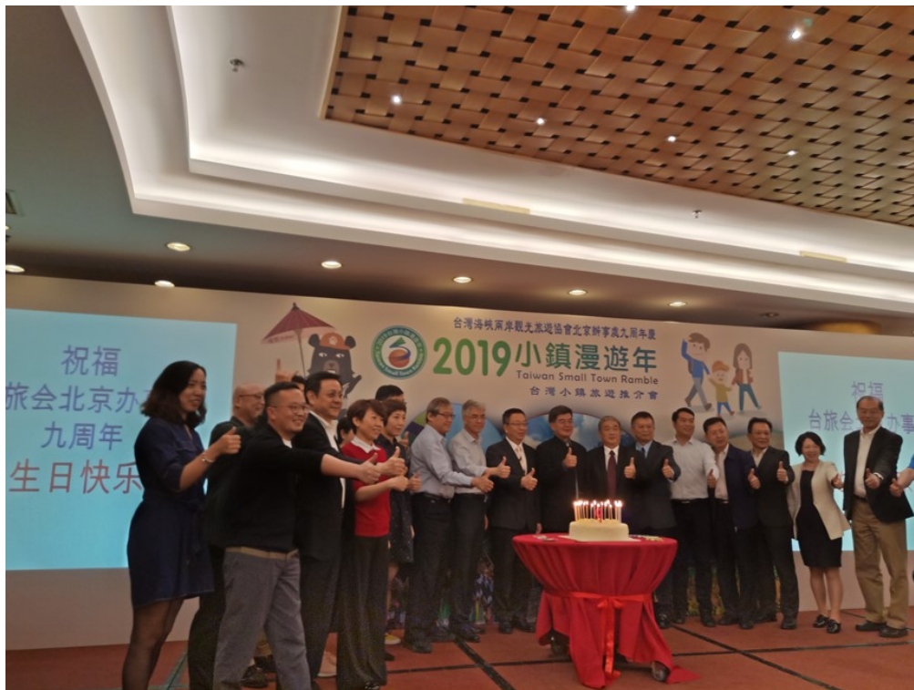
北京辦事處 9 週年慶祝儀式