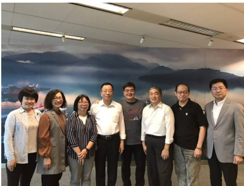
與北京辦事處業務交流