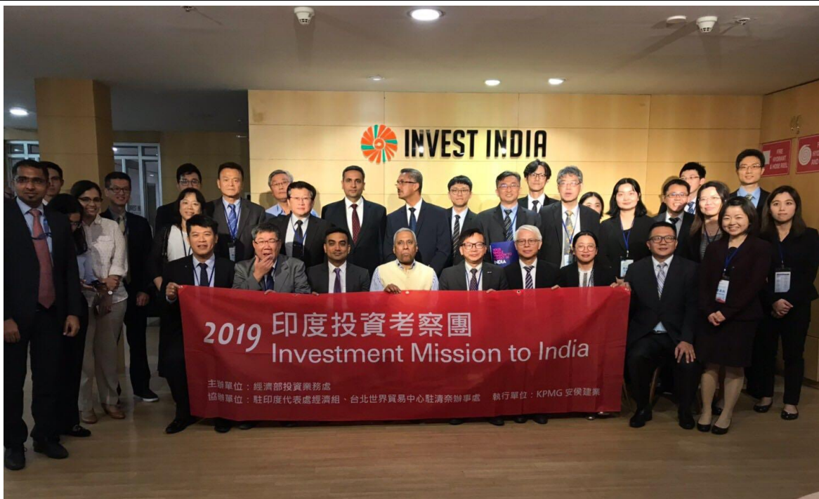
拜會 Invest India