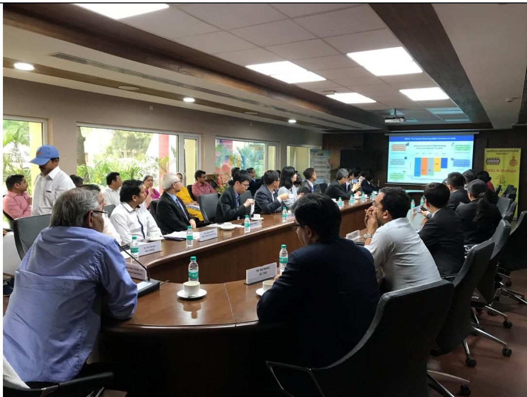
拜會 Haryana 州政府