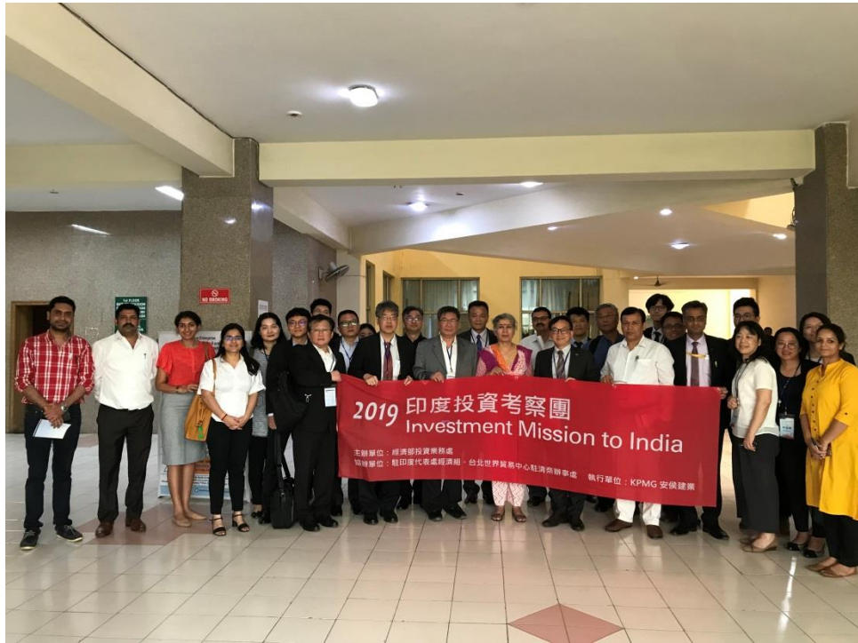
拜會 Manesar 工業區