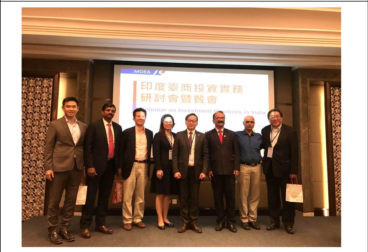
班加羅爾印度台商投資實務研討會