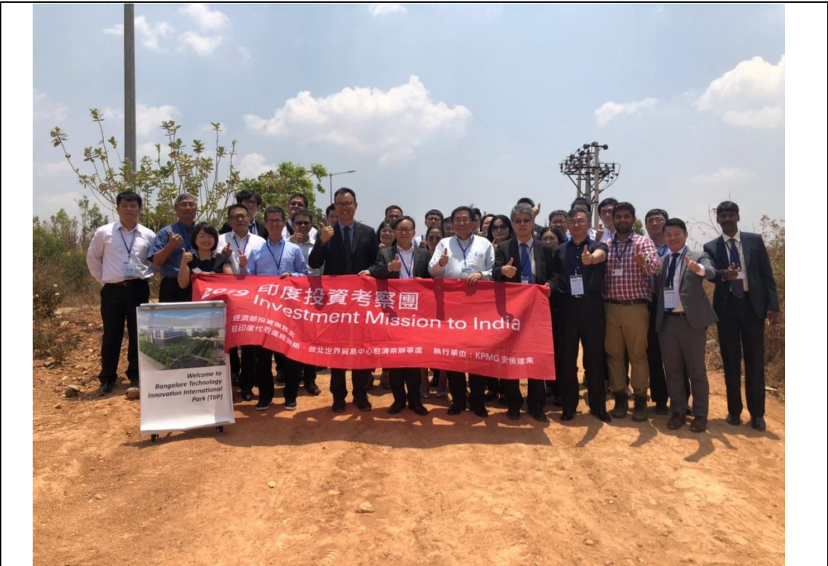
實地考察世正開發班加羅爾國際科技園區