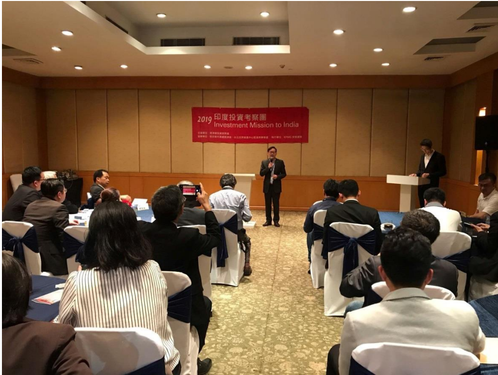
德里台商交流餐會