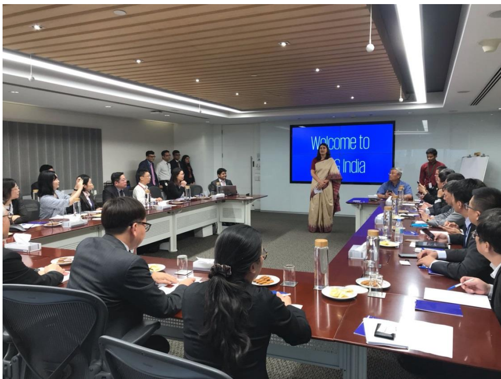
拜會 KPMG 印度所