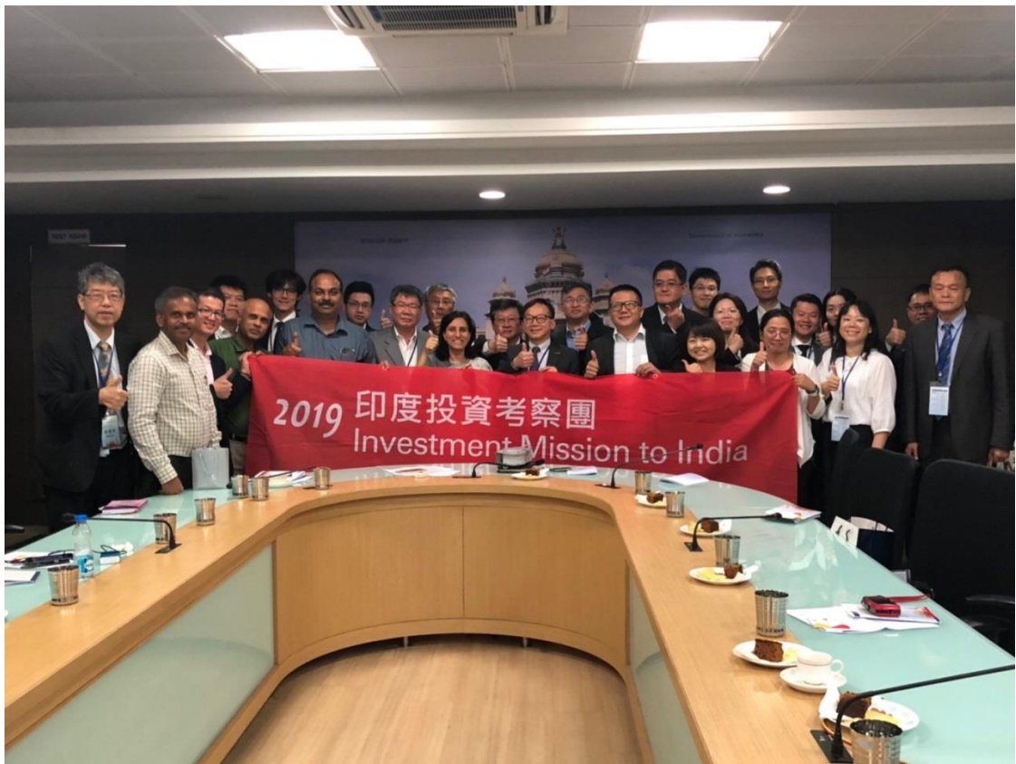
拜會 Karnataka 州政府