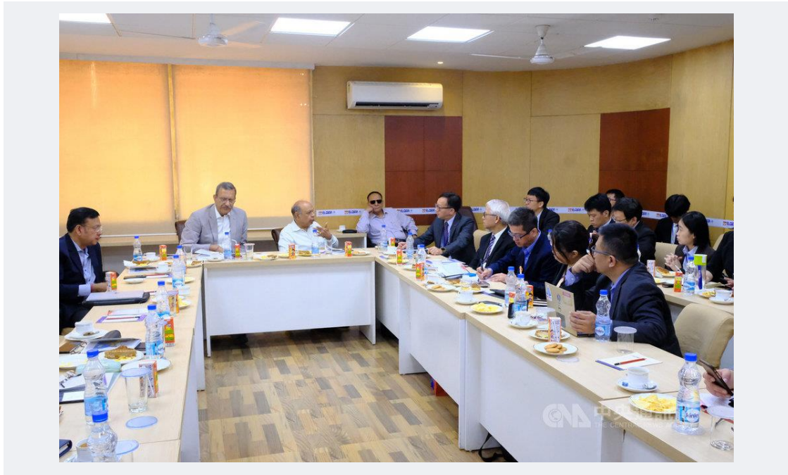
印度電子產業協會主席曼瓦尼（中右）10日解答經濟部2019印度投資考察團成員提出的問題。 108年4月10日