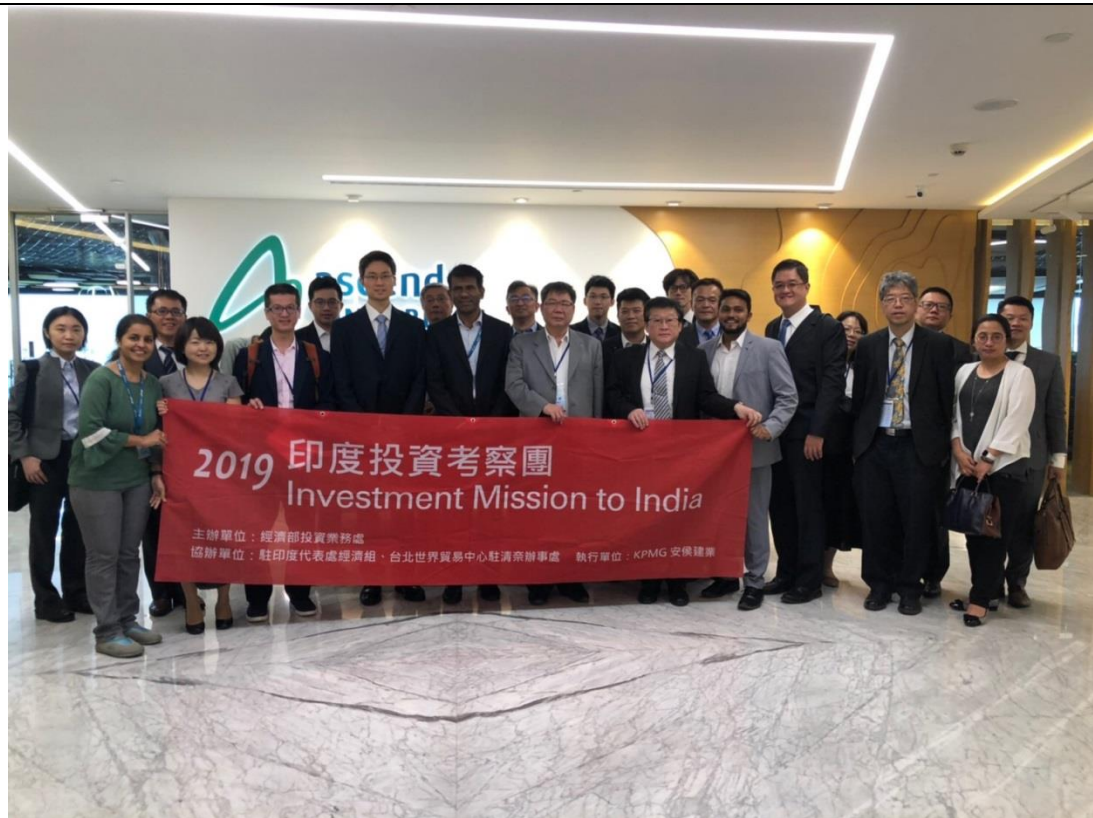
拜會星橋騰飛班加羅爾國際科技園