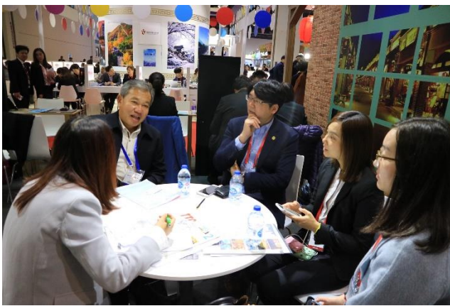
本局同仁與買家洽談