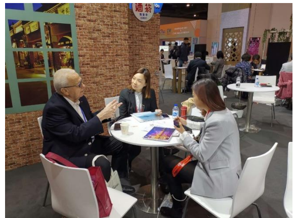
本局同仁與買家洽談