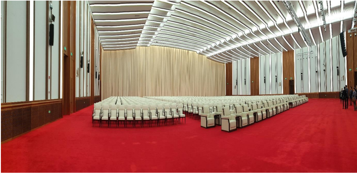
至(上海)國家會展中心參訪