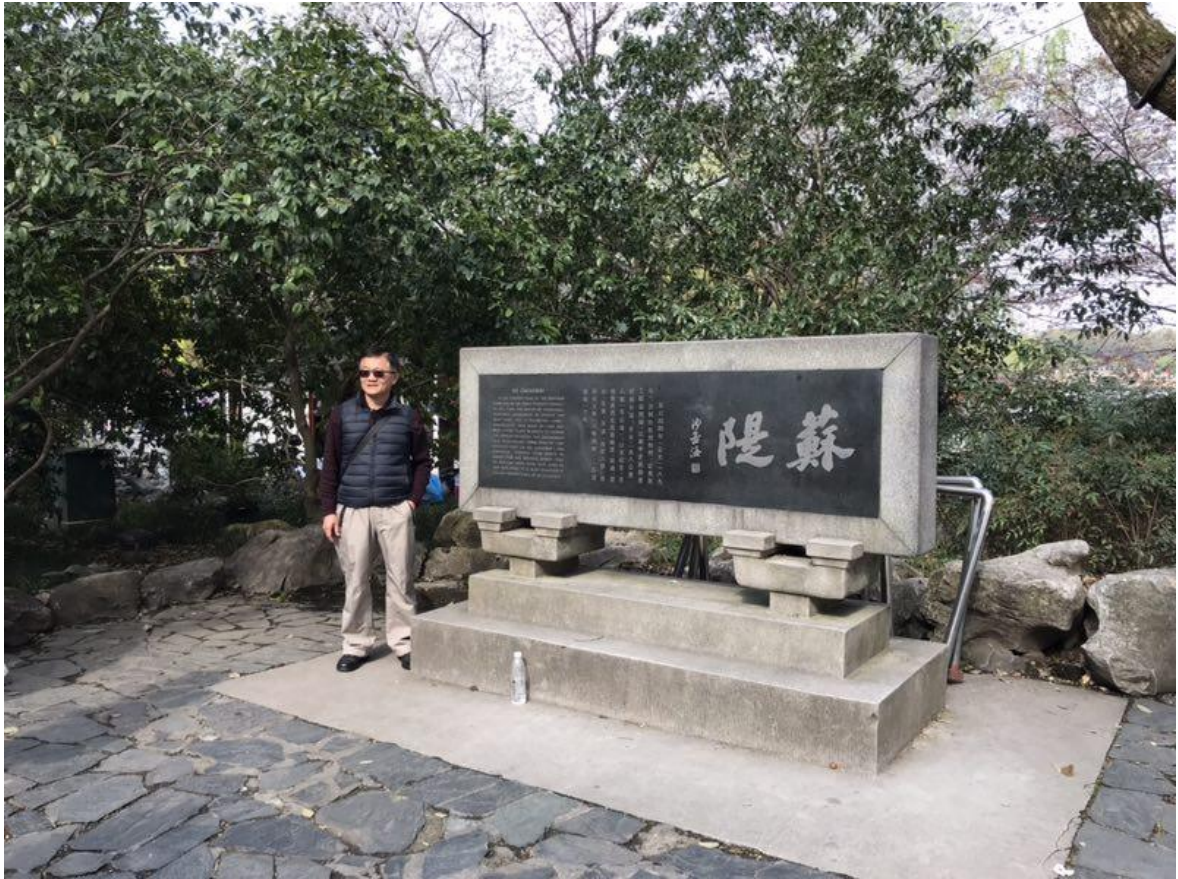
考察杭州西湖景區