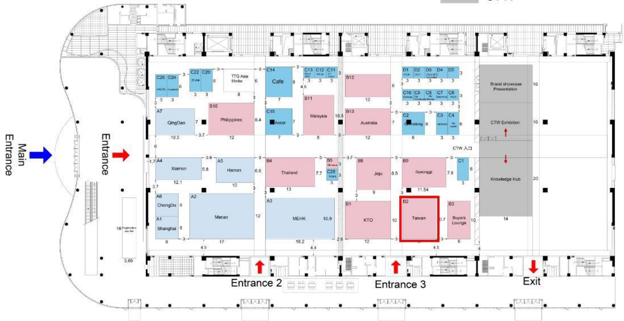
臺灣館展場位置圖