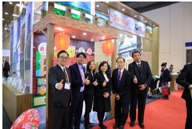
「國際會獎旅遊博覽會」臺灣館 (IT&CMC)