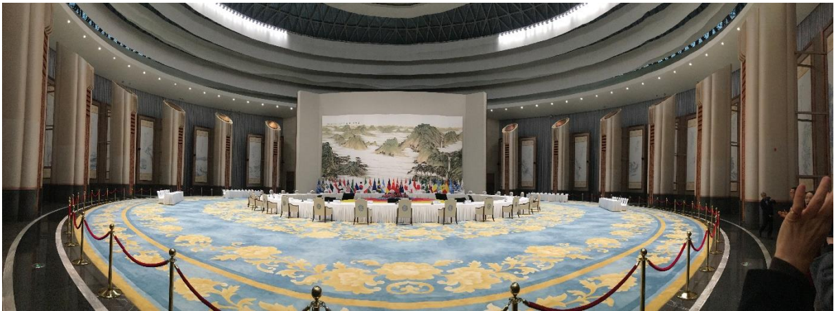
杭州國際博覽中心參訪