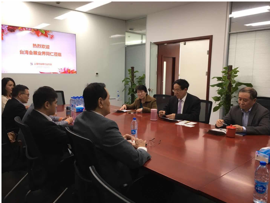
與上海會展行業協會(縮寫：SCEIA)就會務及組織交換意見