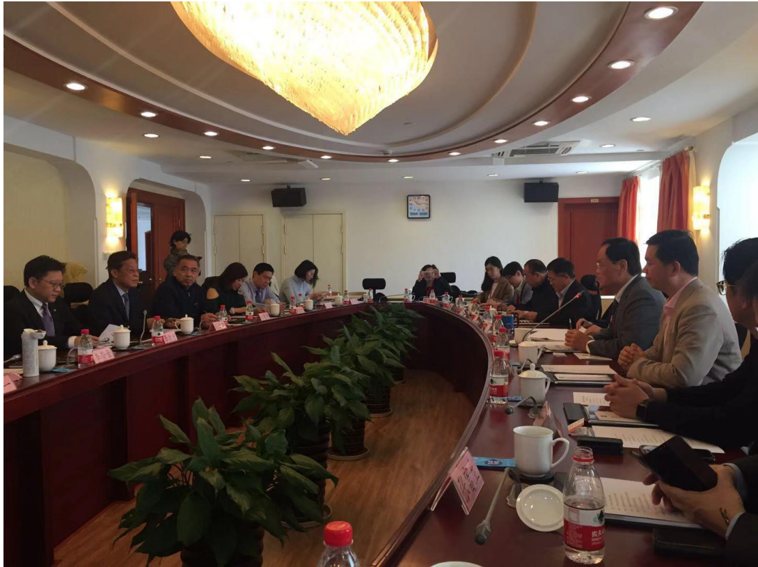
與上海市台灣同胞投資企業協會就會務交換意見