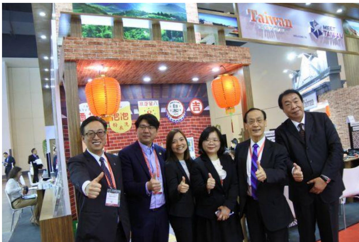
滬國際旅遊博覽會開跑 我觀光、貿易局組團參加