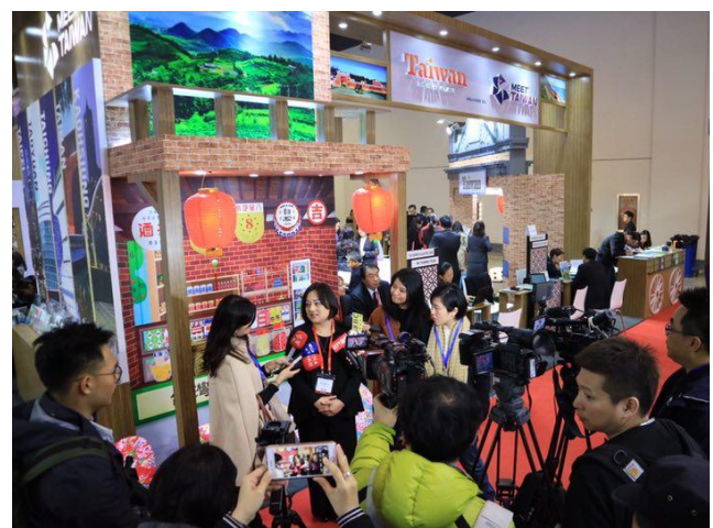
媒體採訪參展廠商