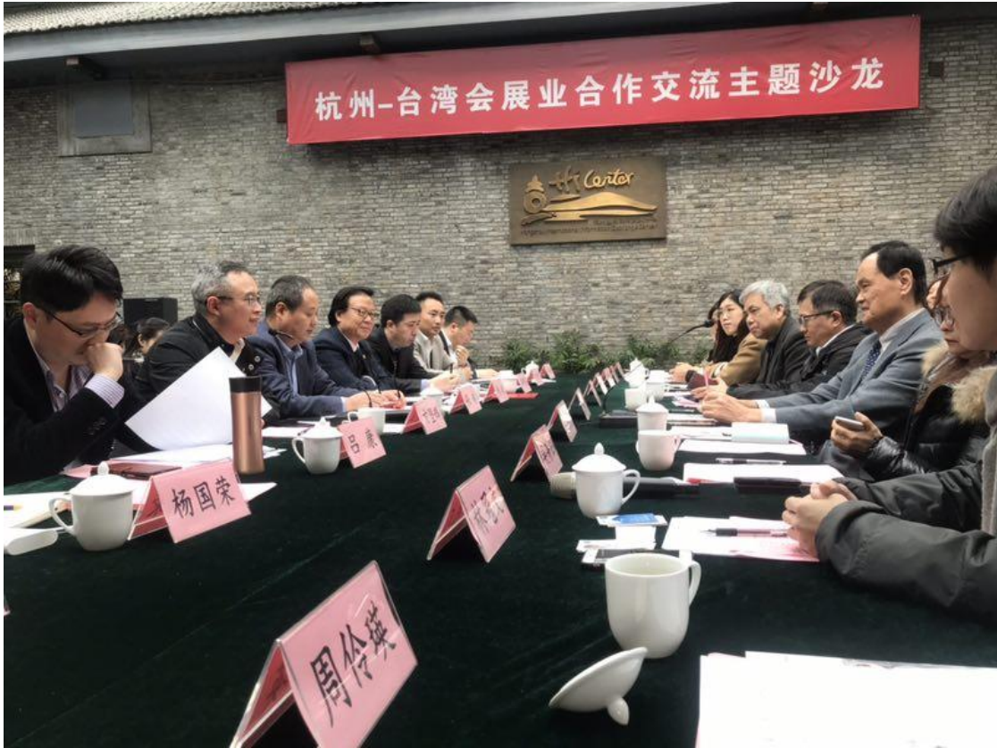
杭州-臺灣會展合作交流主題沙龍活動