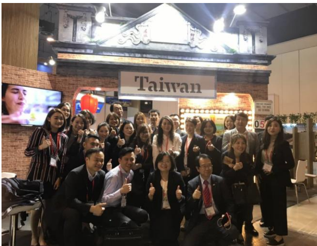
臺灣館參展廠商大合照