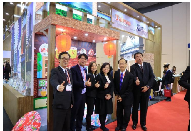
本局與國貿局合作參展