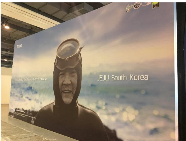
韓國館意象鮮明展攤設計