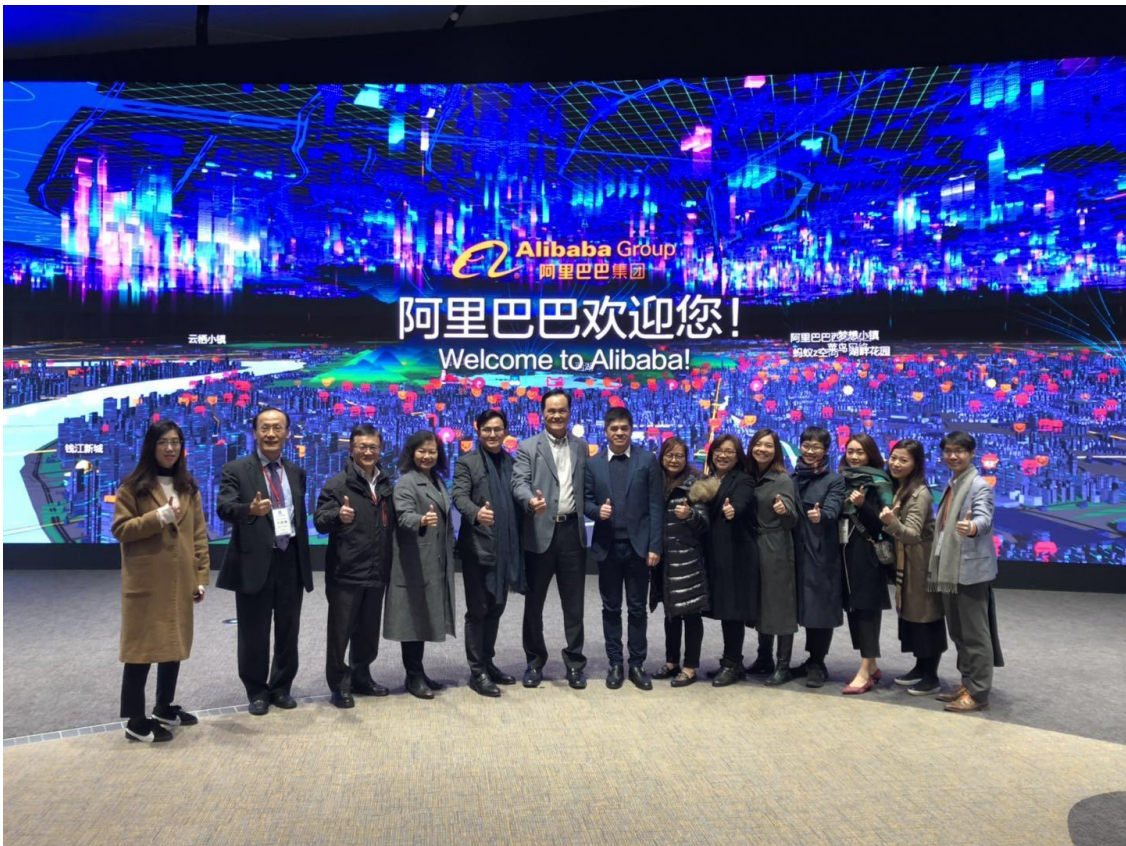
阿里巴巴企業總部參訪