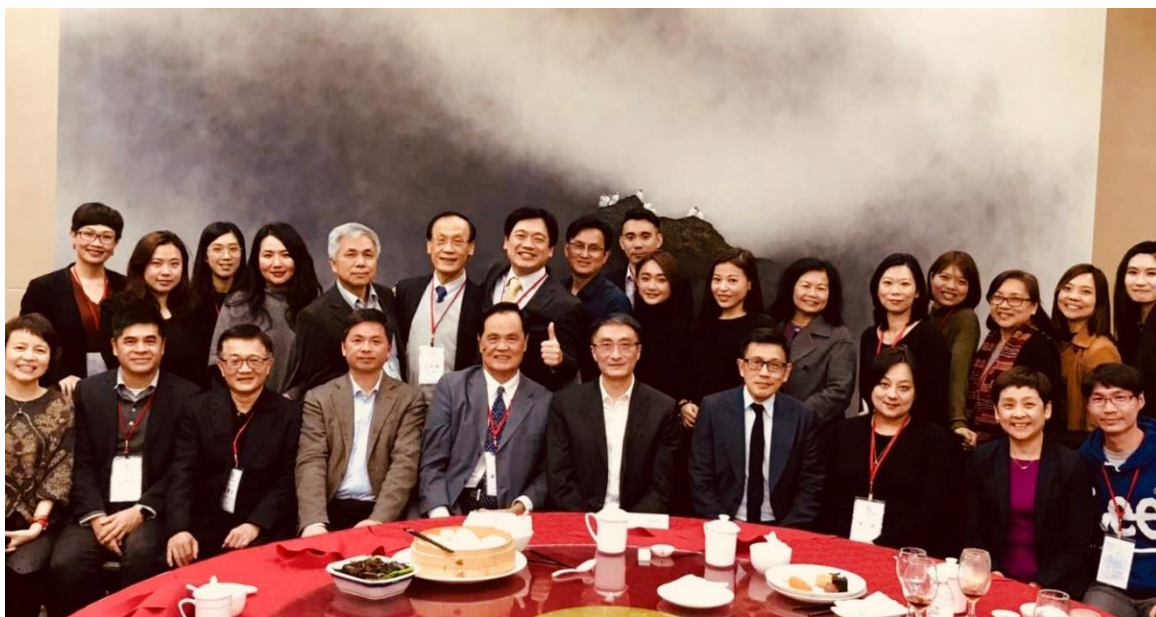
拜會東浩蘭生集團