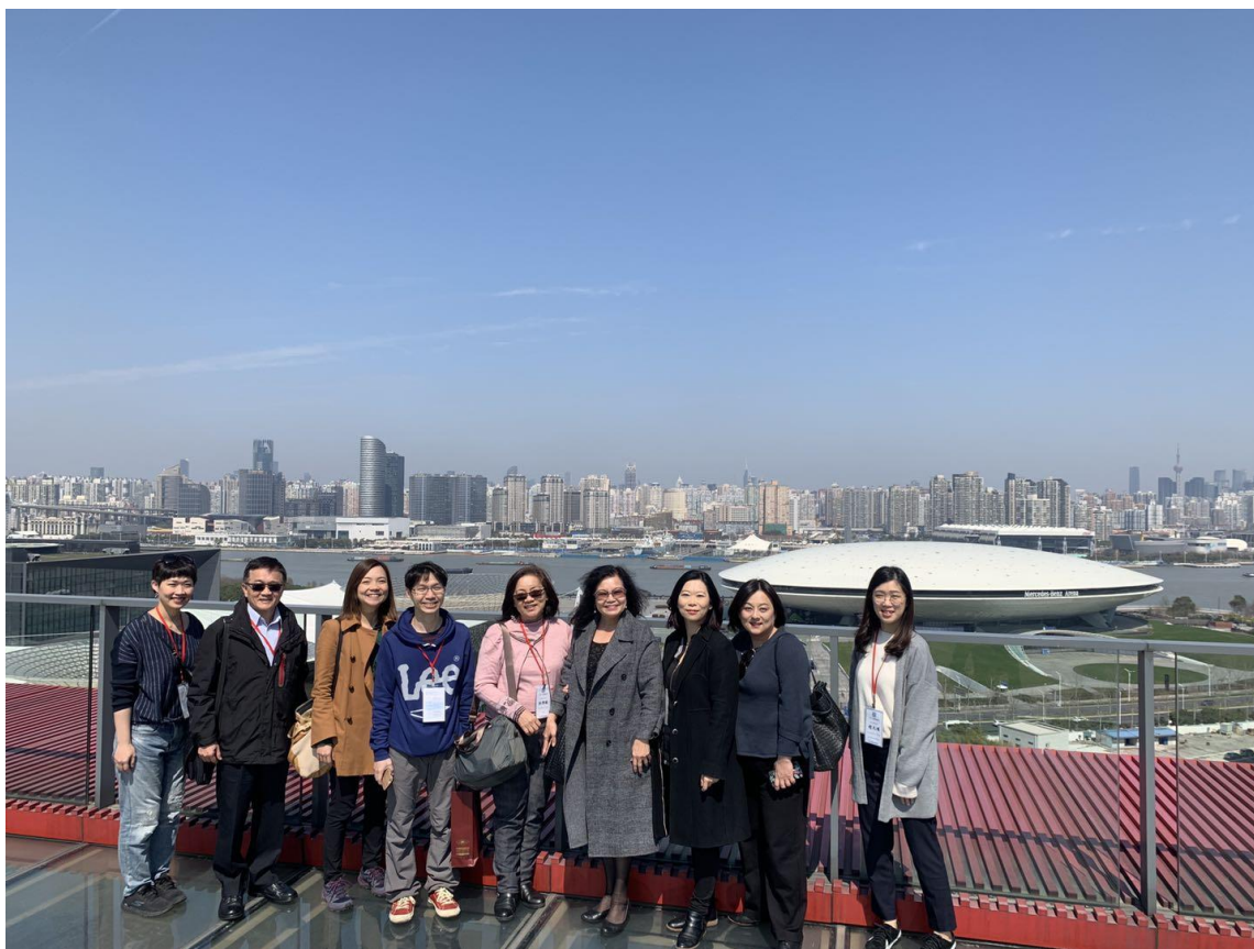
參觀世博後展館運用情形(世博園)