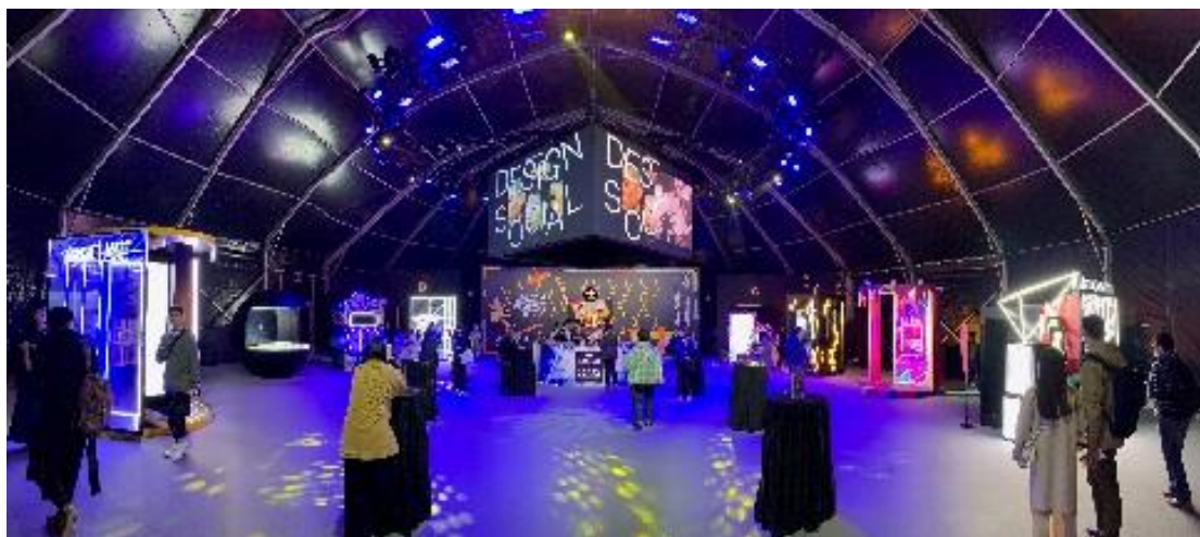
圖 12：C 區設有拍照背板、調酒區及裝置藝術

散場則由後方小門出場，需繞行一圈才能回到主展場入口，出口處與入口處相較，沒有特別規劃，較像逃生動線。