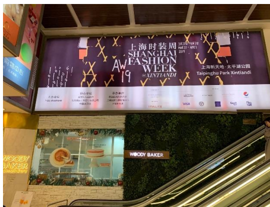
圖 19：新天地購物中心內之大型燈箱

值得一提的是，在市區路口的 LED 大銀幕、以及浦東的震旦大樓外牆，均可見上海時裝週廣告，尤其是震旦大樓、花旗銀行大樓外牆廣告，夜晚到外灘觀賞黃浦江夜景的觀光客，容易看到廣告，可見上海時裝週組委會對時裝週之宣傳力道，顯示出其「吹響全城盛事的號角」的一面。