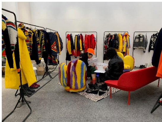
圖 6：買家交易洽談情形

展場設有輕食區可以免費取用飲料及點心，另有需付費之咖啡；場內設有商務中心，提供電腦及列印服務（1 張 1 元人民幣），洽談仍以在攤位內居多。此行參觀日為星期二上午，觀展人潮稀少，據訪談參展廠商 ANGEL CHEN 表示，週末時人潮眾多，「忙得一蹋糊塗」。詢問各攤廠商是否提供零售，均回答不提供零售服務。