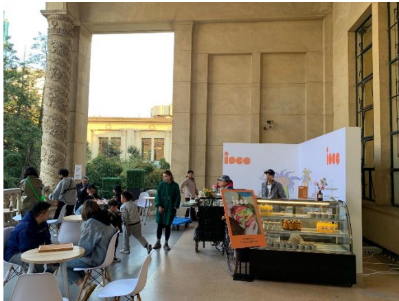
圖 2：2 樓陽台設置輕食區

觀者的舒適度。展區隔間係以白色木板隔間，大會提供白色衣架供廠商使用，參展廠商大部分在此架構下佈置，具一致性；少部分廠商會另外強化佈置，例如置放品牌 LOGO、設置電視牆等。整體來說，因為上海展覽中心建築本身即具美感，展場布置色調一致，空間感受上尚具質感。