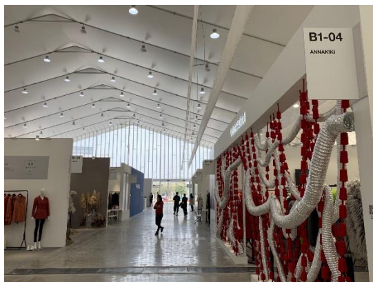
圖 5：Ontimeshow 布置風格

搭乘地鐵 11 號線到雲錦路，再步行 10 分鐘即可抵達西岸藝術中心，交通方便，從地鐵站走來，區域仍十分空曠，一路上有許多工程進行。參觀 Ontimeshow 亦需先至服務台以 QR-Code 掃描方式加入微信並填寫資料，填寫完畢取得手環配帶入場。展場為挑高設計，主色系搭配原有建築色調為白色，廠商攤位面積大，各廠商亦花心思布置展場攤位，每一攤均展現其品牌風格，觀展時猶如置身購物中心逛街。