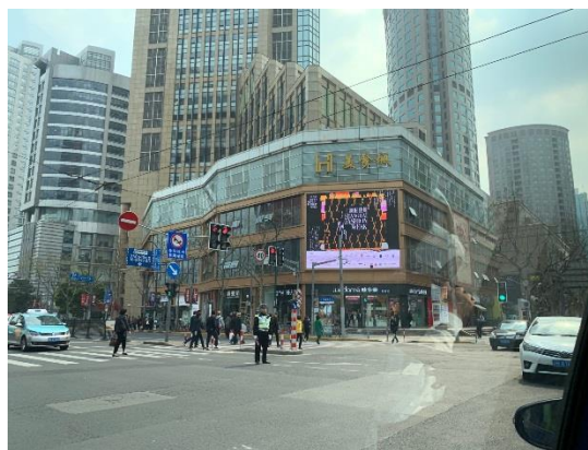
圖 21：市區路口 LED 大銀幕廣告