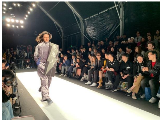
圖 16：媒體高台設在伸展台走道末端