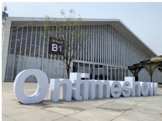
圖 4：西岸藝術中心 Ontimeshow 展場外觀