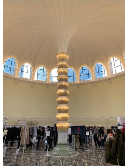
圖 3：上海展覽中心展場建築挑高

地圖及現場標示標有商務中心，惟實際參觀並無設置，經詢問服務台，商務中心係指服務台，並未另外提供買家洽談區域，推測是各買家多在廠商攤位洽談。