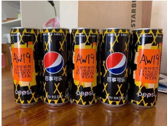
圖 23：上海時裝週紀念瓶百事可樂