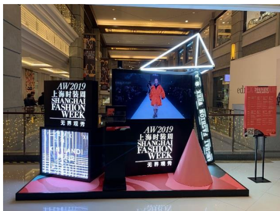
圖 18：新天地購物中心內之電視

此行從浦東機場降落進入市區，以及在市區活動，多半搭乘地鐵，觀察上海時裝週之文宣，惟並未見地鐵站內有時裝週之相關廣告。在主展場附近之上海新天地購物中心內，設置電視，提供走秀畫面給沒有入場看秀的逛街民眾觀看，不過實際上並沒有太多人駐足，反而較像是裝置藝術打卡點。上海新天地購物中心內，亦有大型燈箱。在新天地周邊街道上，隨處可見上海時裝週之路燈旗，觀光客來此，容易感染時裝週氛圍。