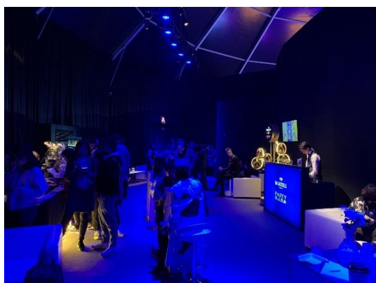
圖 13：VIP 區

散場則由後方小門出場，需繞行一圈才能回到主展場入口，出口處與入口處相較，沒有特別規劃，較像逃生動線。