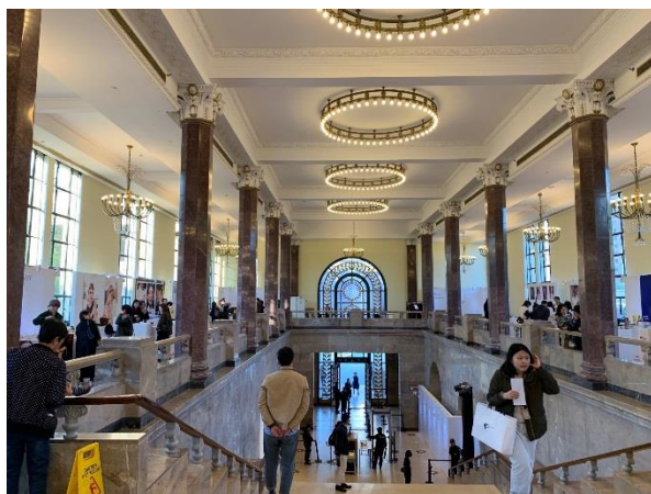
圖 1：展會入口挑高大廳

參訪時需在入口處以 QR-Code 掃描方式加入時堂的微信，並填寫資料加入會員，即可取得吊牌配掛入場。展會入口為挑高式大廳，展現建築氣勢與風格，動線為引導參觀者先上 2 樓再下 1 樓，出入口動線分流。