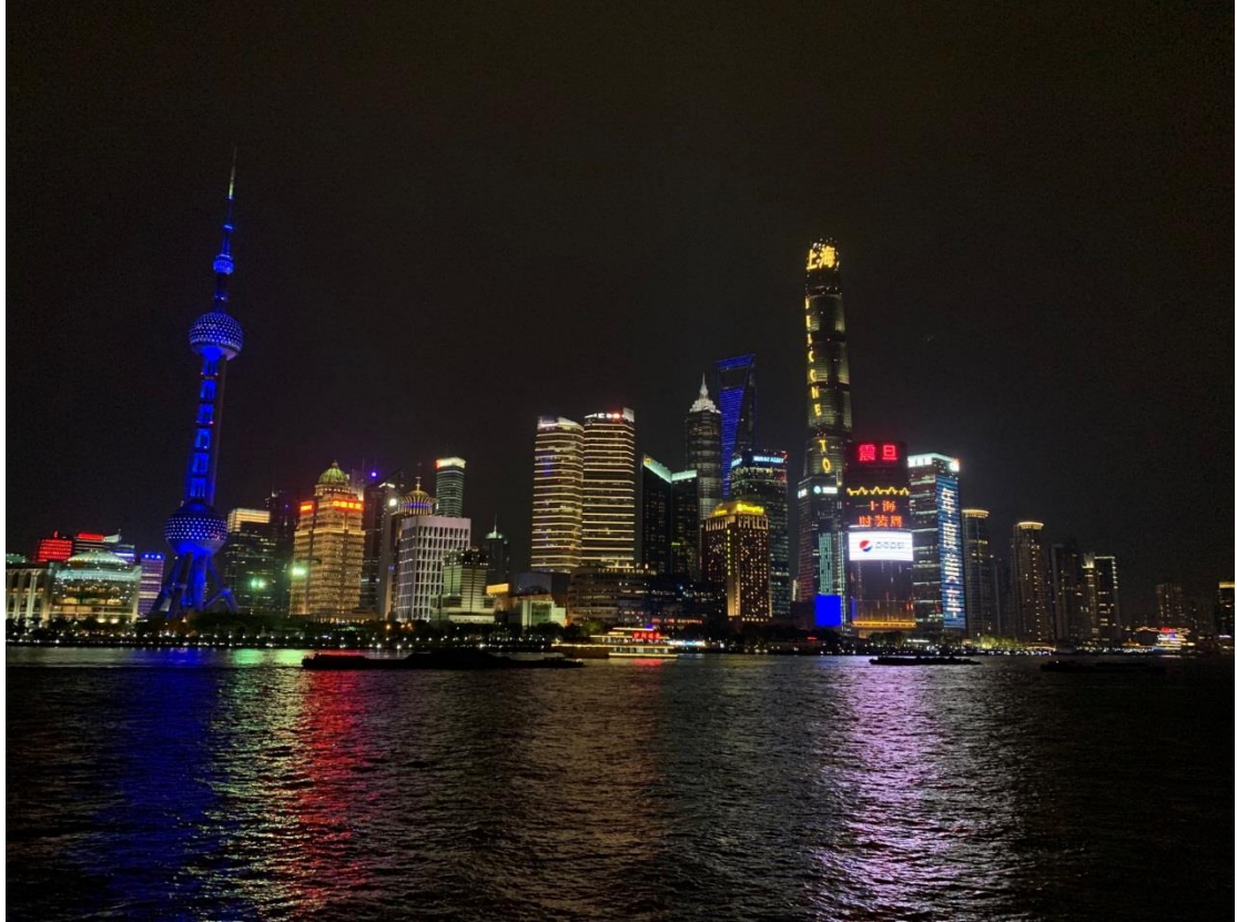
圖 22：從外灘看震旦大樓之外牆廣告

在出版刊物方面，上海時裝週印製一本官方手冊，內容包括時裝週各大品牌、showroom 和活動時程。此外，上海時裝週與 VOGUE 服飾與美容合作出版的《上海時裝週 VOGUE 每日快訊》，內容包括前日品牌季活動精彩報導、品牌介紹、近期活動預告等，這是每日印製發送的，提供紙本的最新消息。