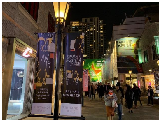
圖 20：新天地之路燈旗

值得一提的是，在市區路口的 LED 大銀幕、以及浦東的震旦大樓外牆，均可見上海時裝週廣告，尤其是震旦大樓、花旗銀行大樓外牆廣告，夜晚到外灘觀賞黃浦江夜景的觀光客，容易看到廣告，可見上海時裝週組委會對時裝週之宣傳力道，顯示出其「吹響全城盛事的號角」的一面。