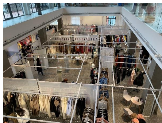
圖 9：TUBE showroom 布置風格

本次參訪係由獲本部「補助文創事業國際參展」而前往上海時裝週參展之廠商黃薇國際創意設計有限公司協助引導進入，展場為 1 樓，場地不大，有挑高設計，布置以白色支架及幔簾為隔間，2 樓則有咖啡販售。參訪時並實地瞭解廠商參展情形，並交換意見。詢問各攤廠商是否提供零售，均回答不提供零售服務。