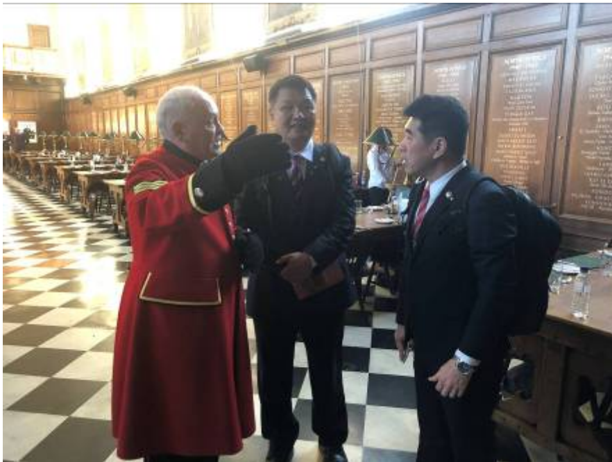
李副主任委員(中)參訪皇家陸軍愜而喜榮民之家，對該家之住民照護印象深刻。