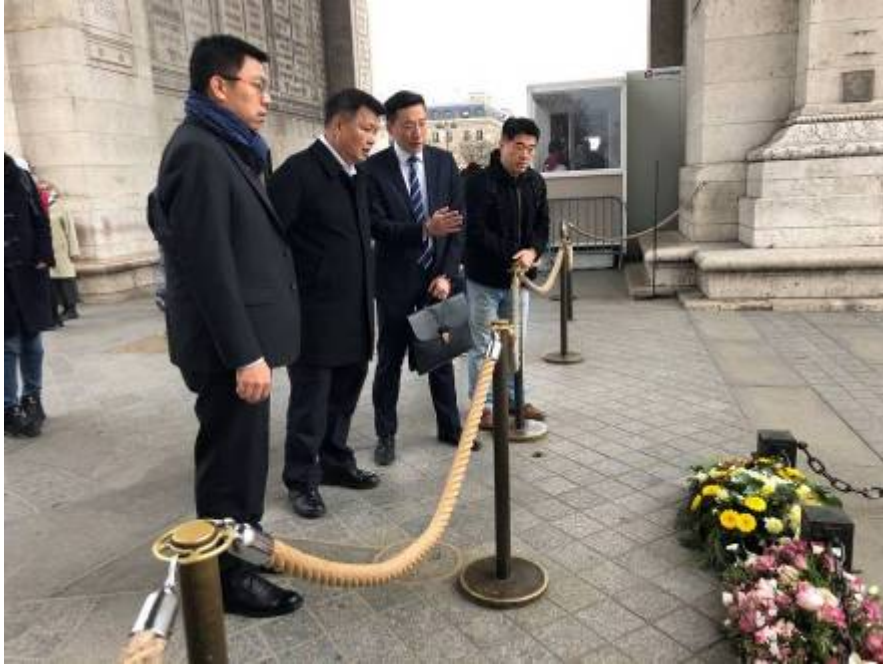
李副主任委員(左2)參訪法國凱旋門，仔細詢問其設計理念，俾為本會設立祭民紀念碑之參考。