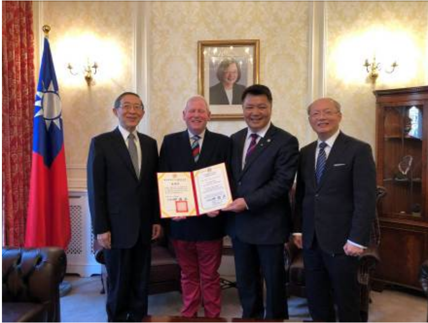
李副主任委員(右2)在我駐英大使林永樂(左1)見證下，頒贈英國退伍軍人援助協會密爾羅伊博士(左2)本會榮譽狀，表彰渠對促進兩國退伍軍人事務之貢獻。