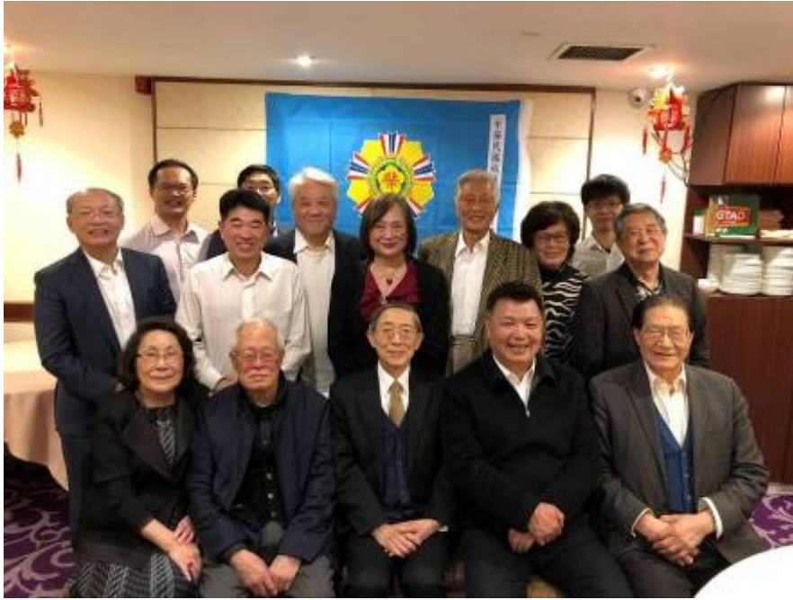
李副主任委員(前排右2)訪視英國榮光會，表明政府服務照顧榮民的決心，獲儲理事長(前排右1)在場會員一致認同與肯定。