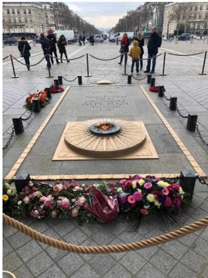
凱旋門之長明燈，地上刻印著墓誌「這裡安息的是為國犧牲的法國軍人」。