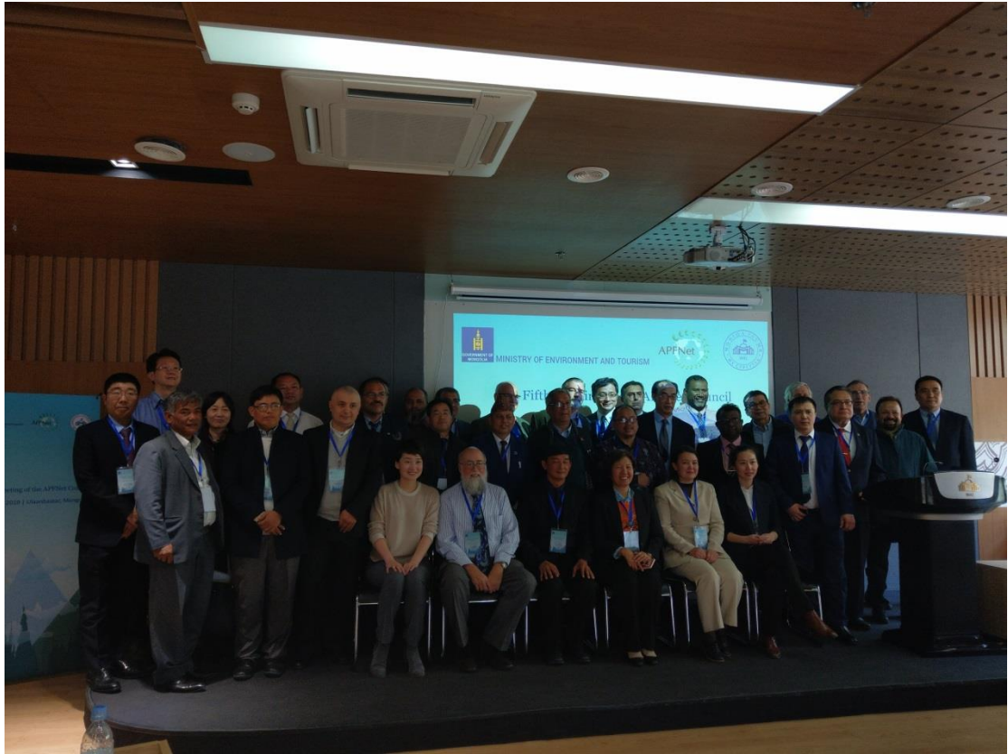
圖、出席亞太森林組織理事會第五屆會議代表合影。