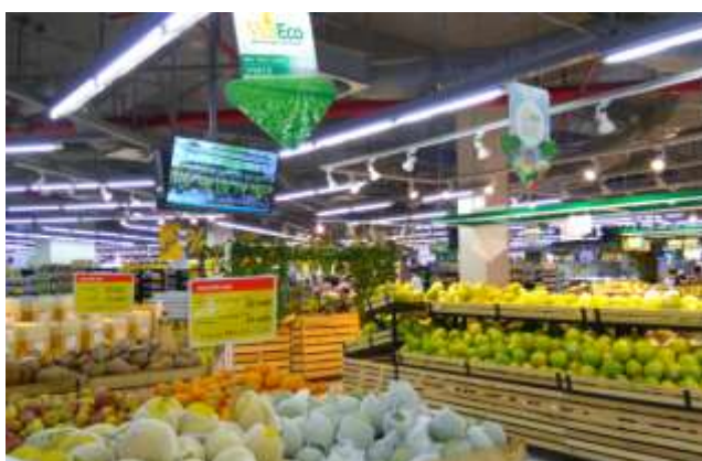
圖 28. 超市主打 VinEco 蔬果，利用明顯標示、播放農場生產管理影片等方式，加強消費者對品牌的認同