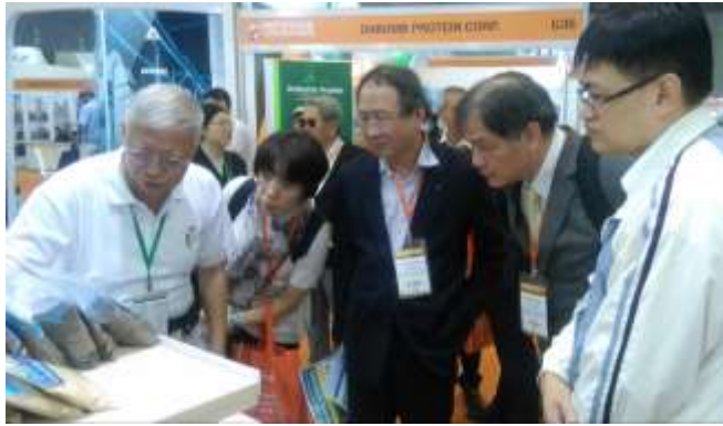
圖 4. 黃副主委和參訪團團員聆聽業者介紹產品特色