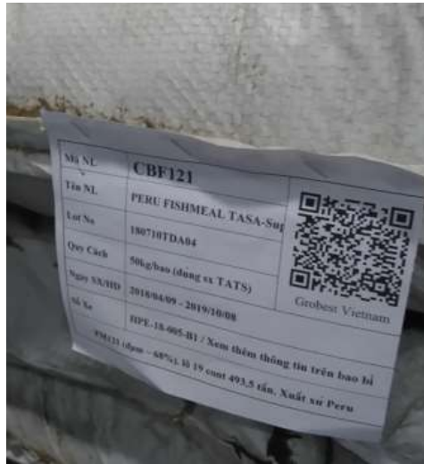
圖 18. 飼料袋上標示生產資訊及 QRCode，方便人員追蹤管理