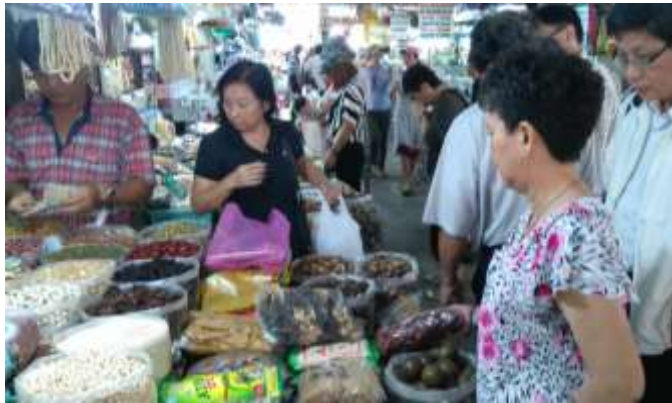
圖 21. 安東傳統市集銷售乾貨方式類似早期台灣迪化街

為了解越南當地通路情況，本日上午安排前往安東傳統市集，安東傳統市集類似台北迪化街，販售各種乾貨與民生用品，主要消費者是一般越南民眾，型態上仍非常傳統和落後。Co.opmart 連鎖超市是 Saigon Co.op 所投資，主要消費者群為越南中產階級，屬於中價位超市，類似台灣家樂福賣場。越南消費者也越來越注重食安問題，因此超市除了設有 VietGAP 蔬果區，還有 Co.op Organic 有機品牌專區，販售的有機生鮮產品有茉莉香米(Jasmine)、魚蝦和蔬菜。