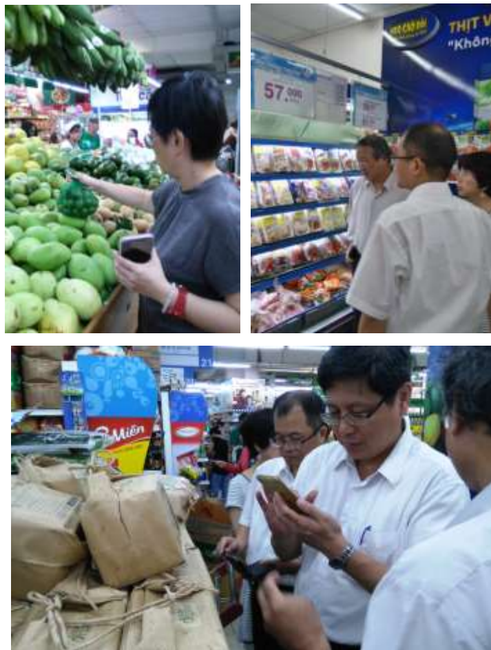
圖 25. 團員依負責的主管業務類別在通路內各自觀察