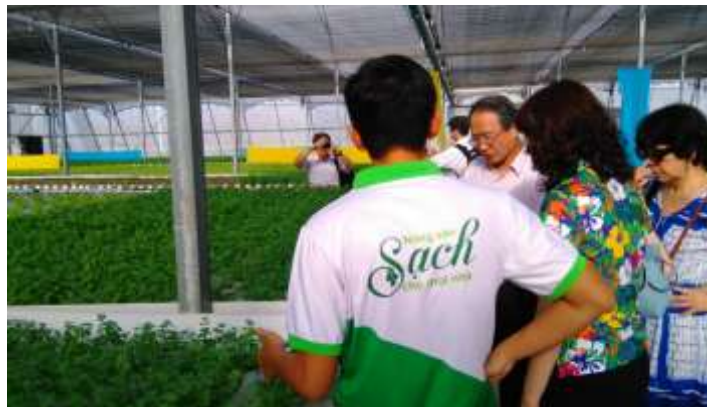
圖 19. 工作人員帶領團員參觀農場溫室