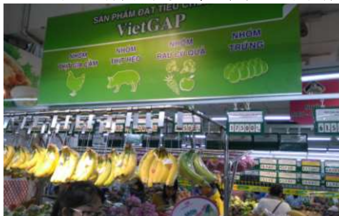
圖 23. 超市的 VietGAP 專區以蔬果為主