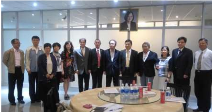
圖 3. 參訪團成員和與會來賓會後合照