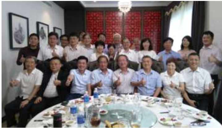
圖 26. 台商座談餐會與會人員合影