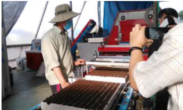
圖 20. 自動填土播種機操作情況