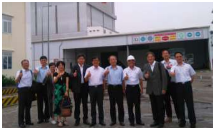
圖 13. 全體於大成越南飼料廠區合影