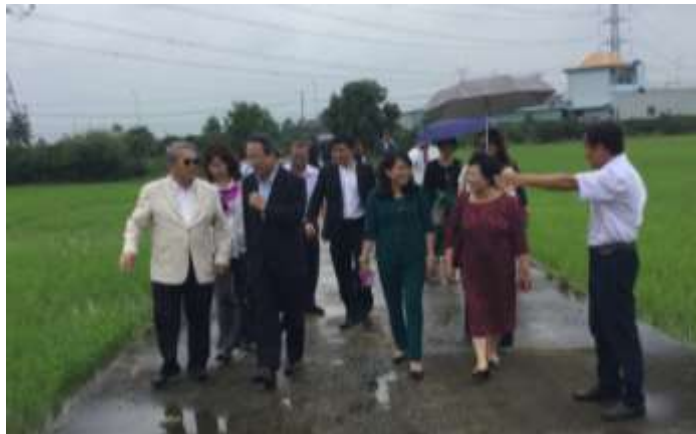
圖 9. 隆安省府帶領參訪團視察水稻保育中心