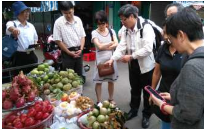
圖 22. 團員了解越南傳統市集的水果售價