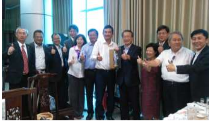
圖 8. 參訪團員與隆安省府代表合影留念