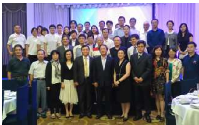
圖 7. 臺灣館晚宴結束後所有人員合影留念