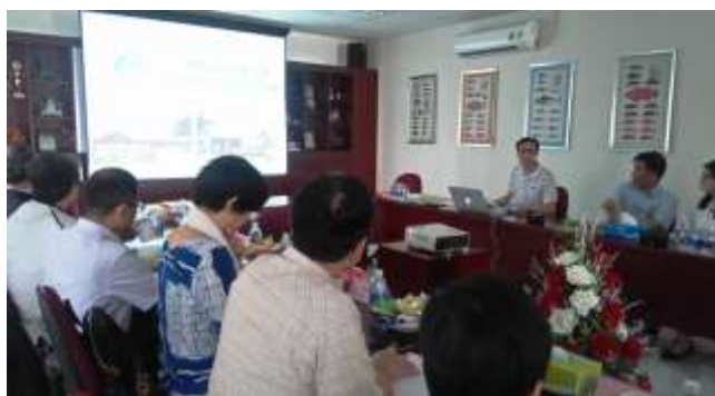
圖 16. 全興管理幹部簡介越南公司營運情況

全興會選擇以蝦飼料為主，主要是因為進入的技術門檻高可避開紅海市場，公司訓練了一批越南大學水產科系的技術團隊(業務人員)，約 160 餘名，負責巡迴於一萬戶蝦農和 400 家代理商，除提供技術協助外，也能清楚掌握用戶情況。全興已建立飼料生產追溯系統，每批飼料都可完整追溯原料來源，未來將整合產業鏈，建立蝦農生產養殖的 APP 平台，使蝦苗、飼料、養殖過程、加工包裝至產品物流供應，均能在一條龍的管理模式下監控，生產符合衛生安全且可追溯之蝦類產品。