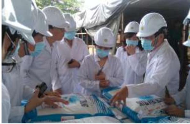
圖 17. 廠長說明全興飼料生產追溯系統