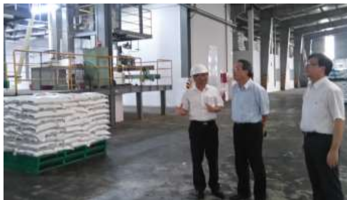
圖 12. 參觀大成長城飼料廠