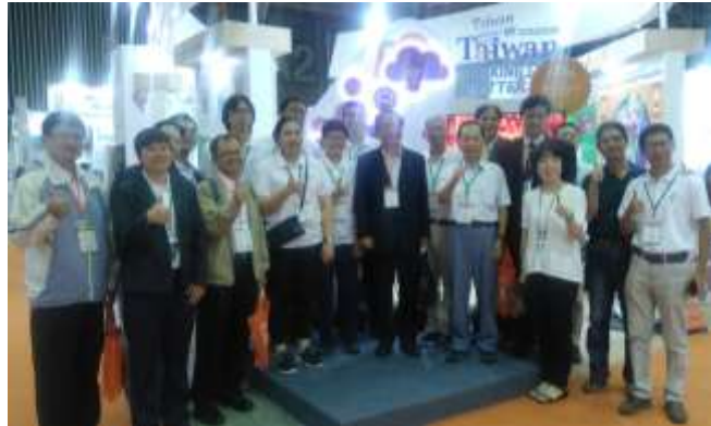
圖 6. 參訪團員與參展廠商和工作人員合照