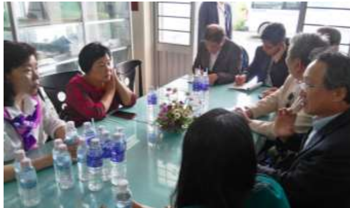
圖 10. 台越雙方針對水稻保育中心未來轉型為技術示範中心應採取之相關措施進行討論。