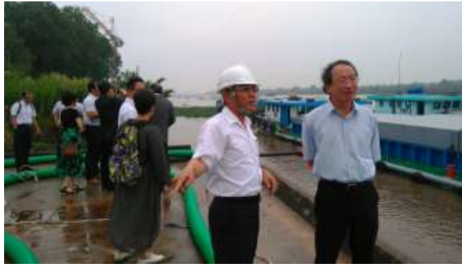
圖 14. 大成飼料廠於河邊設有自有碼頭，方便飼料運送入廠