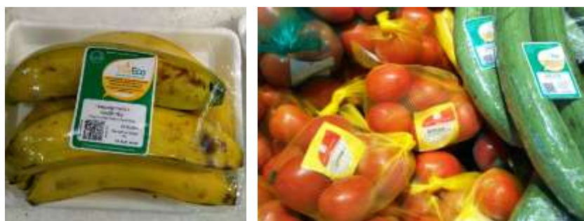
圖 29. VinEco 品牌蔬果都有標示及可追溯生產履歷的 QRcode