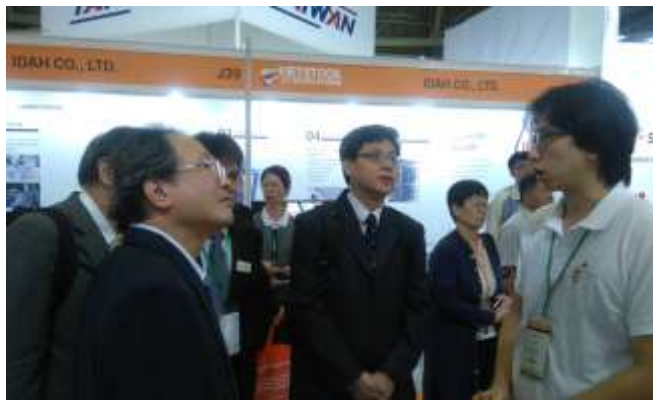
圖 5. 參訪團員對臺灣館每家廠商都仔細了解其特色