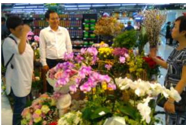
圖 30. 超市內有一小區販售小型蘭花盆栽和切花，都是越南當地生產