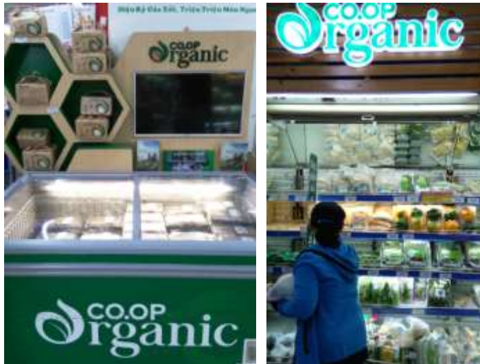
圖 24. 超市有機專區有獨立櫃位和特別標示