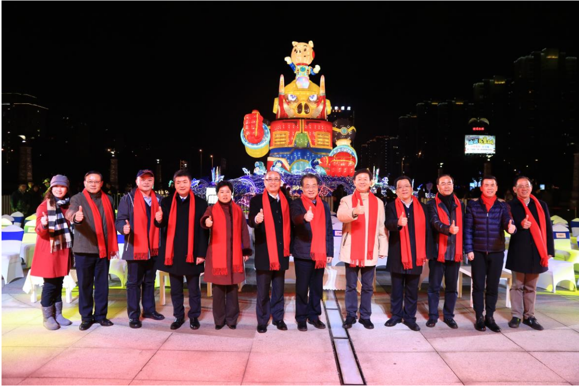
2019 臺灣江蘇燈會交流－開燈貴賓合影