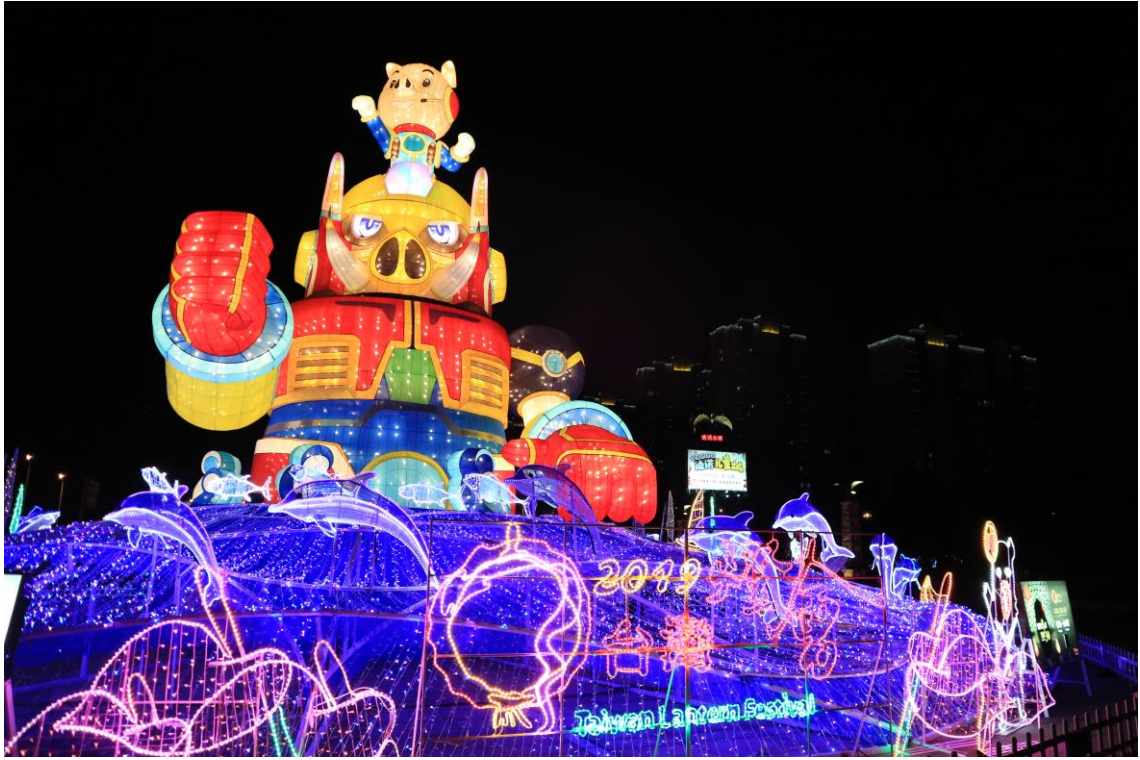
2019 臺灣江蘇燈會交流—台灣燈組