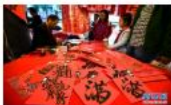
台北：作真大燈作真燈