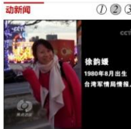
《焦点访谈》 危情谍影(下)