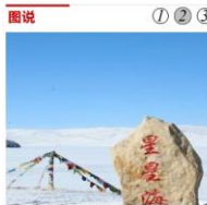
海拔4000米以上的守望