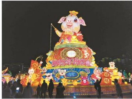
图为灯会现场。

第九届“江苏·台湾灯会”26日晚在常州环球恐龙城启幕亮灯，2019常州灯会同步启动。