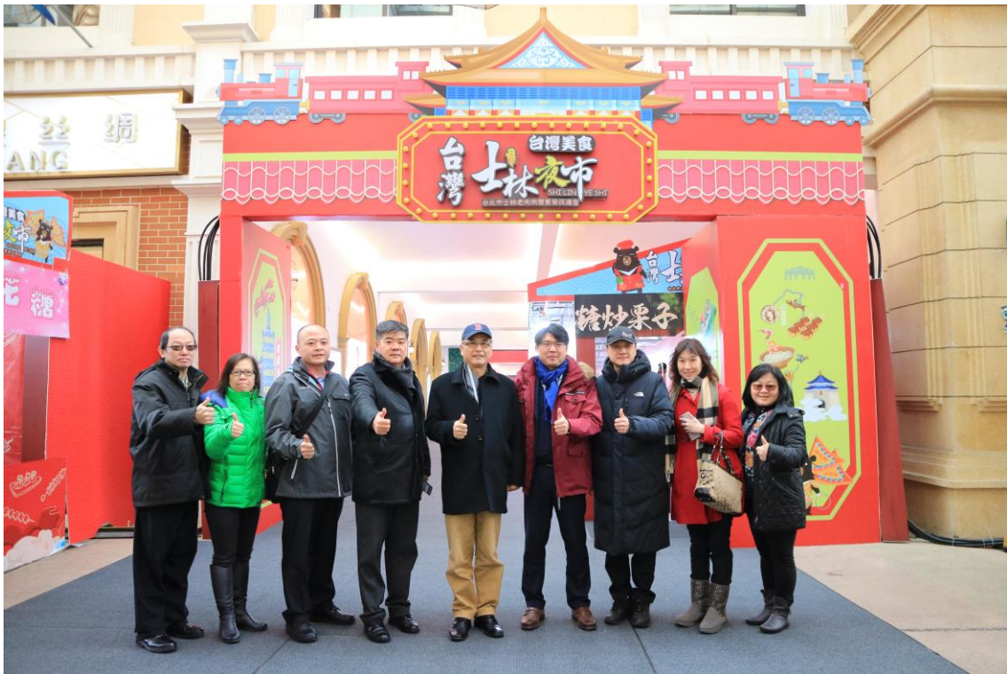
2019 臺灣江蘇燈會士林夜市美食街