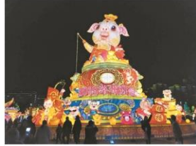
图为灯会现场。

中国江苏网1月28日讯 第九届“江苏台湾灯会”26日晚在常州环球恐龙城启幕亮灯，2019常州灯会同步启动。