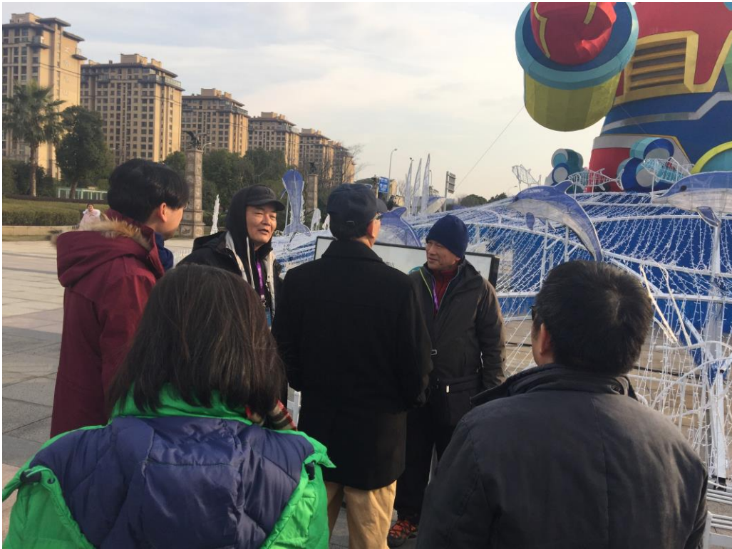
2019 臺灣江蘇燈會主燈檢視作業