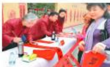
兩岸暨港澳澳門警“區”已持續5年