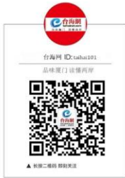
标签: 金猪灯会 江苏·台湾灯会 责任编辑: 台湾

灯会拍客大赛、少儿手绘灯笼大赛、元宵音乐会……,记者了解到,整个灯会期间,二十余场免费人气活动将在环球恐龙城璀璨夺目亮相,常州的文化魅力将以这些活动为“媒”,传递到海峡两岸乃至世界各地。