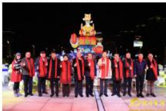
2019台灣江蘇交流燈會在常州亮燈。

你好台灣網1月27日消息（記者 楊萍）1月26日晚，2019台灣江蘇交流燈會在江蘇常州沙壩城道橋水鎮廣場舉辦。本屆台灣江蘇交流燈會在兩岸業界合作推動下，交流燈區再次邀請知名的台灣士林夜市團隊進駐，讓真燈與真景有機融於行前、炸雞排、臭豆腐、花枝丸、薑王薯條、珍珠奶茶等台灣小吃的魅力。