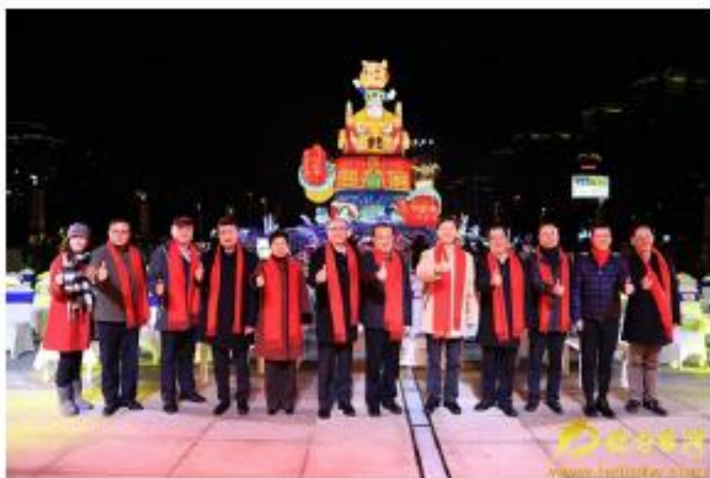
2019台湾江苏交流灯会在常州亮灯。

你好台湾网1月27日消息（记者 雅萍）1月26日晚，2019台湾江苏交流灯会在江苏常州恐龙城迪诺水镇广场举办，本届台湾江苏交流灯会在两岸业界合作推动下，交流灯区再次邀请知名的台湾士林夜市团队进驻，让赏灯民众亲身体验蚵仔煎、炸鸡排、臭豆腐、花枝丸、霸王薯条、珍珠奶茶等等台湾小吃的魅力。