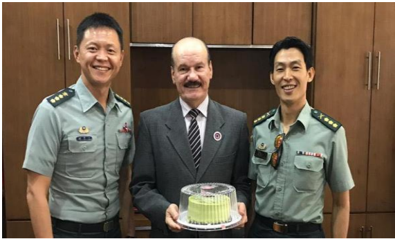
為巴國國防部長索多(Soto)將軍慶生