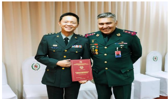
與論文指導教官合影