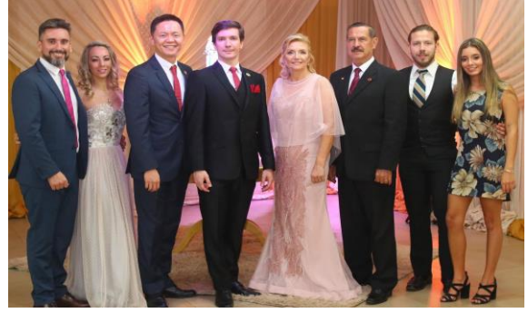
畢業酒會與同學及其家人合影