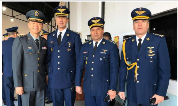
與空軍同學參加我國援贈 巴國直升機典禮