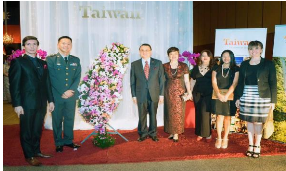
參加國慶酒會與我駐巴大使夫婦合影