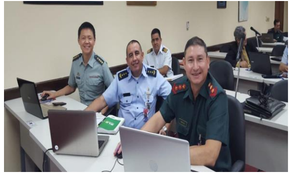
與同學實施分組作業