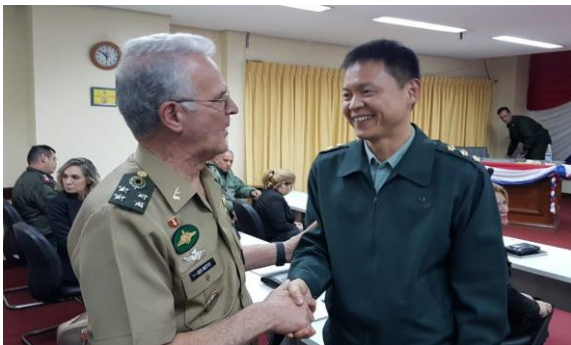
課間與巴西武官互動