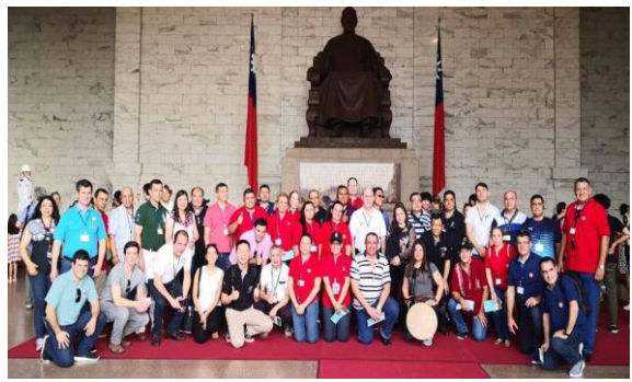
與同學參訪中正紀念堂