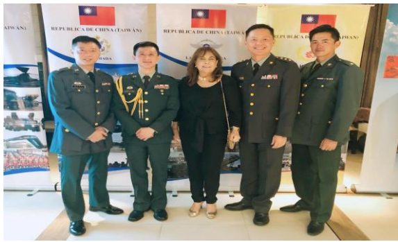
九三軍人節酒會與巴國副部長合影