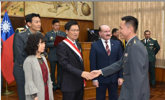
參加我國防部長於巴國受勳典禮