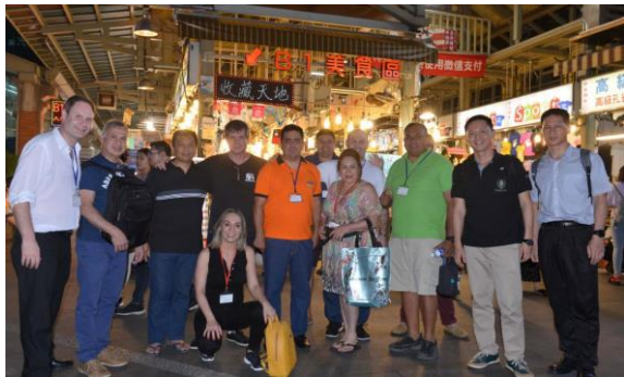
與同學遊覽士林夜市