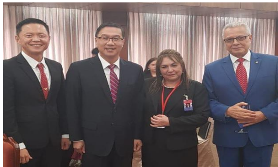
外交部午宴與次長及巴國駐華大使合影