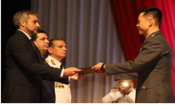
巴國總統(Abdo)親頒畢業證書