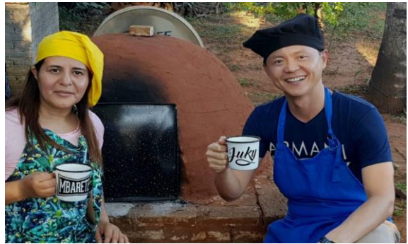
受邀至同學家中製作巴國傳統食物