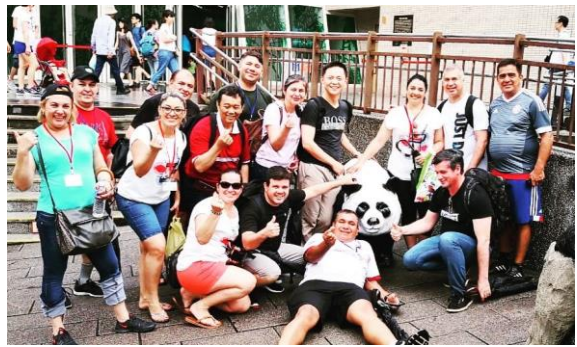
與同學遊覽木柵動物園