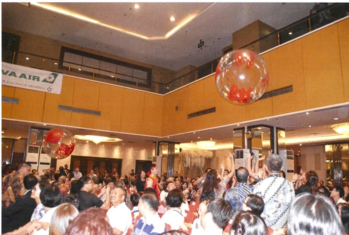
圖 11：團員在印尼雅加達場次與觀眾互動透明彩球，全場氣氛歡樂活潑。