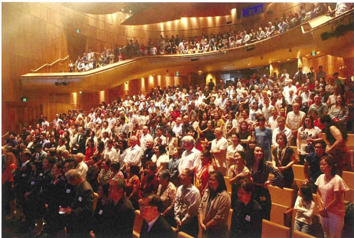
圖 13：伯斯場次全場座無虛席，為高規格演出場地。