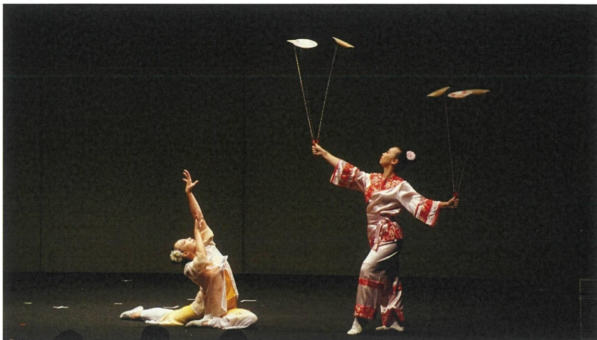
圖 1：團員在日本橫濱場次展現精湛的舞蹈及轉盤技巧。