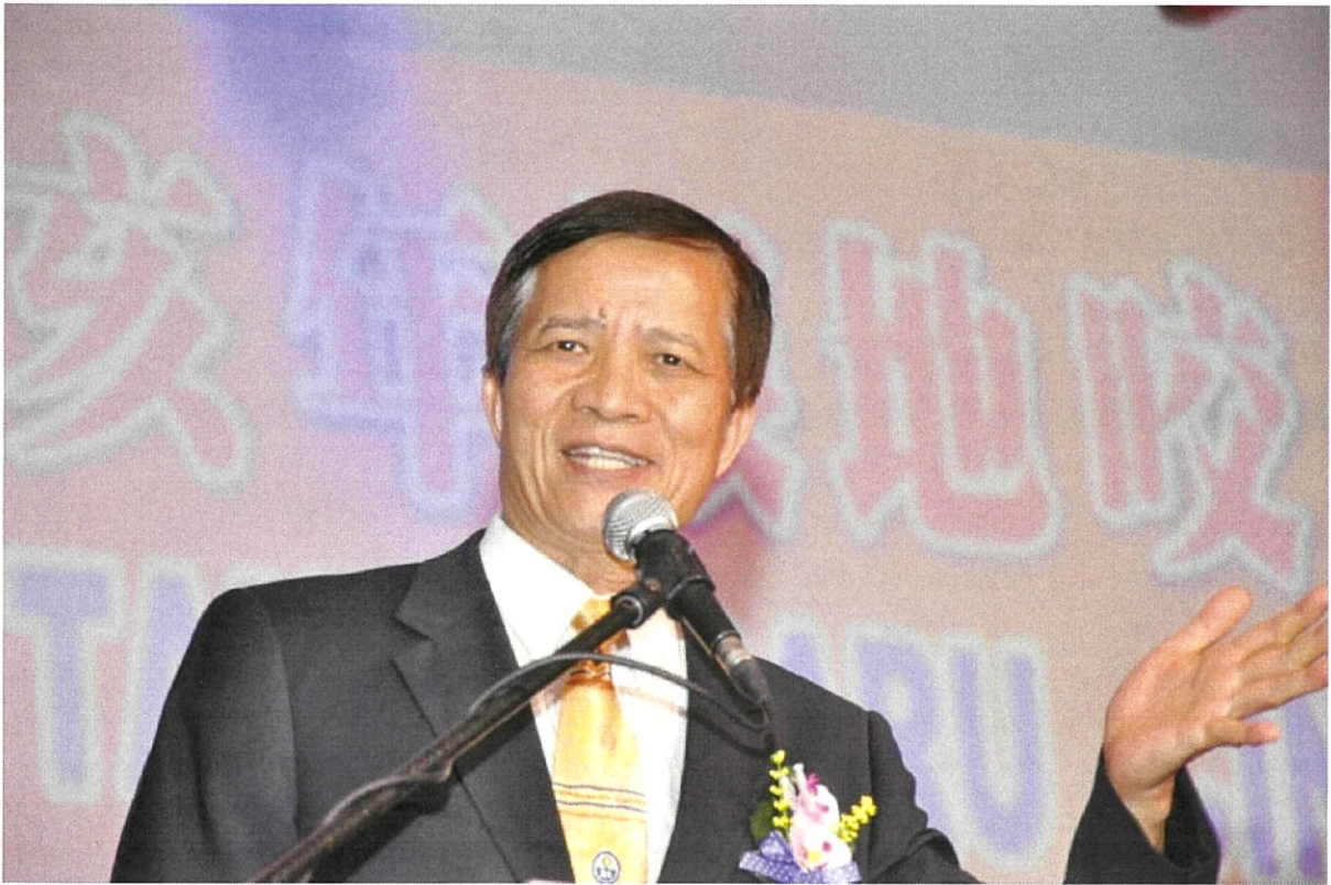
圖 7：高副委員長致詞。