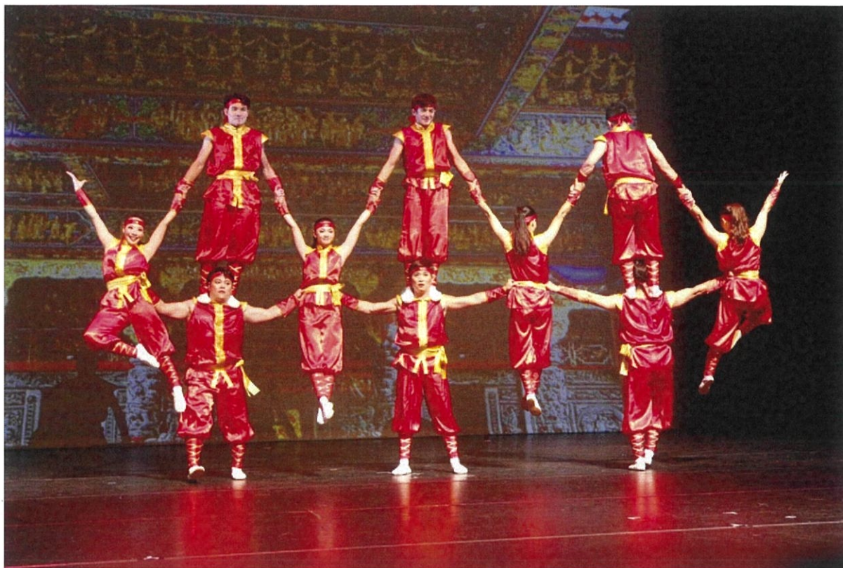
圖 9：團員在馬來西亞新山場次表演疊羅漢技巧，全場觀眾反應熱烈。