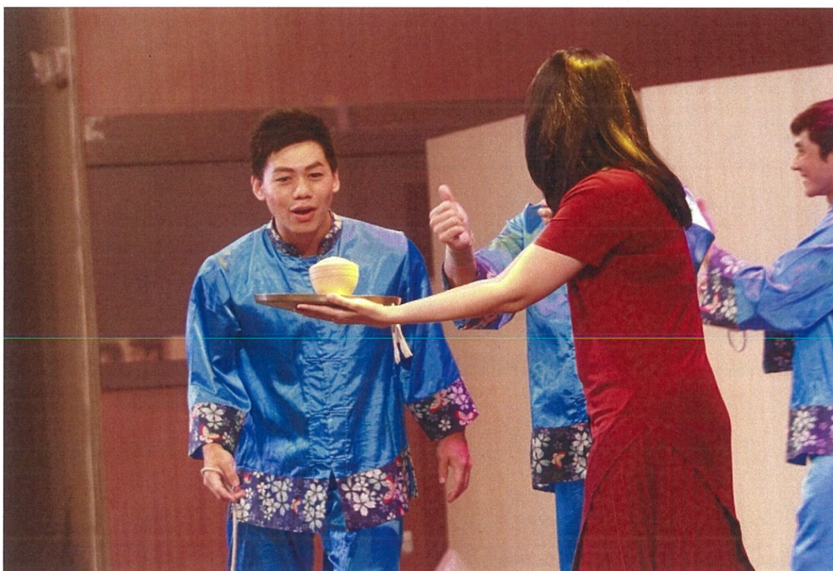
圖 10：團員在印尼棉蘭場次邀請觀眾上臺互動打陀螺，廣受觀眾好評。