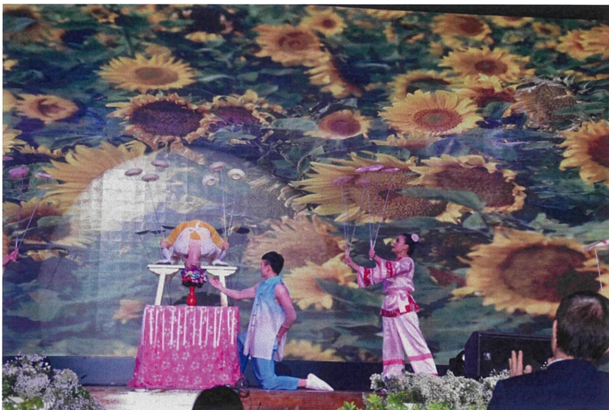
圖 5：團員在越南海防場次展現出色的軟骨功及轉盤技巧，贏得全場觀眾喝采。