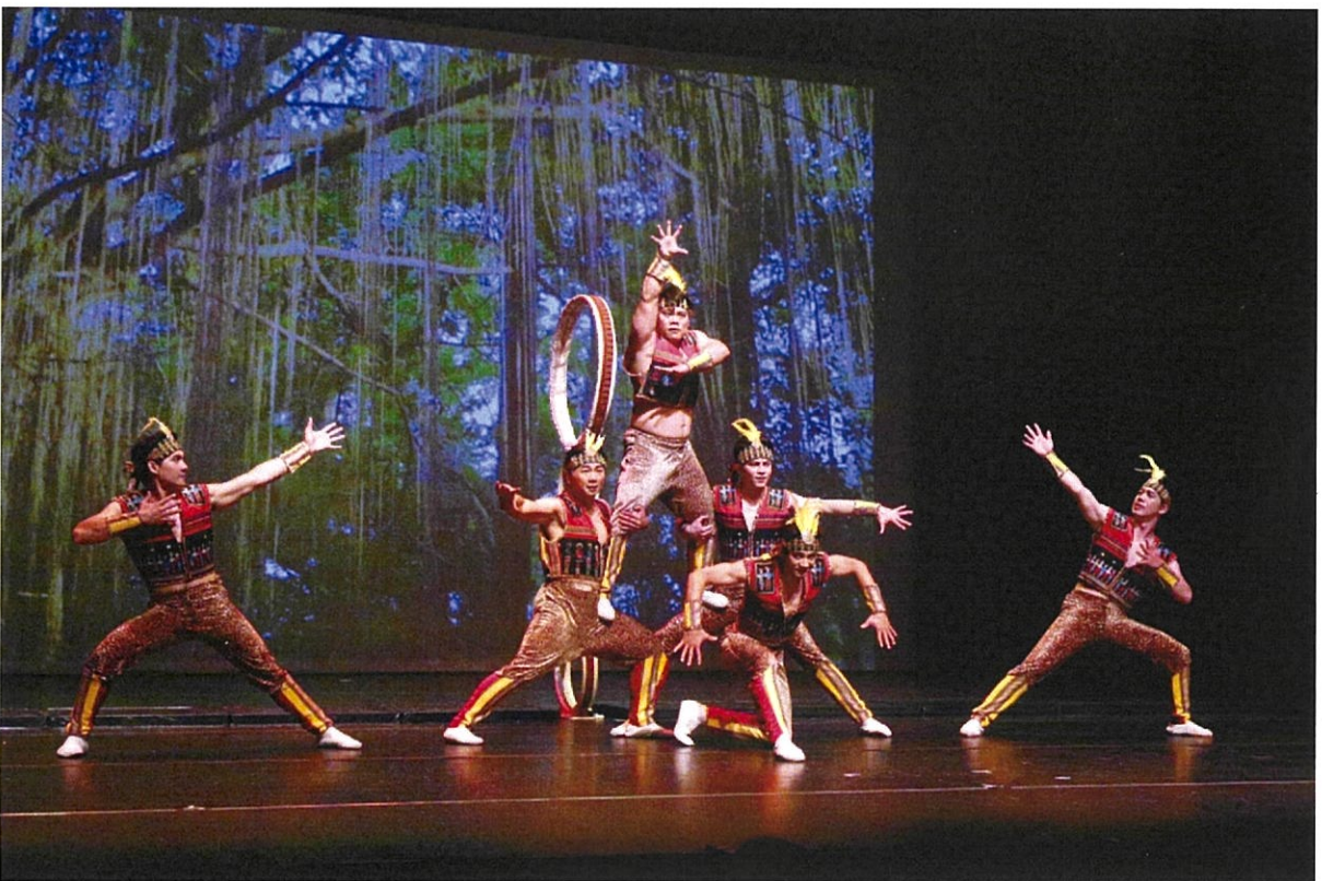
圖 8：團員在馬來西亞亞庇場次呈現富含原住民元素的地圈表演，全場觀眾連連叫好。