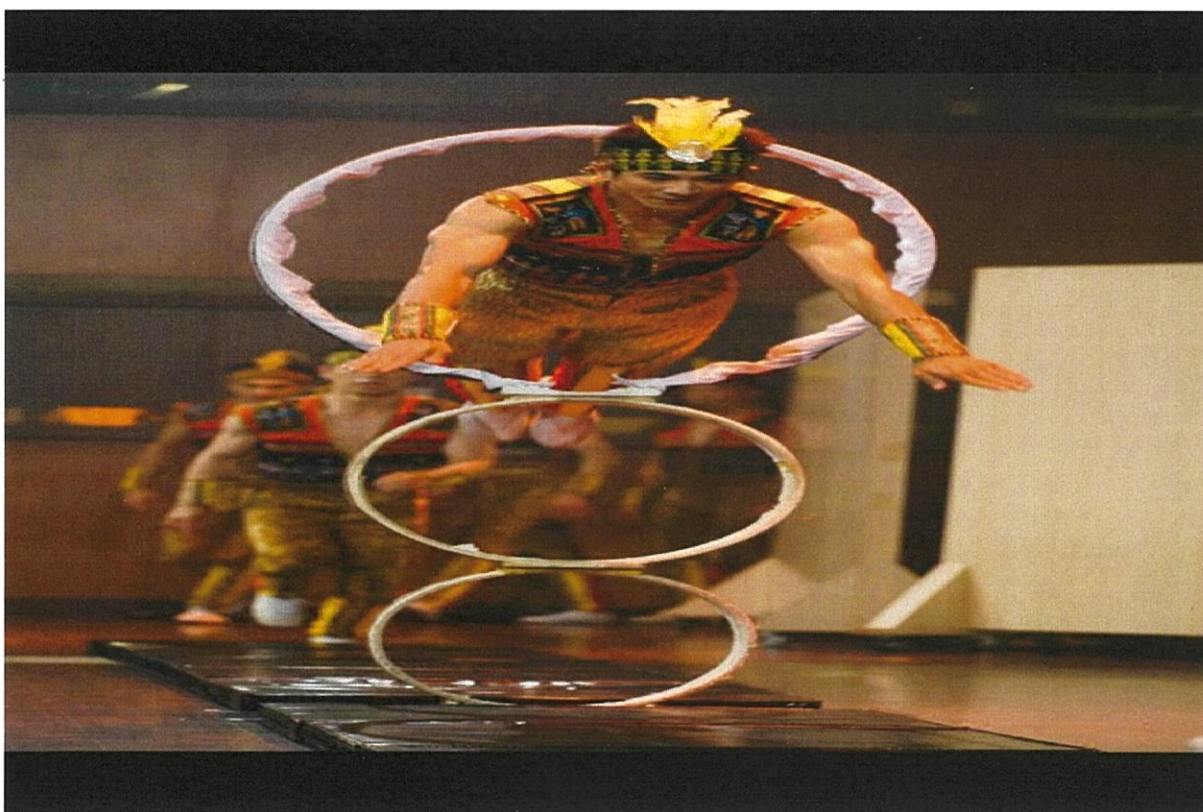
圖 4：團員在柬埔寨金邊場次展現優異的地圈技巧。