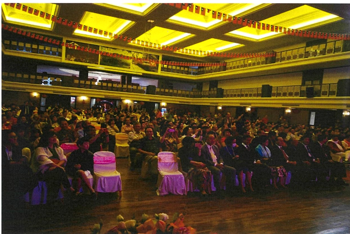
圖 3：泰國曼谷場次全場 800 位觀眾專注欣賞訪團演出，給予訪團演出高度評價。