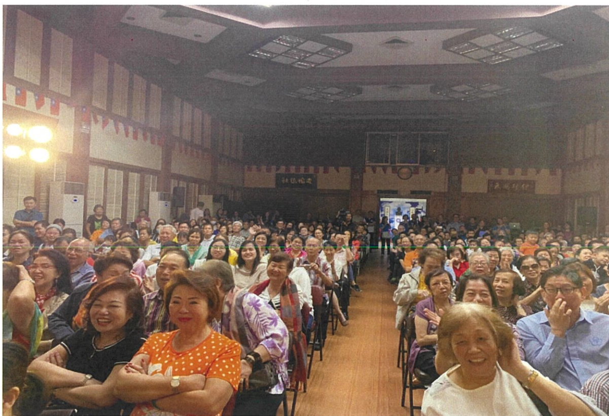
圖 2：菲律賓馬尼拉場次全場 800 位觀眾座無虛席，氣氛歡樂。