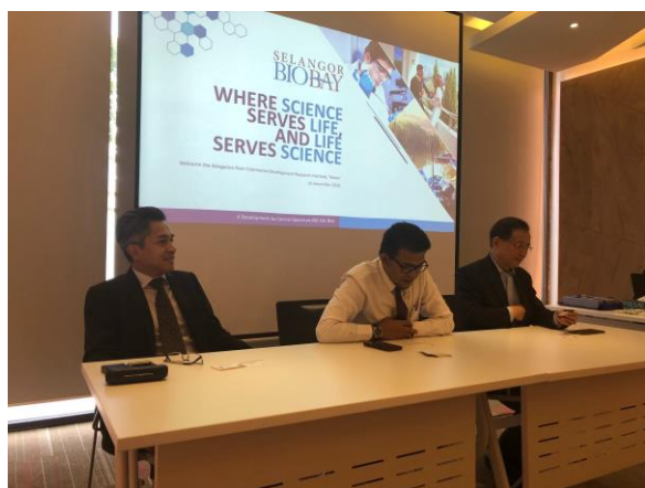
參訪雪蘭莪州清真中心（Selangor Halal Hub），由該中心主管接待。