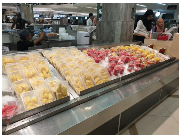
超市內特設置截切蔬果區，販售多樣化搭配的水果盒。