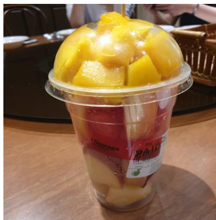
水果盒售價並不便宜，一盒售價為 12.9 馬幣 (折合台幣約 100 元)。