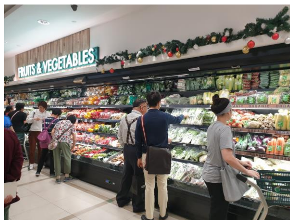
Cold Storage 超市內陳列大量國產或來自世界各地的生鮮蔬果。