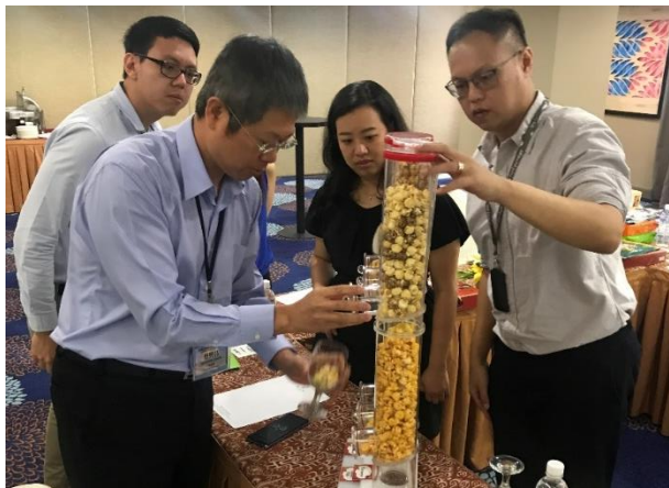
為爭取買主青睞，業者自臺灣帶來公司產品及型錄現場陳列擺設，並詳細說明產品特色。