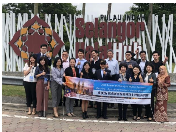
交流會後進行園區參訪，離開前於雪蘭莪州清真中心入口處大合照。