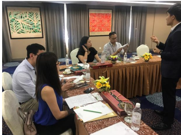
媒合會現場臺灣廠商與買主交談熱絡，如有採購意願即現場報價。