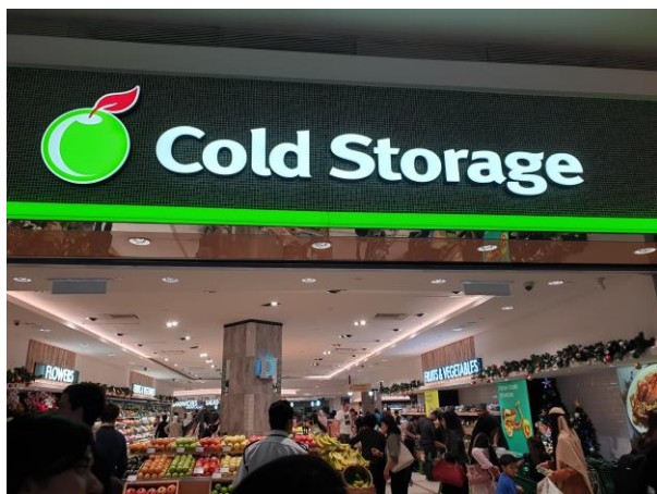
參訪位於馬來西亞 KLCC 內的高檔超市 -Cold Storage。