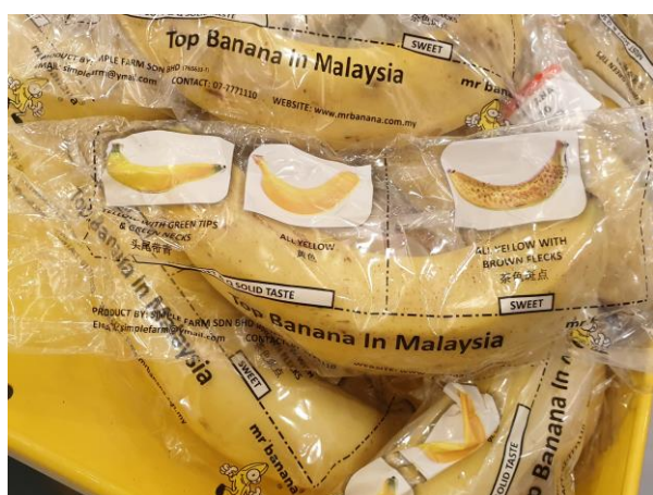
結帳區另販售單根香蕉(產地：馬來西亞)，並在外包裝上印製圖說，教導消費者不同外觀的風味差異，具茶色斑點最甜最美味，售價 1 根 1.3 馬幣(折合台幣約 10.4 元)。