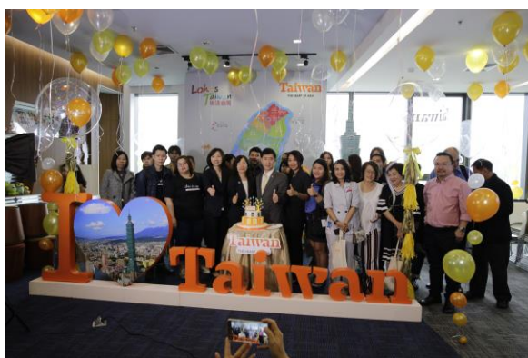
出席慶生會貴賓合影