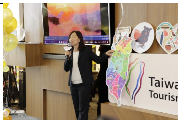
莊副處長介紹阿里山茶席體驗