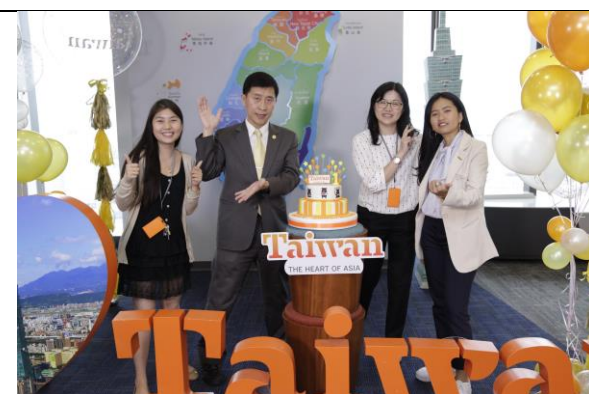
曼谷據點工作團隊謝謝各界支持