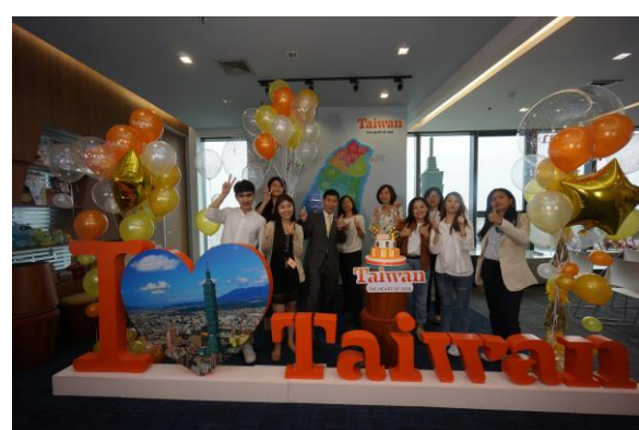
本次慶生會工作團隊合影