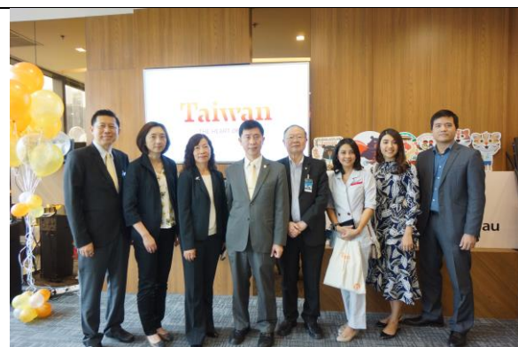
ATTA副會長、TTAA顧問、泰國信用卡公司代表、泰越捷航空總經理等貴賓出席