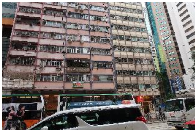
富德樓（右側）為灣仔市中心商業大樓。