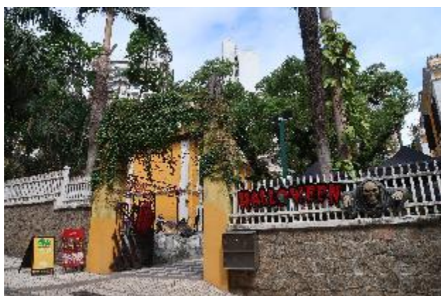
婆仔屋現在作為文創空間，搭配萬聖節主題進行鬼怪裝飾，別有一番滋味。

同時，婆仔屋見證了近代澳門面對癲瘋病的歷史過往，恰與台灣「樂生療養院」的院區保留歷程相似，可作為兩地癲瘋病社會史的相互參照；盧家大屋則是以嶺南粵式傳統大屋為基礎，在建築美學上揉合了洋式手法，又保留中式傳統建築特色，讓人一窺豪門深院的面貌。沿途所見之教堂，幾乎仍持續作為宗教使用，而舊法院大樓則將轉為澳門中央圖書館之用。