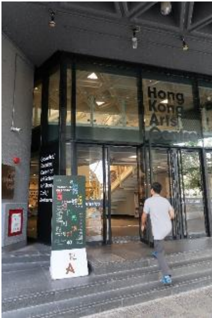
藝術中心位於灣仔精華區。