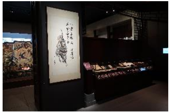
金庸館以靜態文物展出為主。

小型展覽室，展出武俠小說大師金庸筆下作品的人物形象、武俠世界與改編影視等，藉由這些作品認識作家金庸（本名查良鏞）的文學世界。以該館的定位與規模，於一樓展場設立此常設展館，充分顯示金庸作為香港作家，乃至華人文壇中的重量級地位，其作品橫跨文學創作與流行文化，影響力及於整個華人世界。我們到訪後的隔天，10月30日金庸辭世，大批金庸迷來到此處排隊弔唁，該館於是成為香港人追思一代大師的弔唁之處。