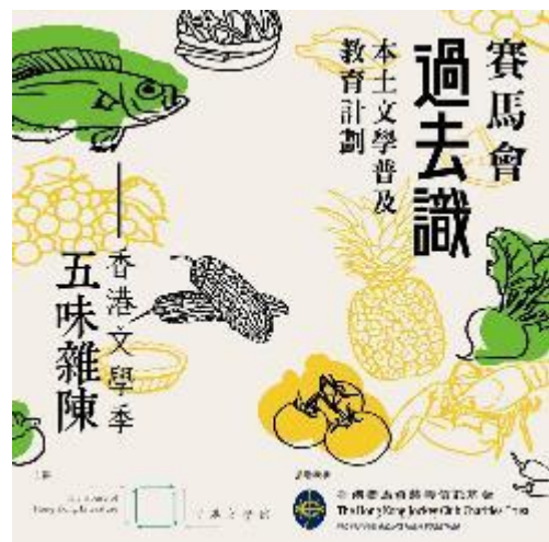
「香港文學季——五味雜陳」系列講座，由香港文學館與光華新聞文化中心合辦，邀請台港作家進行對談，即是一次成功的合作計畫。