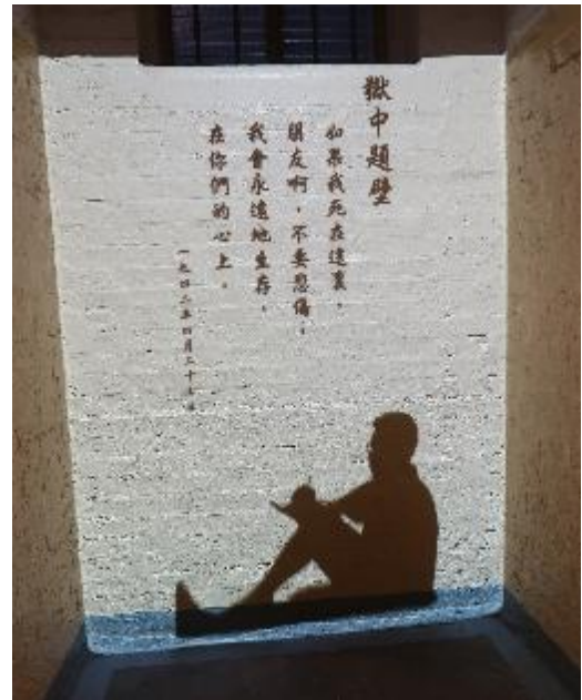
牢房內有戴望舒知名詩作〈獄中題壁〉。

場。令參觀者印象深刻的是原牢房空間，狹小牢房內以投影等多元方式，還原囚犯拘禁其中的樣貌，讓參觀者親身體驗不同狀態下的囚禁面貌，如獄中伙食、起居方式、精神狀態、越獄行動等，呈現獨特的監獄文化。同時，也呈現獄中文學表現，選錄