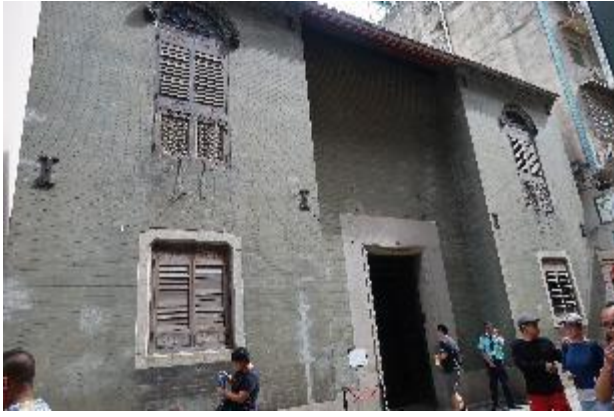
盧家大屋為嶺南建築代表，內部保存良好。