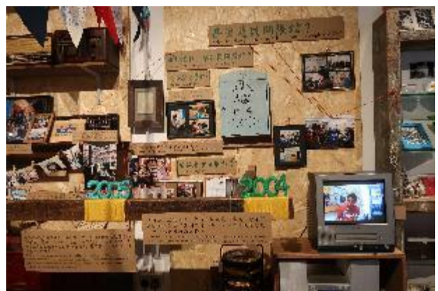
藍屋本身即是一次策展及公民參與行動。