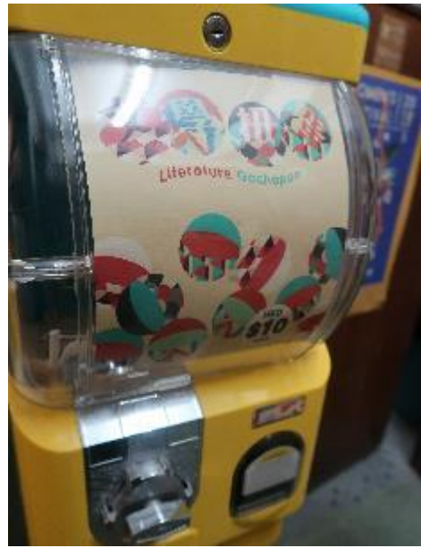
設於門口的「文學扭蛋」機，創造文學趣味性，還能增加小額收入。

香港作為商業掛帥的城市，文化藝術本就不易生存，遑論文學志業，但香港文學生活館卻無畏挑戰，以各種計畫、專案及申請補助等方式維繫運作，具有高度活力與彈性，也積極連結各單位、各種藝術領域共同奮鬥。現階段本館雖與該館沒有合作計畫，但可評估未來共同策劃台港作家講座、互寫或其他形式之活動，對於在香港推動台灣文學，可收事半功倍之效。