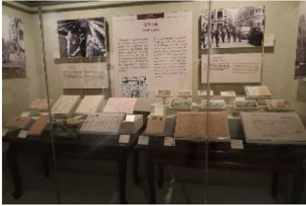
展場文物陳設眾多但擁擠。