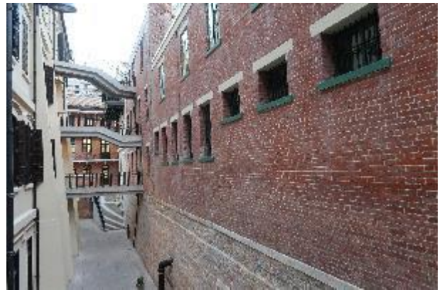
大館由多處監獄倉房組成。