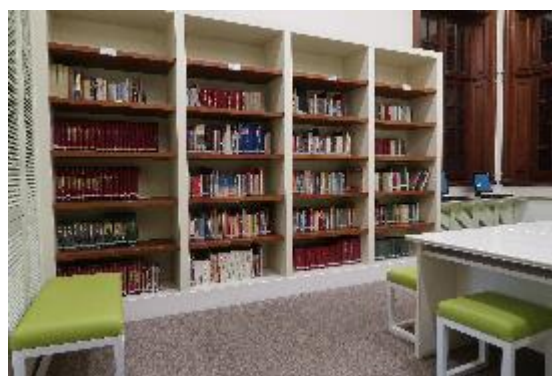
閱覽室放置許多孫中山與民國史書籍。

紀念館二樓設有閱覽室，放置有關孫中山或民國史的研究、傳記等相關書籍，包含香港本地及臺灣、中國所出版之圖書刊物，並列呈現不同政治觀點下的孫中山觀點，並不偏重單一史觀，在今日香港政治局勢中顯得格外不易。