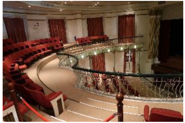
崗頂劇院至今仍作為音樂劇場之用。

一言以蔽之，澳門歷史城區因納入世界文化遺產，獲得相當程度的保存維護，也深受世界各地遊客喜愛，大三八牌坊甚至成為澳門必訪景點；然而更為難得的，這些建築、歷史遺跡，多數仍保持如常使用的狀態，歷經時間淘洗，仍舊以原有樣貌呈現，或善加保存維護，而非轉做其他用途致使原有面貌遭破壞。這或許與澳門本地的商業性格較弱有關，人們長久以來習與這樣的文化環境共存，也少了土地開發、大規模建設等誘因；然而隨著搏彩業在澳門勢力日趨龐大，歷史文化與賭場文化兩相衝突的情形也越來越激烈，未來澳門歷史城區是否受到影響，世人都在關注。