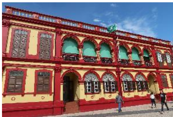
澳門中央圖書館外觀。