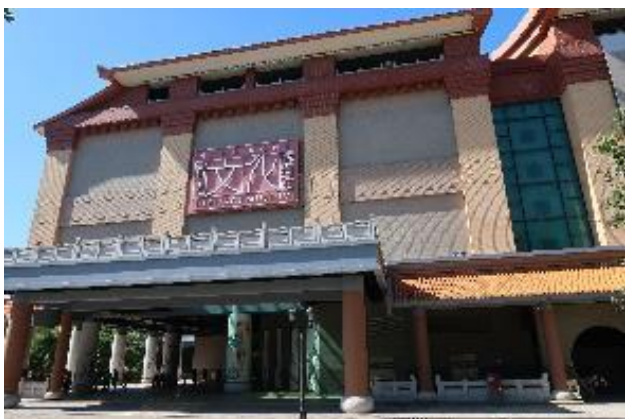
香港文化博物館外觀。

香港文化博物館成立於 2000 年 12 月，位於新界沙田地區，隸屬香港特區政府民政局轄下的康樂及文化事務署，是香港目前最大型的文化類博物館，涉有 6 個常設展覽館及 6 個專題展覽館，可同時舉辦多檔次的文化性展覽；並有活動室、劇院、禮品商店及兒童活動室（探知館）等，是展覽、活動能量非常可觀的一處博物館。除特殊展覽外，均免費對外開放。同時，亦有「香港鐵路博物館」、「三棟屋博物館」及「上窰民俗文物館」三處分館。