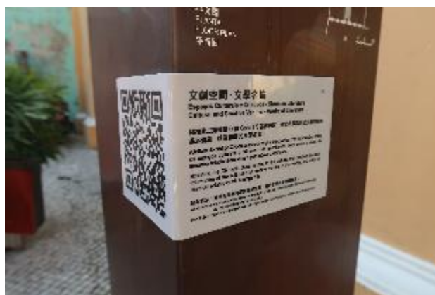
歷史城區內有許多關於文學地景的 QR CODE 連結，供參觀者進一步認識。