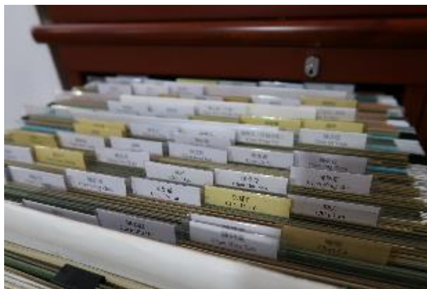
盧瑋鑾教授的香港文學研究檔案。