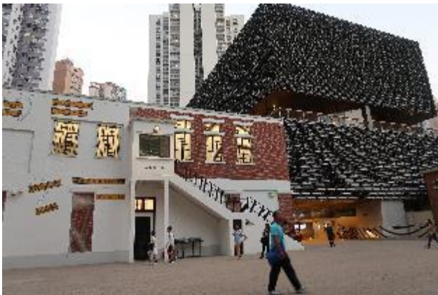
賽馬會藝方（右方黑色建築）為新建空間，提供當代藝術展演場地。