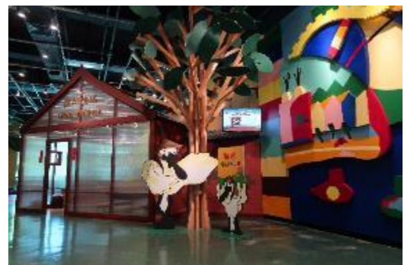
兒童探知館為大型裝置之體驗空間。