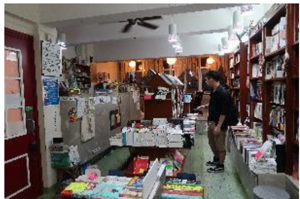
序言書室雖狹小且位處高樓，仍具備強烈的獨立人文精神。