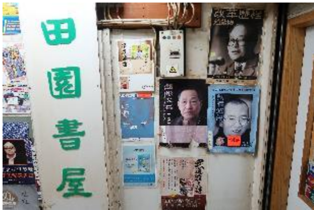
田園書屋有大量台版書刊與政治書籍。

序言書室則成了「七樓書店」，必須通過搖晃老舊的電梯才能到達，書店空間亦狹窄，依政治、經濟、哲學、中國研究、…等各類主題擺放書籍，毫不避諱諸如香港獨立等敏感書籍；店內充滿社會議題、香港本地文學與哲學思辯書籍，也販售香港獨立出版的小刊物或詩集，舉辦講座、讀書會，呈現出強烈的獨立精神，頗近似於臺灣「唐山書店」的風格，逐漸成為香港獨立書店的代表店之一。