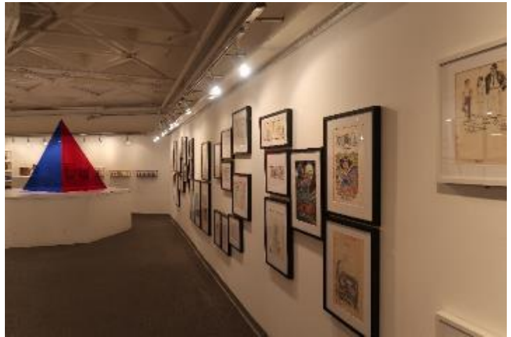
「阿推的漫畫——捉迷藏」特展。

推之作品。展覽不只呈現阿推的繪畫作品，也結合跨領域題材如文學、視覺藝術、玩具公仔、商品設計等，使該展覽不只是靜態的文物圖像，顯現出藝術家多面向的創作風格。展覽也安排阿推本人與香港藝術家歐陽應霽舉辦對談，及阿推本人示範即席創作，活動推出即快速額滿。