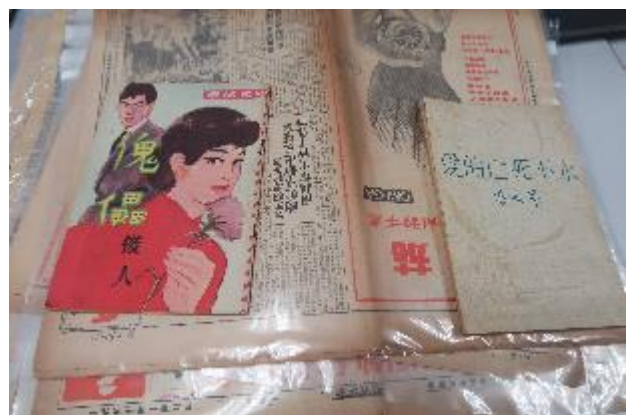
「三毫子小說」各式刊本與剪報。