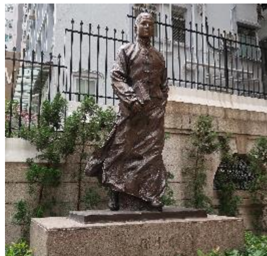
紀念館門口的孫中山銅像，是以其青年時期為樣貌。

除了靜態文物呈現孫中山與近代史的一般性主題，該紀念館特別強調香港在近代中國中的特殊地位，這除了根源於孫中山與香港的緊密意義，該館似乎也特別提出此一命題：19世紀末期的香港，為何可以塑造出如孫中山這樣引領思潮的人物？19世紀的香港，無論在政經制度、市政建設、衛生醫療，甚至接受現代思潮的程度，均領先中國甚多，同時香港更是一個東西文化交匯點，也是近代中國現代教育的一扇窗口。因此，該館特別著重呈現香港在上述時代意義的重要角色，也是根基於上述條件，足以培育諸如孫中山這樣的新時代青年，也鼓動並支撐著革命運動的推動。在紀念館大門口所設置的孫中山銅像，是以手持書卷的朝氣青年為形象，正足以說明該館的設立宗旨，並藉以區隔各地孫中山紀念館所，乃因香港正是孫中山之所以成為近代中國重要人物的基礎。