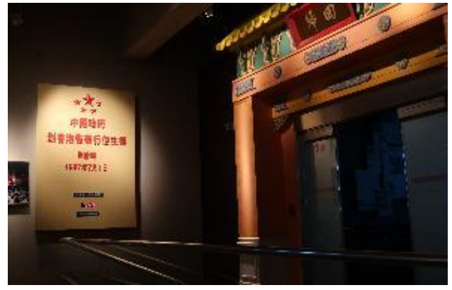
最後以「回歸倒數計時器」呈現政治意圖。

該館以香港歷史發展為主要內容，通過「香港故事」常設展加以詮釋呈現，展場佔地廣大，並分為1樓與3樓兩層，呈現出相當可觀的展示量。全展以自然生態與史前時代為起點，以時間發展為軸線，依序呈現不同時代下香港歷史發展的各式主題，包含「自然生態環境」、「史前時期」、「從漢到清朝」、「香港的民俗」、「鴉片戰爭及香港割讓」、「香港開埠及早年發展」、「日佔時期」、「現代都市及香港回歸」等8展區。嚴格來說，從「鴉片戰爭及香港割讓」開始，才是比較嚴謹的歷史發展陳述，這與英國統治後香港走入世界史的脈絡息息相關。展區最終呈現1997年香港主權移交前後的各種社會面貌與歷史文件，並側重中國統一觀點的詮釋。