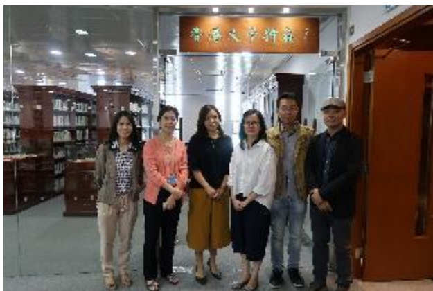
於香港文學特藏室外合影。

中文大學為香港首屈一指的學術機構之一，其中文系亦為香港文學研究重鎮，2001年盧瑋鑾教授（作家小思）將其蒐集之香港文學史料、文獻、書籍、研究資料等捐贈給中文大學圖書館設立「香港文學特藏室」，並以此為基礎成立「香港文學研究中心」，作為香港文學史料蒐集與研究、出版、推廣單位，架設香港文學資料庫網站，接受作家捐贈，舉辦作家展覽，並舉辦學術會議與文學推廣活動，可說具備了一個文學博物館的功能。香港文學研究中心是以大學學術研究為基礎的單位，兼具典藏與推廣功能，位於中大圖書館內的特藏室，陳列了超過3萬本香港作家作品，也典藏作家手稿，並以「作家文庫」的方式將香港作家著作完整呈現，對研究香港作家的人而言，非常清楚且方便。