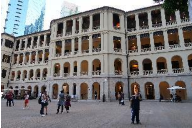
營房大樓及檢閱廣場建於 1860 年代。