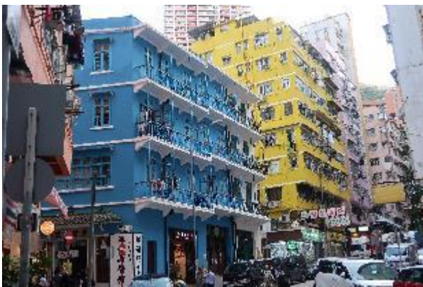
藍屋外觀，其後是黃屋及橙屋。

在藍屋內所設置的小型展示中，外地人如我們，亦可快速理解香港庶民生活起居與傳統社區的狀態，工作人員亦如同街坊鄰居般，對我們熱情招呼並話家常，在繁忙的香港街道裡，顯得格外親切。