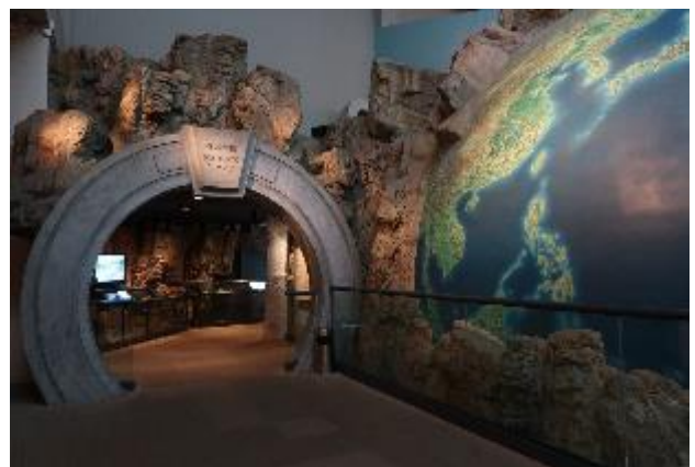
展場入口以遙遠的史前時代開始。