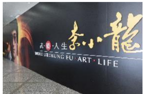
李小龍展以常設展規格來策辦。 （館內無法拍攝）

「武·藝·人生——李小龍」雖為特展，但自2013年7月20日（即逝世40周年紀念日）開展以來，並未設立卸展日期，我們參觀之日非假日，卻仍有為數眾