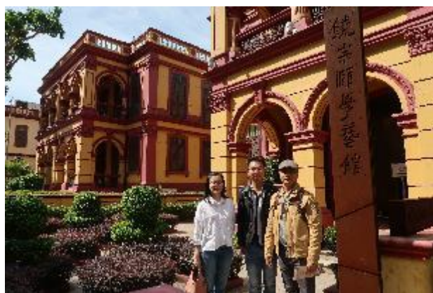
饒宗頤學藝館外觀，後方建築即為澳門文學館預定館址。