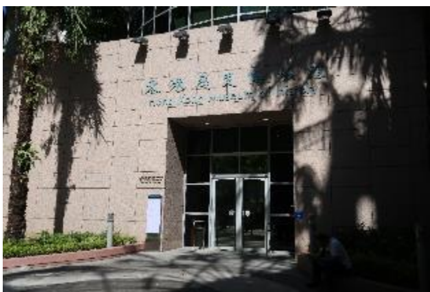
香港歷史博物館外觀。

香港歷史博物館位於九龍紅磡，前身為 1975 年設立之「香港博物館」，1998 年遷移至現址並更名為「香港歷史博物館」，緊鄰香港科學教育館，同樣隸屬於特區政府康文署，並設有五處分館。主要展場為常設展「香港故事」，並不定期舉辦中小型特展，除特殊展覽外，全館免費對外開放。