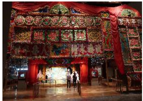
粵劇文物館搭設了大型舞台場景。

「粵劇文物館」是以廣東地方戲曲「粵劇」為展示主題，打造大型戲臺、布幕場景與後台空間，真實還原粵劇演出的場景和時空環境，同時陳列戲服、道具、節目飾品、節目單、劇照等相關文物。該展館面積頗大，並且目測挑高超過五公尺，才能於此搭設竹棚舞台，呈現鄉間野台戲碼的量體與氣勢。粵劇在香港社會的地位崇高，但與許多傳統戲曲一樣面臨現代社會的挑戰，戲團與觀眾老化，也不敵當代流行娛樂的競爭，然而此一危機也促使粵劇進行變革，重新致力融入庶民生活。這些歷程都在此展館內可以看見，因此「粵劇文物館」不僅只是一處懷舊的文物陳列展，也是該館企圖串聯傳統與現代的表現，而使博物館不只成為已逝文化的靜態展示，也具備有促進文化對話的積極功能。