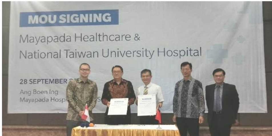
臺大醫院與 Mayapada Healthcare Group 簽署交流合作備忘錄儀式