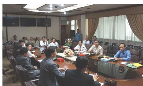
Harapan Kita 國家心臟醫院醫療主 管皆出席與會，並討論未來合作