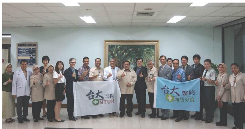
臺大醫療體系團隊與 Harapan Kita 國家心臟醫院醫療主管合影留念