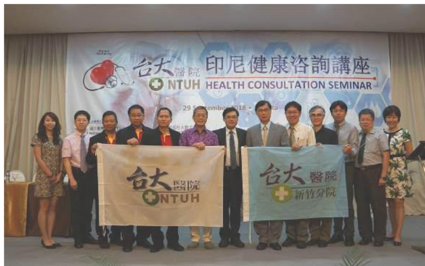
臺大體系醫療團隊與 印尼台大校友會人員合影