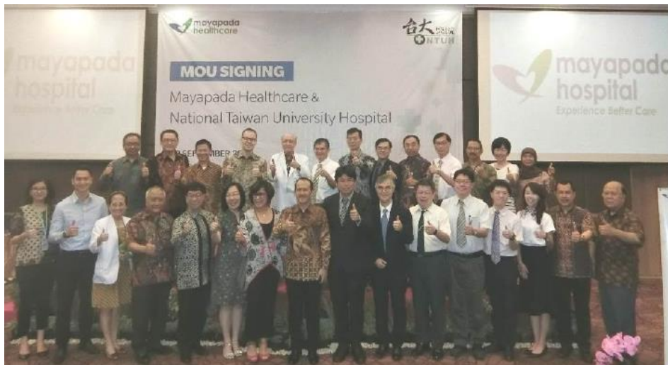
簽署儀式後雙方代表合影