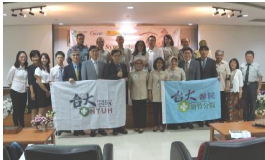
臺大醫療體系團隊與 RSCM 團隊合影