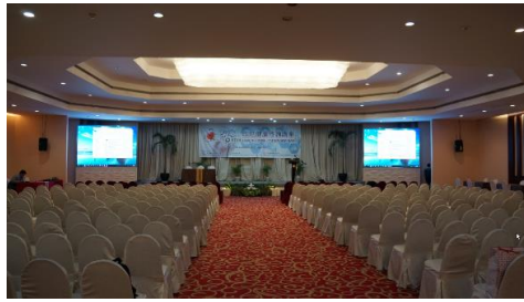
健康諮詢講座會場