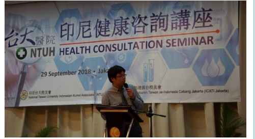
商之器科技股份有限公司 在會場設攤狀況