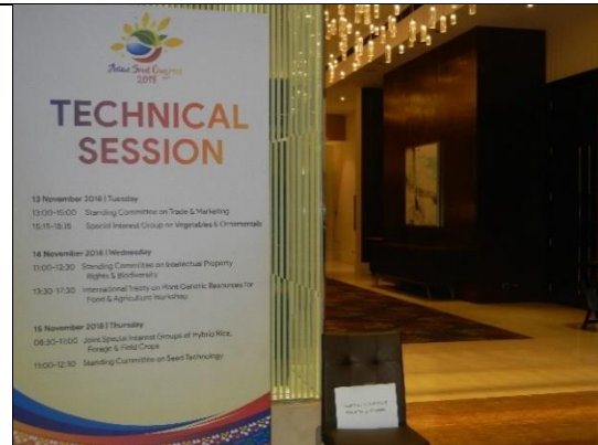
亞太種子年會技術會議場地