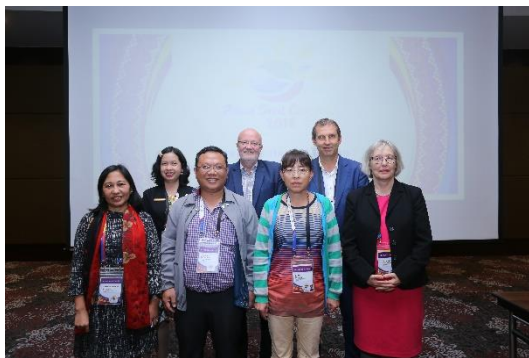
本小組研討會主席與講者合照