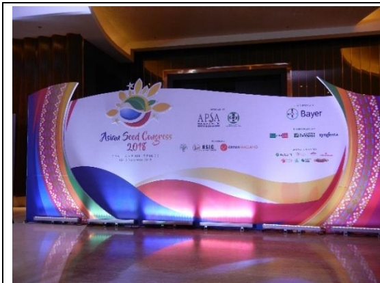
亞太種子年會會場看板