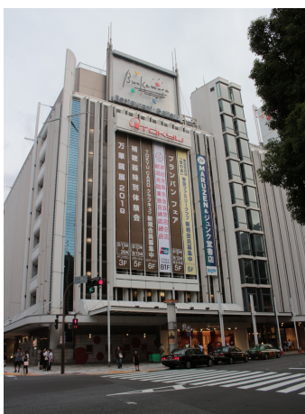
圖 15、東急百貨及文化村外觀

該設施位於繁華的澀谷地區，若經妥善安排，或可成為本院文物一種新型態的展示設定區域。不過筆者到訪時，Bunkamura 正在進行全館整修，可期待其落成後的新樣貌。