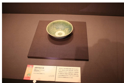
圖 9、特展陶瓷文物與為因應特展所設計的文物名卡