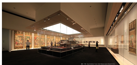
圖 14、台德院殿靈廟模型於增上寺寶物館內展示之情況。