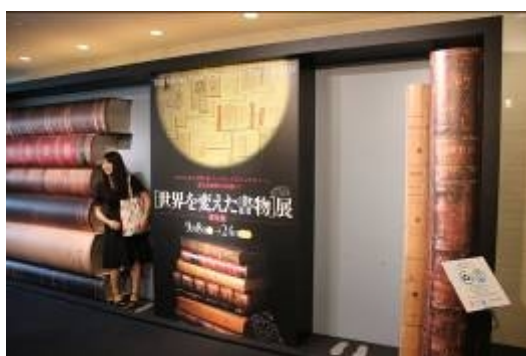
圖 11、「改變世界的圖書」特展形象牆與造景

善本文獻類的書籍，因為受限於外型，往往展示有相當的侷限。此一特展先是在一樓設置「知識之牆」，訪希臘知識庫式的壯觀書牆，強烈吸引了參觀者的目光。一樓的第二展區，及二樓，則設定為「知識森林」，各挑選解析幾何、力學、光、飛行、電磁、原子、核能、無線、電話等各領域的代表性書籍陳列，搭配反射鏡，讓參觀者可以同時觀覽書籍內容及封面。即便不懂書上所載的各種外國文字，仍能透過珍貴的西洋善本，直接傳遞給讓民眾感受知識的魅力。而參觀此展之際，現場遊客絡繹不覺，可知即便是生冷的領域，透過佳良的展示設計手法以及策展人對於議題的設定，