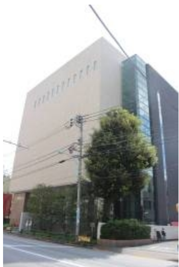
圖 1、東洋文庫建築外觀

里森文庫內關於 19 晚期至 20 世紀初的相關報告，以觀當時國際上對於臺灣地位的討論。此外，亦陸續廣泛地提借有關 17 世紀東亞地區的活動報告與文獻、清代的閩臺方志、20 世紀的日本調查報告等，對於研究獲益良多。