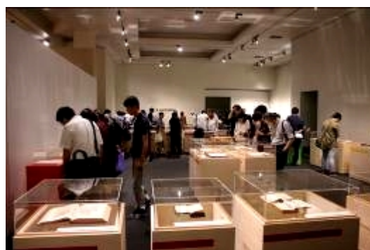
圖 12、展場內以獨立展台為主，呈現每一本珍本書的價值感。展場內並吸引了諸多遊客。