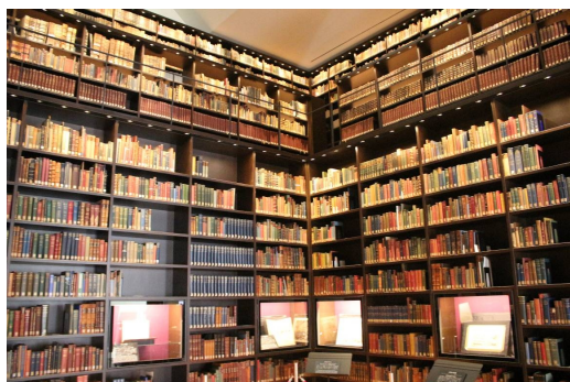
圖 3、東洋文庫博物館內壯觀的「莫里森文庫」展示書牆

次則以日本的古地圖為主。展出江戶時代製作的古地圖、古籍及伊能忠敬的測繪歷程。另以江戶（東京）為主題，展出古地圖、葛飾北齋的浮世繪、相關善本古籍，並結合互動科技及多媒體體驗，甚至進而連結至東洋文庫附近現今的樣貌，讓參觀者以更多的面向來比較、瞭解地圖沿革、發展，及當中蘊含的意義。這樣古今結合的展示方式同是臺灣多個博物館在致力的方向，甚值得借鏡。惟特展室空間有限，參觀時略有擁擠之感，但多少反映出其典藏之豐富，以致策展人難以割捨的情況。