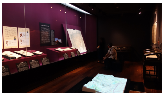
圖 6、「大♡地図展—古地図と浮世絵」展櫃與文物陳列概況