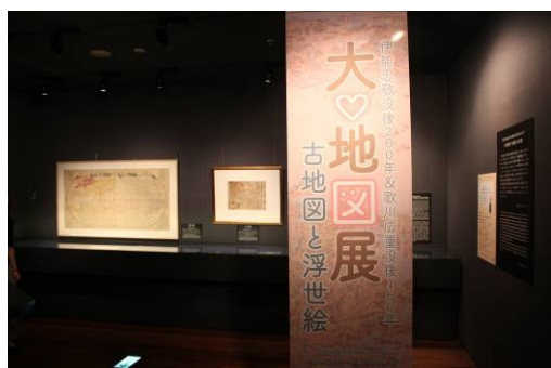
圖 5、「大♡地図展—古地図と浮世絵」展場概況