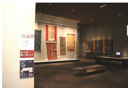
圖 10、第 13 陳列室的織品區與武器區