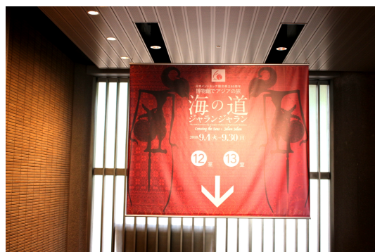
圖 8、展場內的特展帆布指標