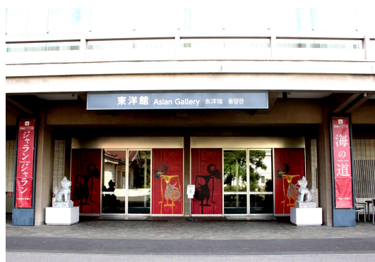
圖 7、東洋館入口處的「海の道」特展意象

「海の道」特展主要文物集中在東洋館地下一樓的第 12、13 陳列室，另於該館的其他展區內，凡是相關文物亦會逐一標示，構成一個大型展覽的概念。本院 2011 年舉辦的「精彩一百 國寶總動員」特展亦曾有類似的展覽佈局，將故宮正館的三分之一的陳列空間含括為一個大展覽的概念。「海の道」特展主要分為幾個主題，包括「岡野繁蔵コレクション—インドネシア由来の染織と陶磁器」、「ワヤン インドネシアの人形芝居」、「東南アジアの金銅像」、「インド・東南アジアの考古」、「インドネシアの染織」、「クリス—神秘なるインドネシアの武器—」等，全面性介紹印尼的宗教、民俗、考古、染織、武器等各層面的文化、工藝。並藉由有「南洋貿易王」之稱的岡野繁蔵（1894-1975）所捐贈的貿易瓷，串連日本與印尼，甚至於整個東亞海域的貿易情況。