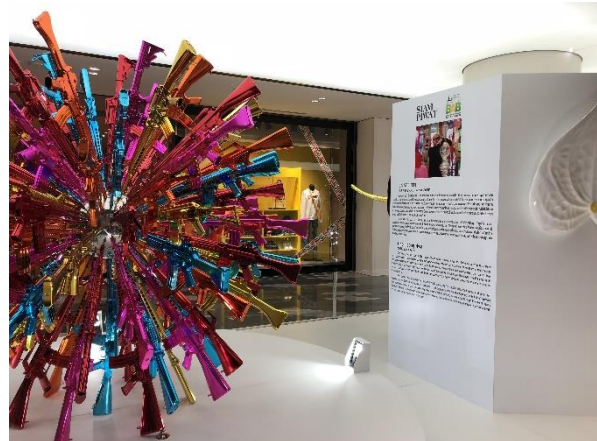
圖 1. (左) BAB 於 BACC 展區。