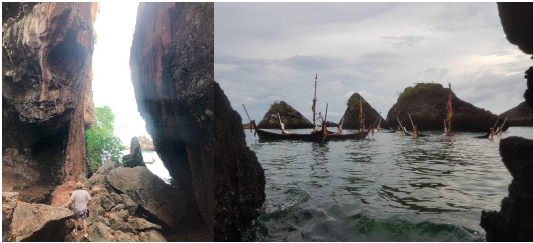
圖 25. 位於甲米 Railay Beach 一柱廟洞穴外的五角船作品