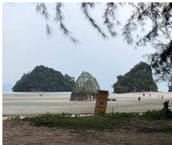
圖 21. 香港藝術團隊 Map Office 位於 Noppharat Thara Beach 的作品《Ghost Island》

位於甲米外島 Railay Beach 的 Phra Nang 岩洞，不僅是觀光熱點之一，還存有古老的民間故事，傳說 Ta Yom Dueng 家族為取得蛇神 Naga 的幫助，將女兒 Nang 許配給蛇神之子，然而 Nang 之後卻愛上了凡人 Boon，蛇神發現後大為震怒，在婚禮當天化身人類破壞結婚儀式，一位隱士出面協助未果，便下咒將眾人化作岩石，Nang 與 Boon 居住的地方幻化為今日的 Phra Nang 岩洞。藝術家深受此傳說故事吸引，在 Phra Nang 岩洞附近以泰國地方工藝技術，將神話角色塑造成 3D 形象，作品《Phra-Nang》(圖 22) 讓美、信仰、愛情故事和神話在一個結合現實與傳說的場域呈現；倫敦藝術家 Vong Phaophanit & Claire Oboussier 的作品《Gilding the Border》(圖 23) 則以 Railay