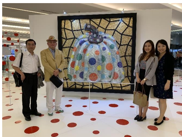
圖 6. 參觀暹羅百麗宮展區國際知名藝術家草間彌生展品。