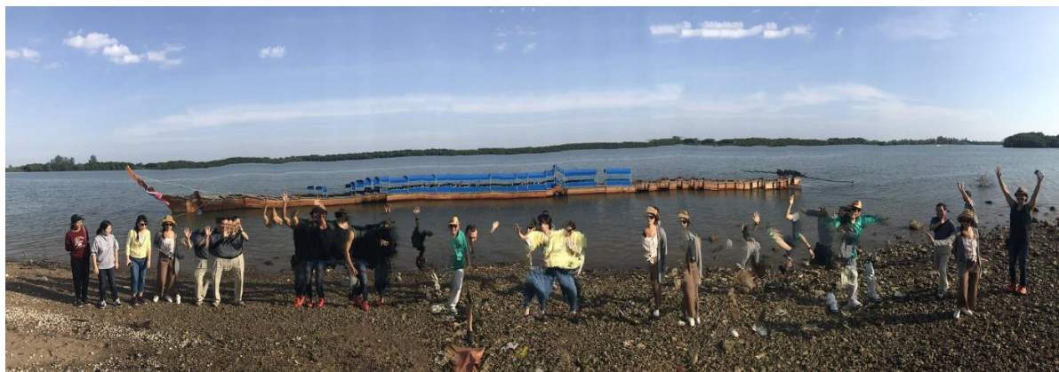
圖 13. 《過境之時 Voyage in Time》創作手法結合現代手機科技，讓觀眾可輕易與作品互動。

兩位臺灣藝術家的作品皆受到泰國文化部及甲米府高度好評，其中涂維政的作品更被摘錄進泰國文化部威拉部長在泰雙展覽專輯的序文中。而豪華朗機工的時空錯置作品表現也深受甲米當地的讚賞，協助造船的傳統師傅們表示，從未想過自己打造了一輩子的長尾船也能躍身為國際藝術品，他們很開心與臺灣藝術家在創作過程中成為好朋友。兩件作品於 11 月 2 日至 2019 年 2 月 28 日泰雙展覽期間，分別於 Khao Khanab Nam Caves 及 Thara Park 展出。11 月 3 日舉行捐贈儀式，由甲米府於現址永久典藏，當日由主管兩件作品所在的甲米府副府尹、地方區長出面接受我國藝術家進行捐贈，臺灣文化部與泰國文化部代表現場見證，是為臺泰文化合作關係之重要進展，意義非凡。