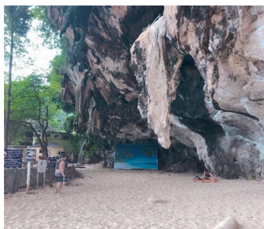
圖 22. 柏林藝術家 Aram Bartholl 位於 Railay Beach 的作品《Perfect Beach HD》。