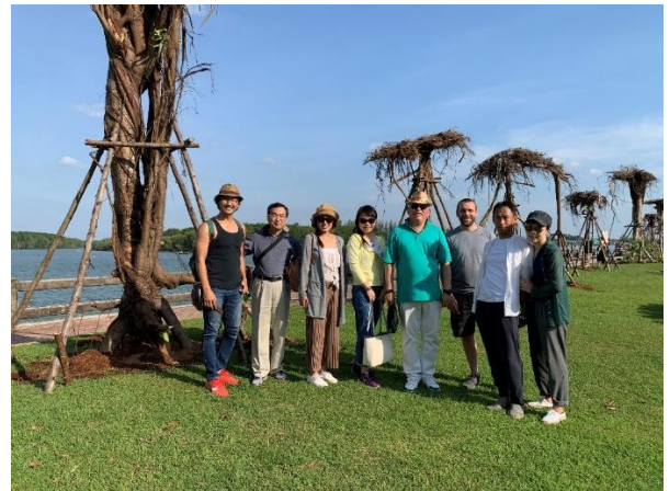
圖 15. 位於甲米河畔的作品「倒種的樹」。