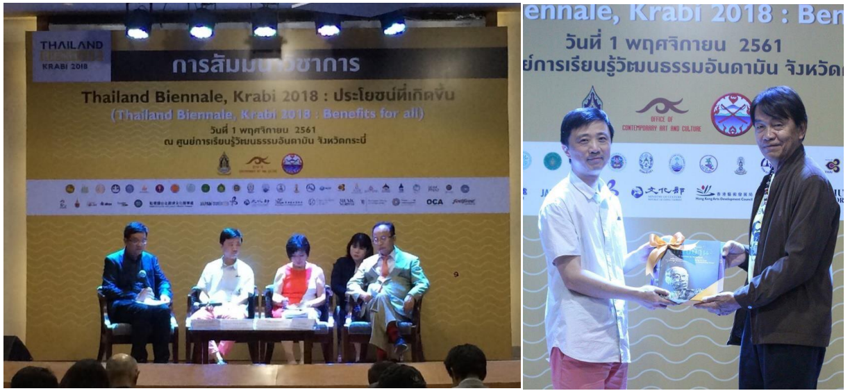
圖 29. 泰國國際雙年展大師講座活動主背板露出本部部徽及名銜。