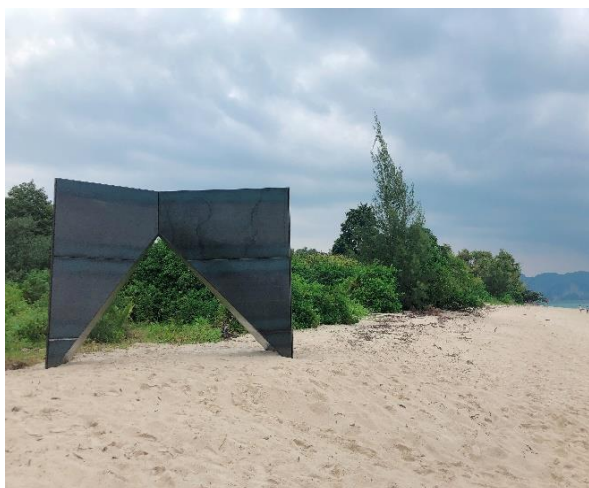
圖 20. 挪威奧斯陸藝術家 Ianas Krunglevicius 位於 Poda Island 的作品《Vision》。

在甲米外島之一 Poda Island 所陳設、較具代表性的作品，為挪威奧斯陸藝術家 Ianas Krunglevicius 的《Vision》(圖 20)。藝術家擅長結合視覺及聲音創作裝置、影片及物件，藉以探索人類心理機制及科技體驗之間的關係。這次於 Poda Island 的音像裝置形象受到「哨子」的啟發，作品捕捉海風並發出微風的聲響，觀眾聽到的是如遠處傳來的歌聲，而聲音所傳達的是預警式的加密訊息；位於 Noppharat Thara Beach 的作品《Ghost Island》則由香港藝術團隊 Map Office 所創作(圖 21)。島嶼形狀的作品是由廢棄漁網堆成，藝術家欲傳達甲米捕魚業興盛及其光鮮亮麗的旅遊勝地表面下，所產生的環境問題，包括越來越多的廢棄漁網導致海龜及其他海洋生物受到傷害。