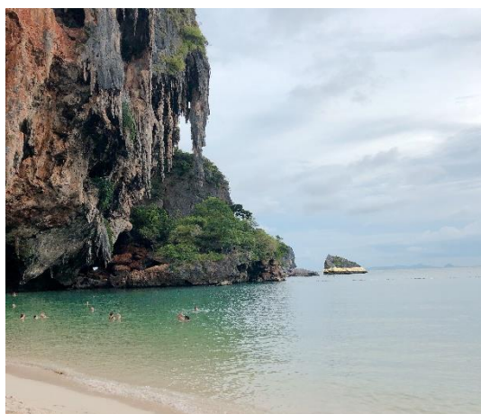
圖 24. 倫敦藝術家 Vong Phaophanit & Claire Oboussier 位於 Railay Beach 的作品《Gilding the Border》。