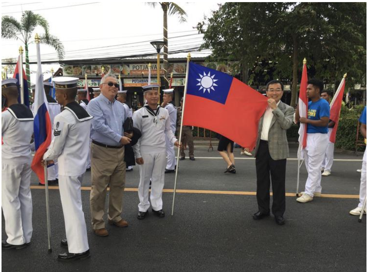
圖 30. 泰國國際雙年展開幕式遊行展示我國國旗。