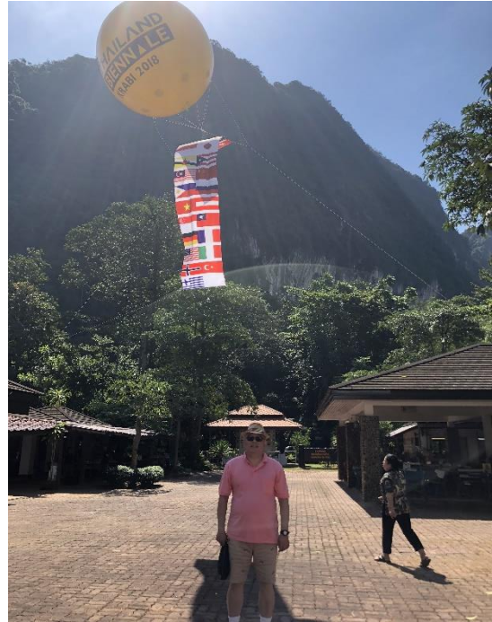
圖 32. 泰國國際雙年展國家公園展區我國國旗飄揚其列。