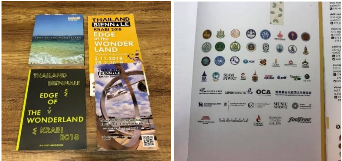
圖 28. 我駐泰國代表處正式名銜「駐泰國台北經濟文化辦事處 Taipei Economic & Cultural Office in Thailand」及本部名銜露出於泰國國際雙年展各式文宣手冊。

事處Taipei Economic & Cultural Office in Thailand」冠名，且名銜露出於本展各式文宣手冊；此外，泰方亦在開幕典禮、國家公園展區等場合陳設、懸掛我國國旗。於泰國嚴格貫徹一中政策原則之情勢下，意義非凡。