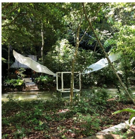
圖 18. 日本大阪藝術家 Rikuo Ueda 位於 Than Bok Khorani 國家公園的作品《Letter》。