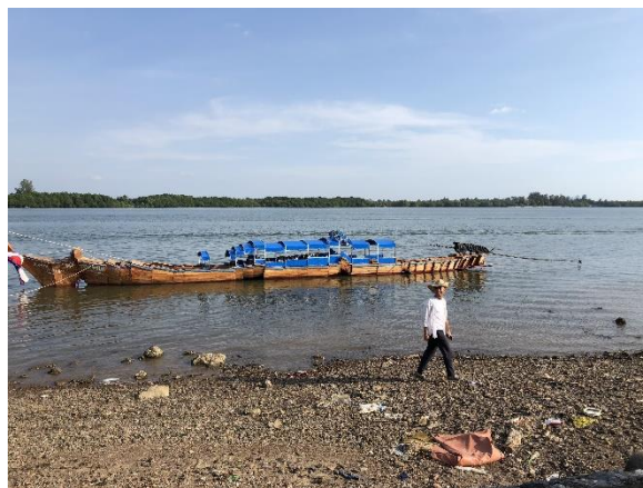
圖 12. 豪華朗機工本次參展作品《過境之時 Voyage in Time》。