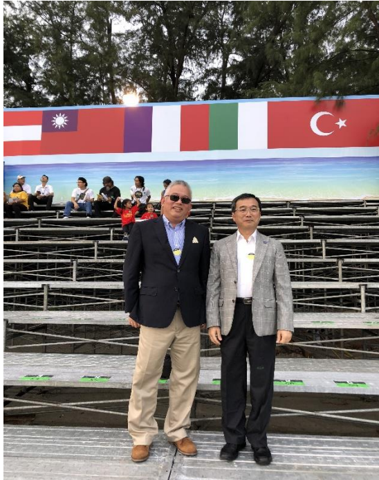
圖 31. 泰國國際雙年展開幕式會場陳列我國國旗。