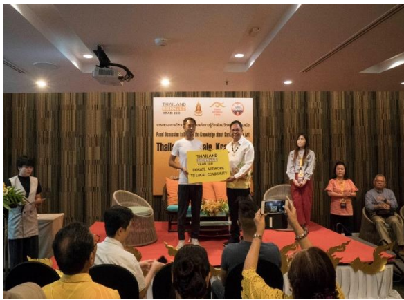
圖 33. 臺灣藝術家豪華朗機作品致贈儀式。

本次泰組以官方身分協助我國受邀之兩組藝術家向大會多次正式協調有關簽訂合約、爭取大會經費、要求捐贈作品儀式等惠我作法。臺灣藝術家反應本次參展感受到本部及泰組的支持，不僅順利收到泰方負擔款項，且向主辦單位爭取辦理作品捐贈儀式記者會，本部亦受邀出席見證。