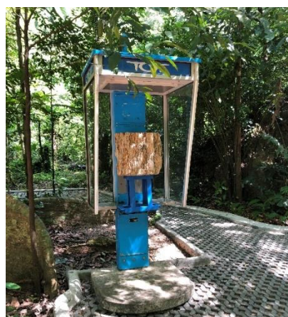
圖 19. 香港藝術家 Leung Chi Wo 位於 Than Bok Khorani 國家公園的作品《Monuments for Solitude》。