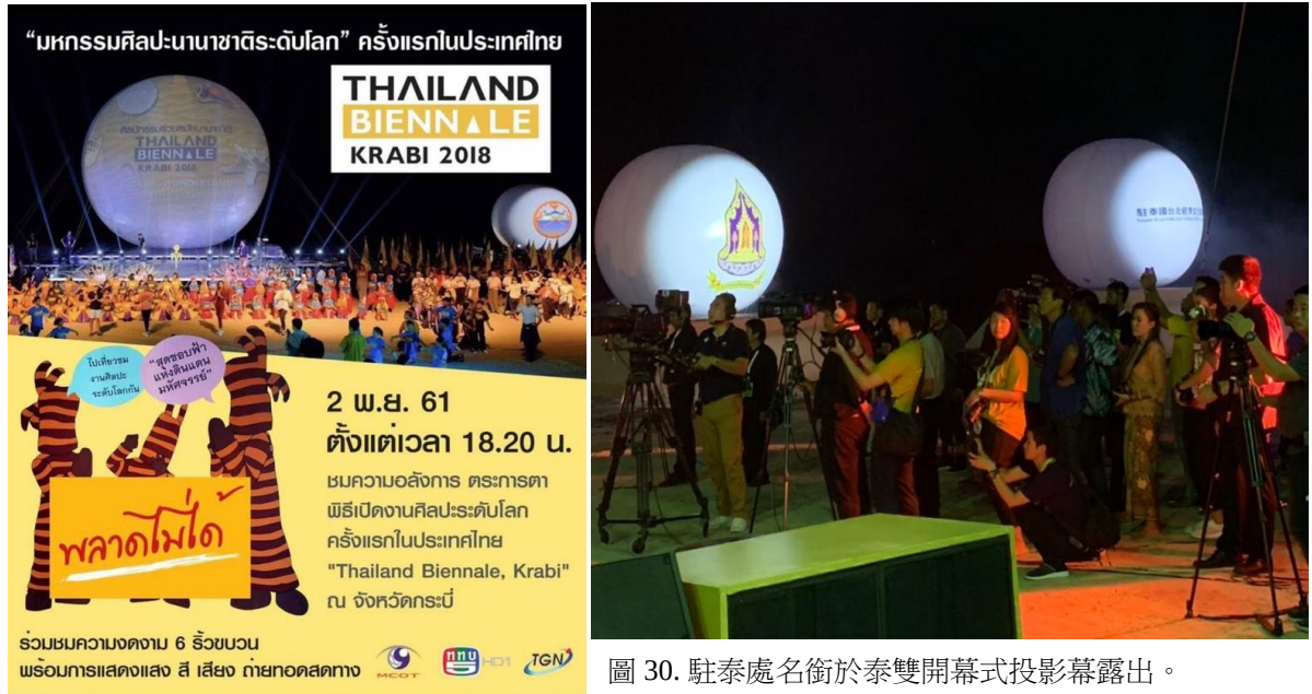
圖 30. 駐泰處名銜於泰雙開幕式投影幕露出。