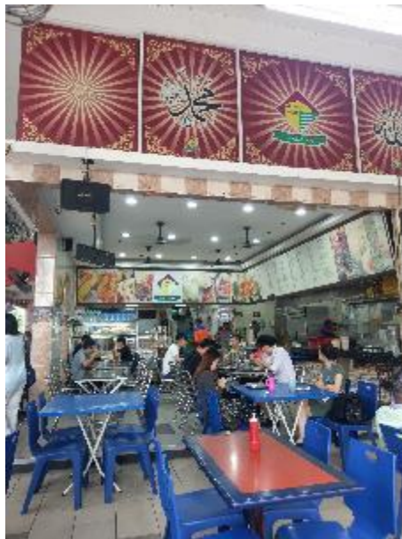
地方特色印度茶店