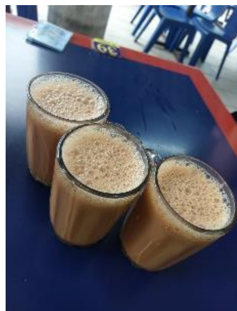
醇甜奶香之印度拉茶