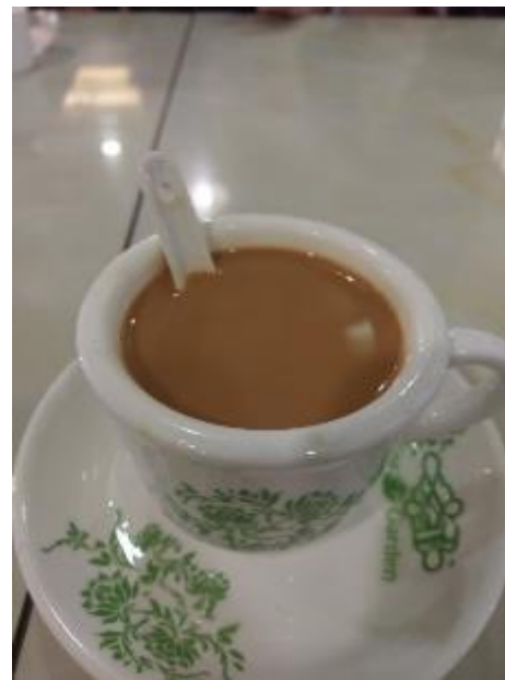
風味特殊之海南奶茶