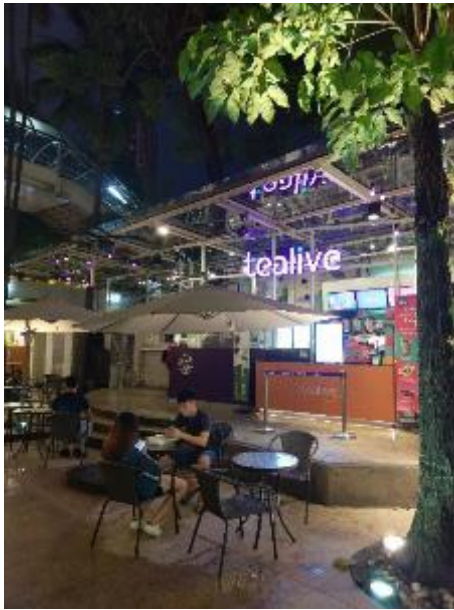
本地品牌 TEA LIFE