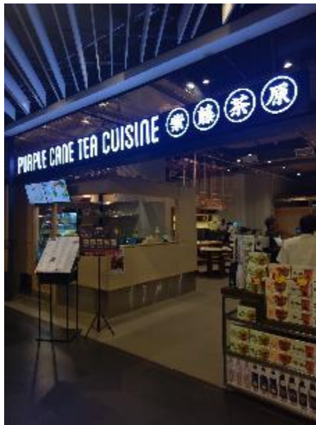
多元經營之茶餐廳