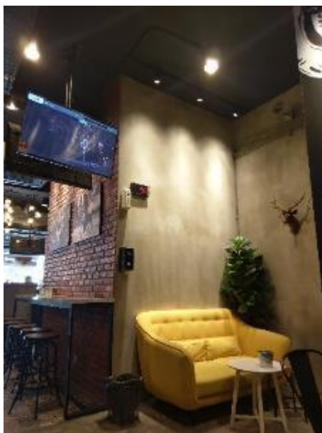
鹿角巷茶飲時尚店風